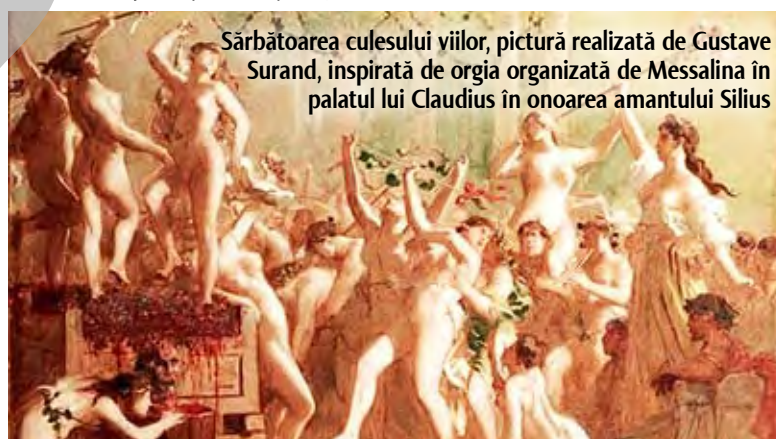
Sărbătoarea culesului viilor, pictură realizată de Gustave Surand, inspirată de orgia organizată de Messalina în palatul lui Claudius în onoarea amantului Silius