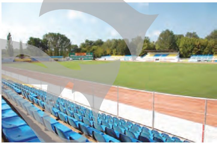
Stadionul din Slobozia, județul Ialomița

Cei din conducerea FC Oțelul au ales să-și joace meciurile considerate pe teren propriu la Slobozia, în condițiile în care nu mai au acces pe stadionul care poartă numele echipei, iar baza sportivă pe care o deține, „Zoltan David” (ex-Arcora), nu poate fi omologată pentru liga secundă în special din cauza