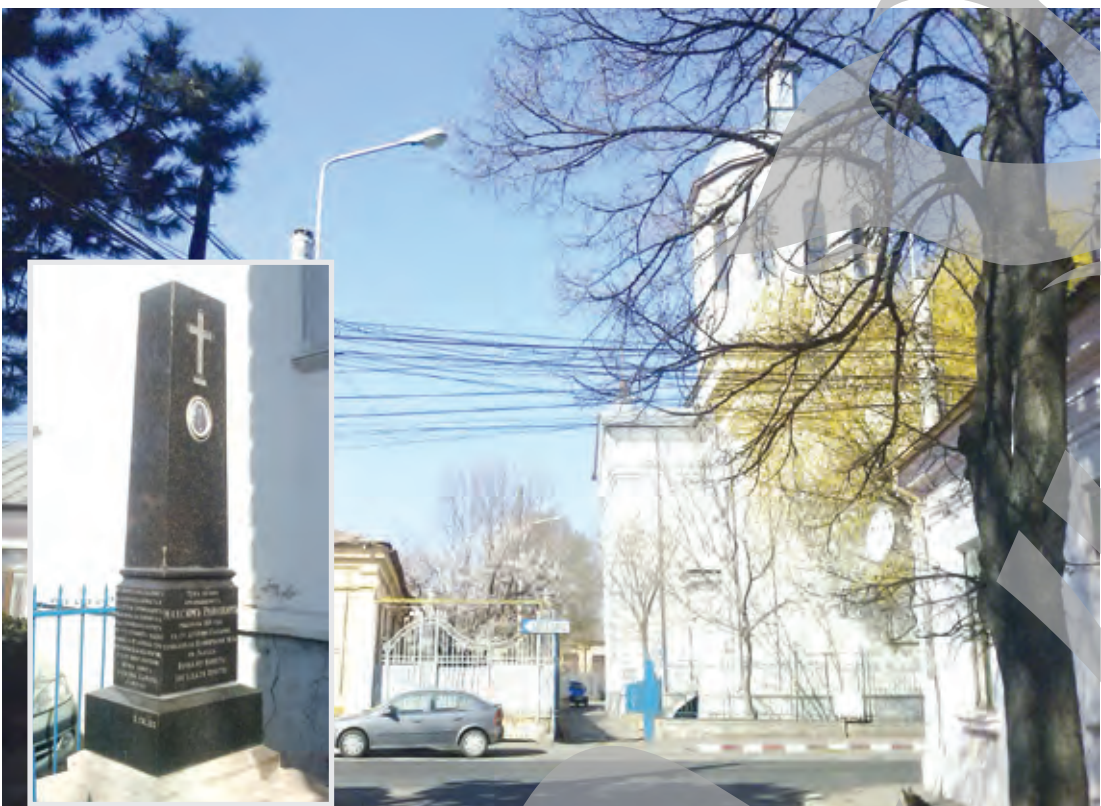
„Casa” caldă pentru refugiații bulgari

„Casa” caldă pentru refugiații bulgari Dr. Iavor Stoyanof, cercetător, consilier la Ambasada Bulgariei, însoțindu-l recent la Galați pe ambasadorul Aleksandar Filipov, ocazie cu care delegația a vizitat și biserica, puncta la colocivul științific organizat atunci de Muzeul de Istorie că bulgarii bogăți din Galați, deși nu luptau direct, le asigurau revoluționarilor fonduri pentru armament, muniții, uniforme. Și un lucru remarcabil: cum, sub ocupație turcească, bulgarii n-au avut dreptul de a-și dezvolta învățământul, prima academie bulgară a trebuit să fie de fapt fondată... în România, la București! Un revoluționar căzut cu arma în mână O placă de marmură ștearsă, pe zidul căsuței parohiale, cândva școală bulgărească, arată că Hristo Botev, poet și conducător al mișcării bulgare de eliberare națională, a locuit aici între 1871 și 1872. Emigrat în Țările Române între 1867 și 1876, când moare în luptă, la reîntoarcerea în Bulgaria, Botev a făcut la noi propagandă