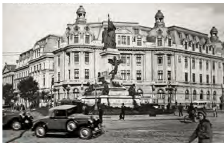
1936 Universitatea București