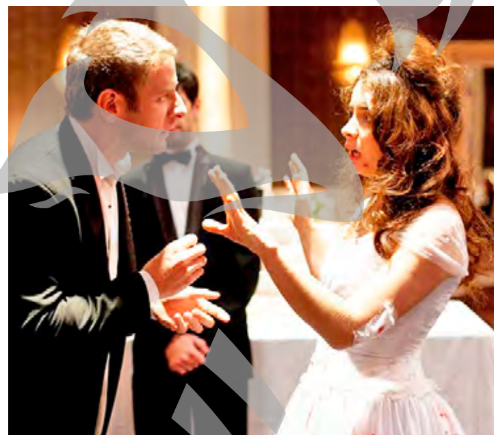
Scenă din filmul „Wild Tales”

Explozia comedie este o colecție de șase povești extrem de bizare, fiecare mai șocantă și mai amuzantă decât cea de dinainte. De la un joc al destinului la bordul unui avion, până la excese de furie