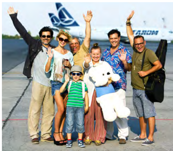
Scenă din filmul „America, venim!”

În a treia seară, sâmbătă, 22 august, gălățenii îi vor vedea pe Jude