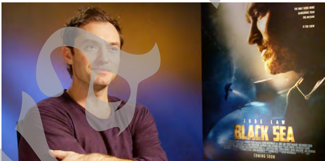
Jude Law, personajul principal din „Black Sea”

la volan. „Povești trăsnete” oferă un portret comic al societății, pline de defecte. Până în septembrie, Caravana TIFF va aduce 34 de filme din selecția Festivalului Internațional de Film Transilvania (TIFF) în peste 15 orașe din țară. Proiectul aduce în atenția pu-