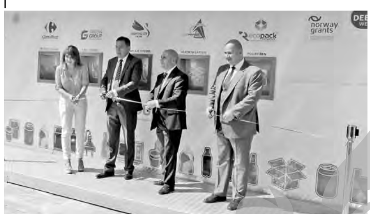
Colectarea, în secolul XXI