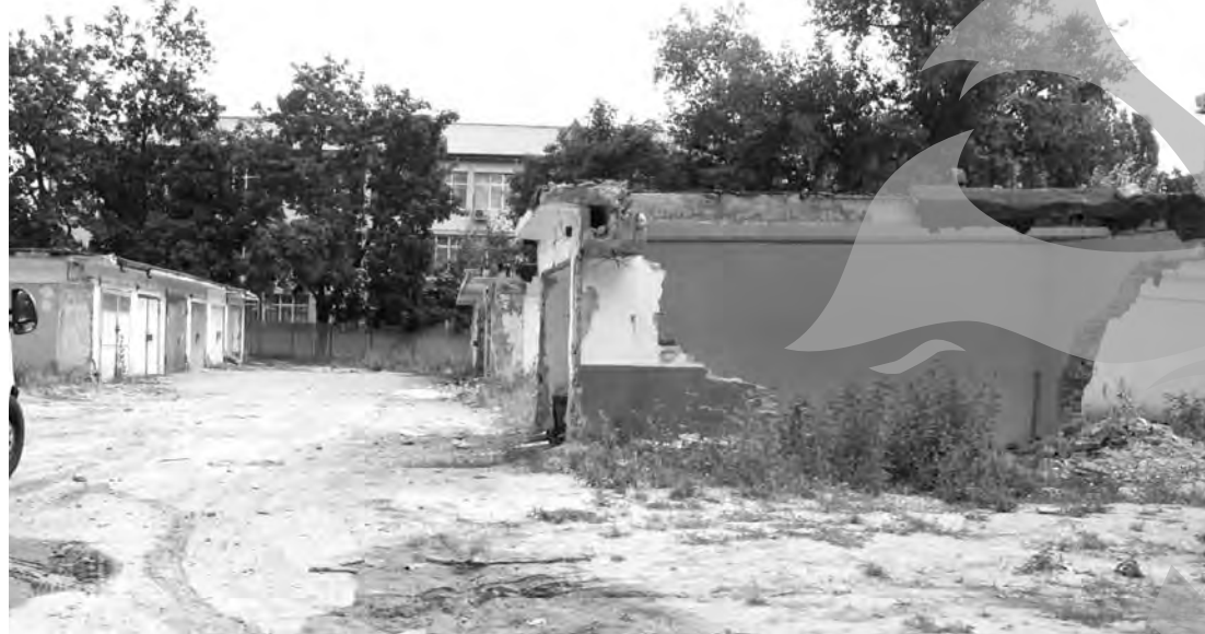
Jos construcțiile parazitare!

Iată ce soluții sunt propuse în planul urbanistic zonal aflat, încă, în dezbatere publică.