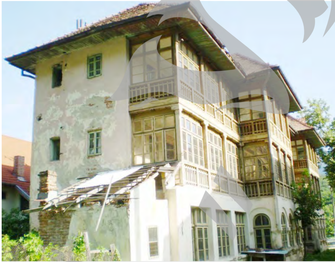
atunci când trec prin zonă”.

Primarul din Călimănești spune că le-a cerut, în repetate rânduri, autorităților gălățene să consolideze casa de vacanță, dar a primit în schimb doar „indiferență” Sesizări cu nemiluita din partea celor care locuiesc în stațiune, întrucât vila este un pericol pentru trecători