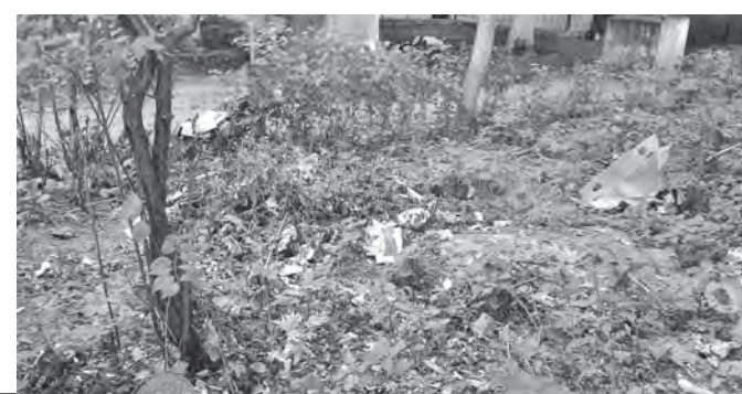
Mizeria mustește lângă tarabe - Așa arată una dintre grădinile care mărginesc Piața Veche