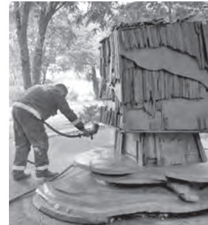
Vopsitul sculpturilor, durere veche