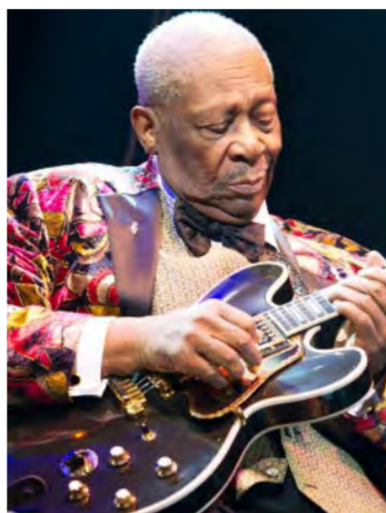
Blues Boy King, care, în cele din urmă, a devenit B. B. King. După ce a lansat, în anul 1951, hit-ul „Three O'Clock Blues”, muzicianul a început să organizeze turnee. În anul 1968, a cântat la Festivalul Newport Folk și la Bill

Riley B. King avea nevoie de un nume mai potrivit cu ceea ce făcea, așa că a primit pseudonimul Beale Street Blues Boy. Acesta a fost, mai apoi, redus la