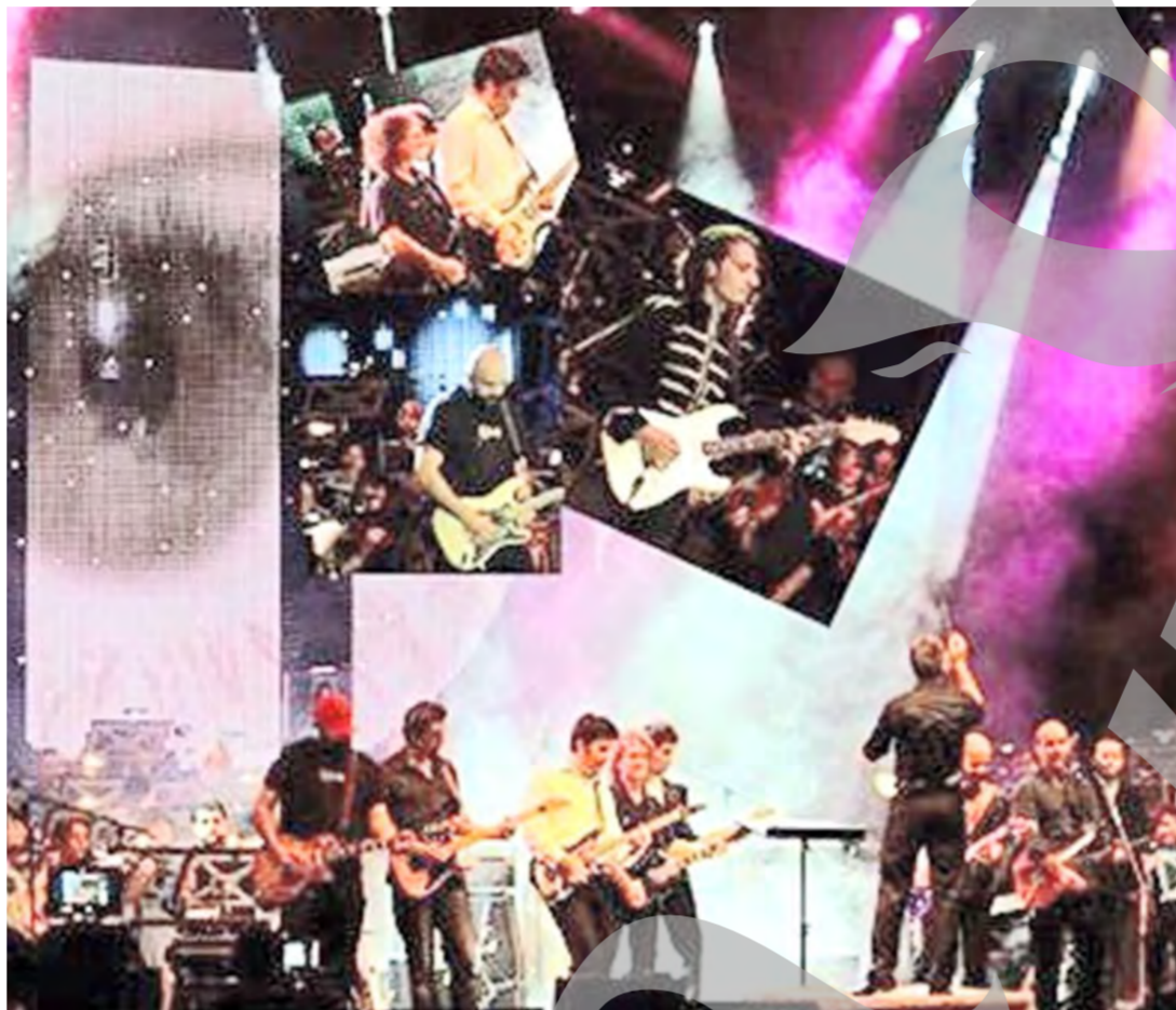
De la Bach, la Queen