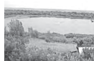
Balta Leahu, văzută din satul Rogojeni

„Pădurea de la Rediul Turcului, se spunea în poveștile copilăriei mele, a adăpostit ienicerii turci în rezerva trupelor care îl înconjuraseră pe Ioan Vodă cel Cumplit la Roșcani. Tătarii așteptau în pădurea de la Rediul Tătarului, răstimp în care au prădat satul numit azi Suceveni, și au schingiuit și ucis locuitorii ai locului pentru a afla unde sunt proviziile, animalele și restul populației care se evacuasă. A scăpat