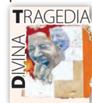
TRAGEDIA ION ZIMBRU

► Spre sfârșitul anului ar urma să mai iasă două vedete închise în Dosarul Transferurilor. Ambii scriitorii, ce mama naibii... Pleșule, lasă-te!