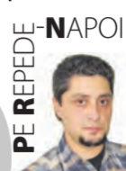
PE REPEDE - NAPOLI Dan Lungu danlungu@viata-libera.ro

- Poate, însă, sincer să fiu, sunt atât de pasionat de profesia mea de regizor încât mă concentrez mai mult asupra creației regizorale. Acum am fost invitat la Teatrul „Arlecchino” din Brașov, un teatru de animație foarte fain, în urma succesului pe care l-am avut cu „Muzicanții din Bremen”, la Teatrul „Tândărică”, unde am avut uriașul șoc să-i am în distribuție pe foști colegi de promoție. Piesa de Radio este „Chilli Ramirez”, în care Ioan Gyuri Pascu, cel care a scris textul, povestește și cântă despre un șoricel foarte viteaz care-i înfruntă pe motanii cei răi. Și vreau să spun că și povestea, dar și harul extraordinar al lui Gyuri și talentul său de a cânta sunt formidabile. Cum am ajuns la el? Am avut inspirația să-l invit să facă muzica la „Muzicanții din Bremen”.