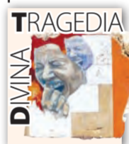
TRAGEDIA DUMNEZEU BINECUVĂNTEAZĂ AMERICA

► Puiu Hașotti de la PNL face glume proaste: social-democrații au de ales între Liviu Dragnea și Dragnea Liviu. Hai s-o duc eu până la capăt: Opoziția face opoziție sau nu merge la putere. Și n-o deranjează.