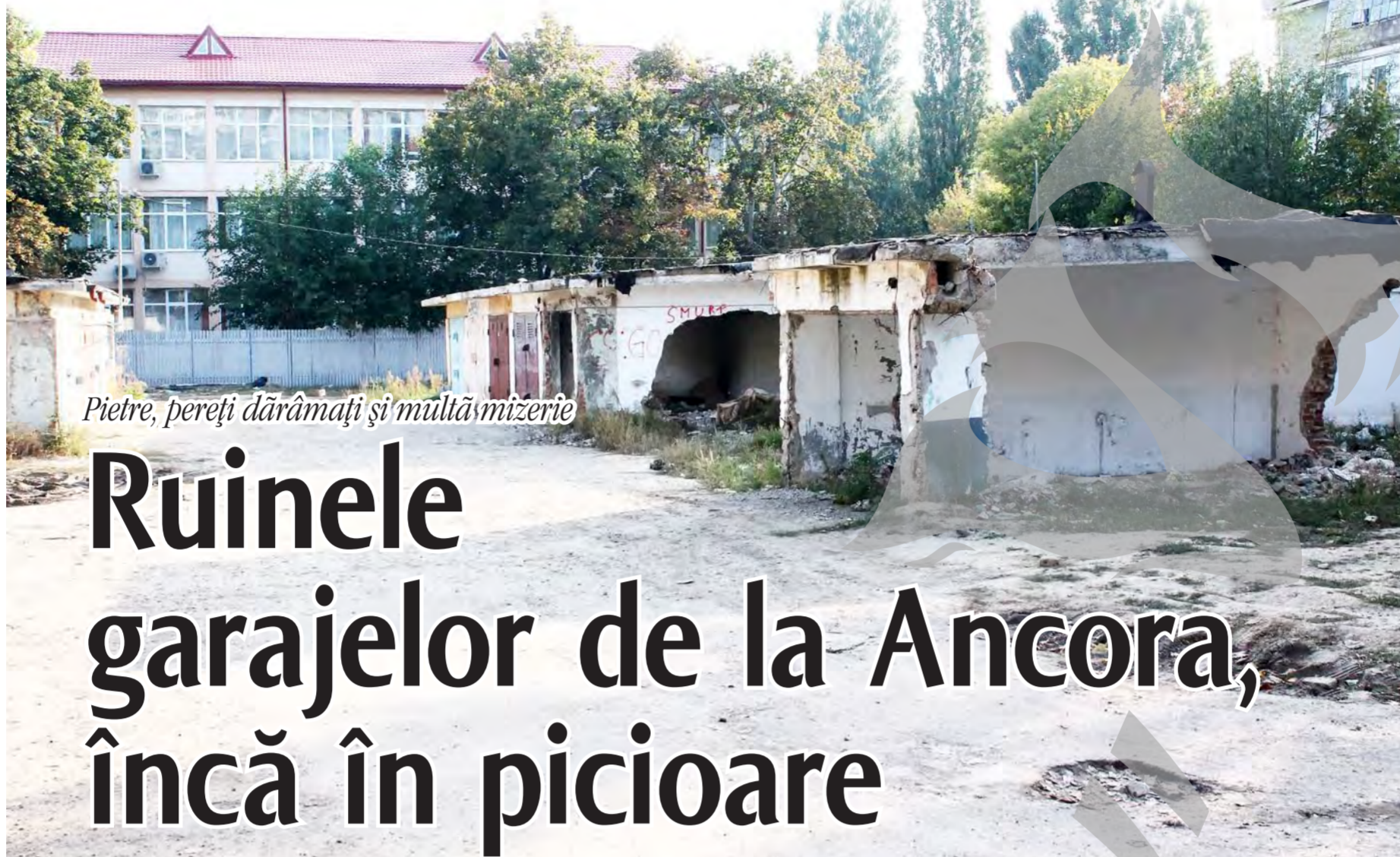
Pietre, pereți dărâmați și multă mizerie

Cu toate acestea, oamenii se opresc în fața acestor chioșcuri mai mult decât la piață, pentru că au mai multe opțiuni. „La chioșc am de unde alege. E drept, ocupă spațiu, dar sunt aici în zonă de atâția ani încât ne-am obișnuit, nici nu îi mai observ. Primăria să asigure locuri de muncă și apoi să dărâme chioșcuri”, ne-a declarat o femeie.