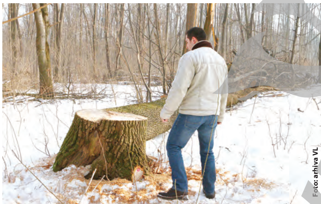
Defrișări ilegale la Buciumeni, în luna ianuarie a acestui an

Pădurile Galațiului nu sunt nici la fel de masive și nici la fel de pro-