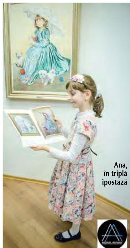
Ana, în triplă ipostază

La Salonul literar al Bibliotecii „V. A. Urechia”