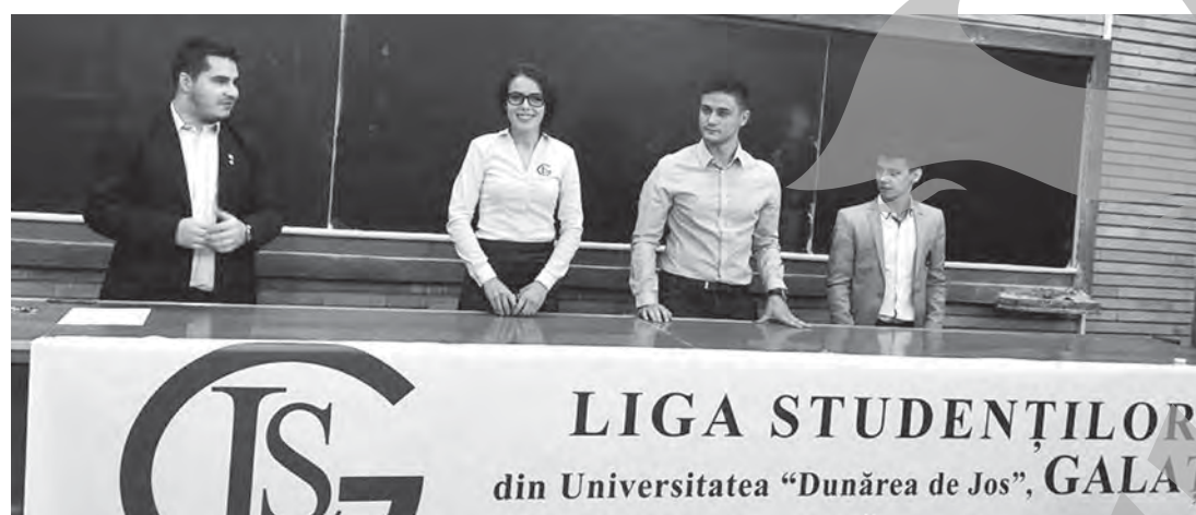
LIGA STUDENȚILOR din Universitatea „Dunărea de Jos”, GALAȚI

Președinta LSG își propune să implice studenții în programe de tineret cu specific cultural, social,