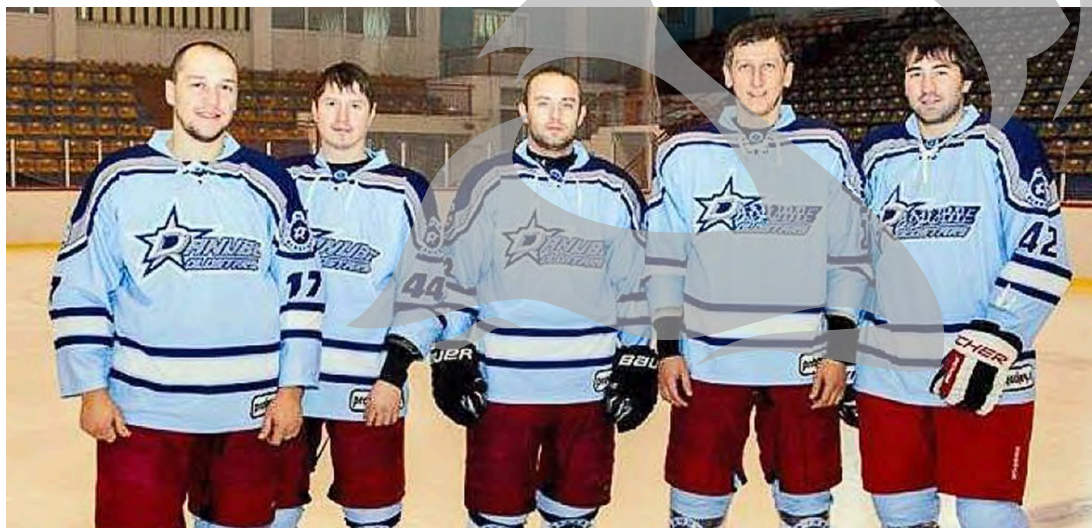
Cei cinci ucrainenii de la Clubul Dunărea

Pe lângă absențele din echipa gălățeană, dificultatea meciurilor de vineri și sâmbătă este amplificată și de puternica campanie de transferuri făcută de ciucani în ultima perioadă. Astfel, HSC M. Ciuc are în acest moment în lot nu mai puțin de 13 jucători din străinătate: patru ruși, trei