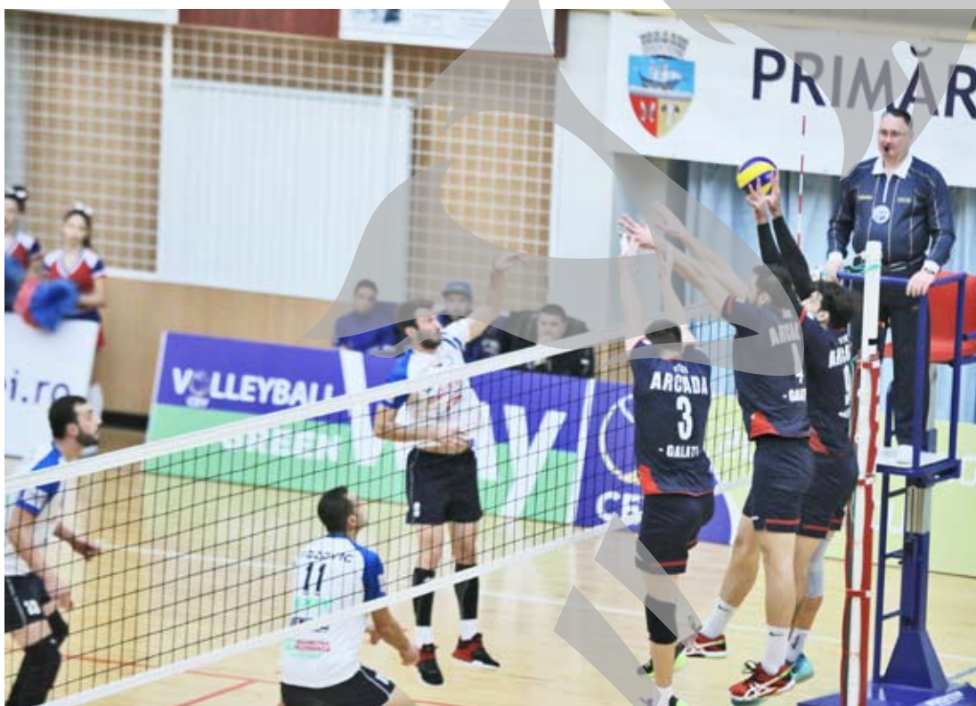
Echipa gălățeană a excelat la blocaj

Setul patru a avut un început similar cu cel secund, OK Novi Pazar a condus cu 3-1, dar acestea au fost ultimele emoții din acest meci pentru echipa gălățeană și supporterii săi. Cei de la Arcada au făcut ravagii cu blocajul, au reușit cinci puncte consecutive până la