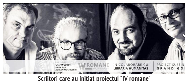
Scriitorii care au inițiat proiectul "IV romane"