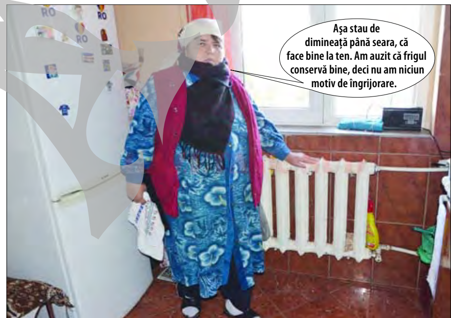
Cetățean conștient de avantajele de care beneficiază în Galați