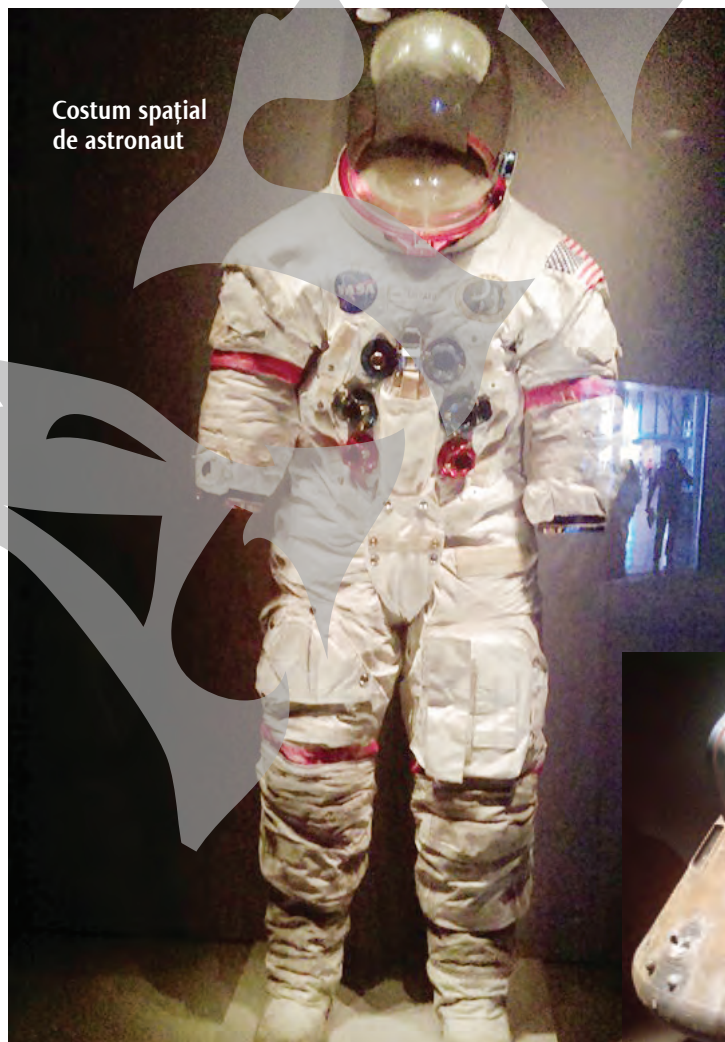
Costum spațial de astronaut