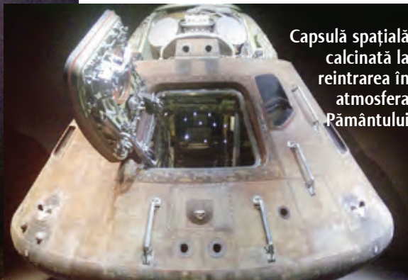
Capsulă spațială calcinată la reîntrirea în atmosfera Pământului