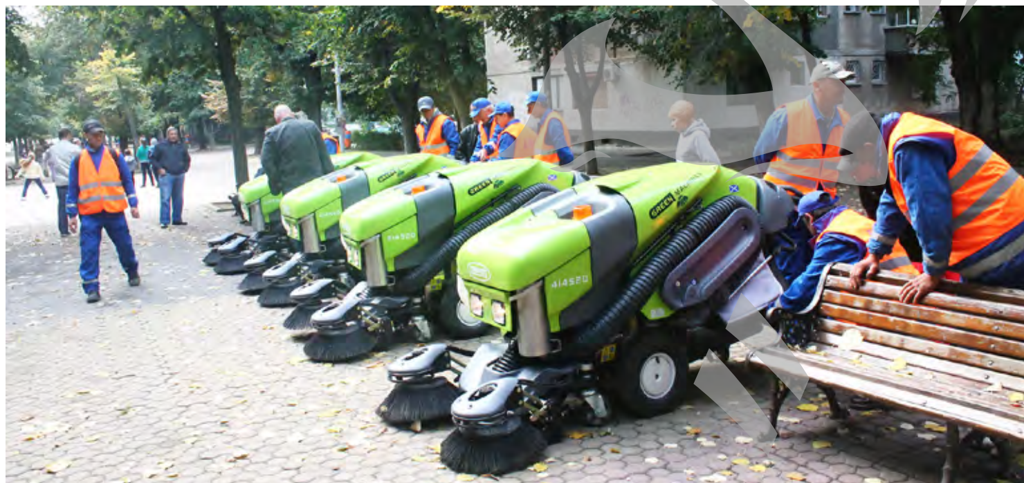
Măturătorile mecanice achiziționate în 2014

Străzile sunt pline de angajați Ecosal care dau la mătură, fie vară, fie iarnă. Este praf și, în orice caz, curățenia nu poate fi realizată la fel de bine cum ar fi făcută cu o mătură profesionistă, mecanică. Ce-i drept, dacă ar fi să gândim un pic mai profund, nici străzile nu sunt făcute pentru automăturători. Prea bine nu stăm nici când vine vorba de utilaje pentru dezapezire; în fiecare an, Ecosal trebuie să închirieze utilaje sau oameni cu utilaj, pentru a-și putea face treaba, dar asta ține și de modul în care este programat procesul de dezapezire, pentru că o împărțire pe cartiere, așa cum ni se promite iarna aceasta, nu e rea deloc. Oricum ar fi, rămâne întrebarea, ce se întâmplă cu taxa de habitat pe care o plătim către Primărie? Ei bine, am fost curioși să vedem câți bani a investit Primăria în utilajele serviciului care se ocupă de curățenia străzilor, de colectarea gunoiului și de dezapezirea pe timp de iarnă. Dar să vedem și cât a cerut Ecosalul de la Primărie, pentru a-și îmbunătăți activitatea.