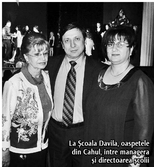
La Școala Davila, oaspetele din Cahul, între managera și directoarea școlii

Ediția a XXII-a a Balului Bobocilor la Școala Postliceală „Carol Davila” din Galați, desfășurată săptămâna trecută în sala Teatrului Dramatic „Fani Tardini”, a fost mai plină de surprize ca niciodată! Dacă am mai avut ocazia să întâlnesc la activități didactice, culturale sau distractive, elevi de la școli similare veniți în vizită din Franța, Elveția sau din