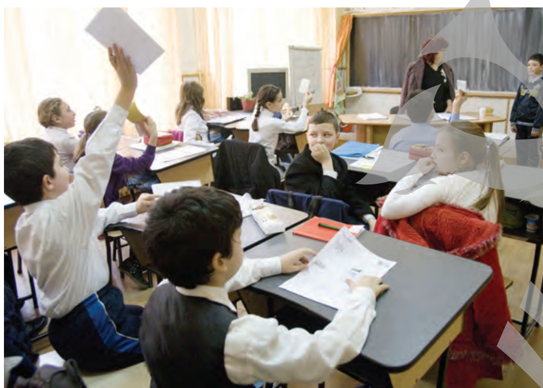
de stat și de instituțiile acestuia, se are în vedere interesul superior al copilului, bunăstarea acestuia.

Potrivit Declarației privind drepturile copilului din 1959, toți copiii se bucură de toate drepturile și trebuie tratați nediscriminatoriu de către statul în care locuiesc. În toate acțiunile întreprinse