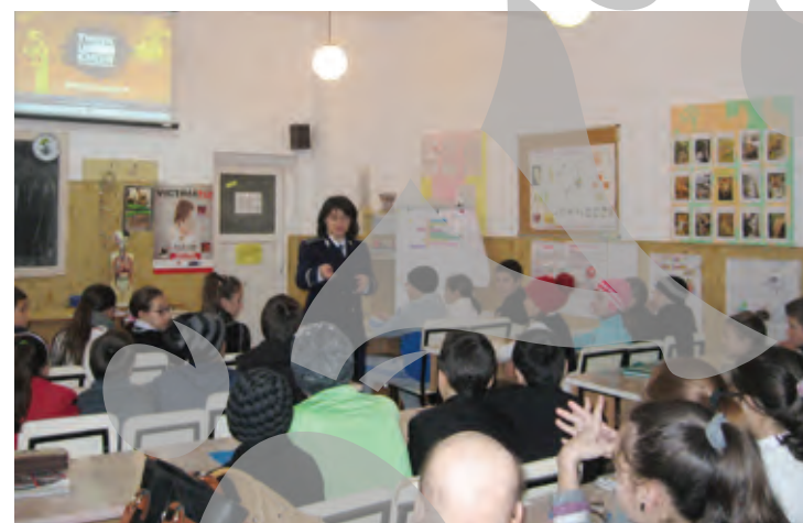
O polițista din Galați, în timpul unei acțiuni de prevenție a infracționalității juvenile

(2) Față de minorul prevăzut în alin. (1) se poate lua o măsură