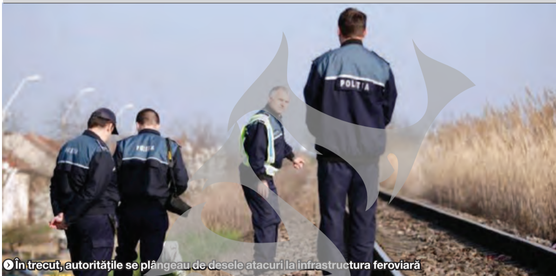
▶ În trecut, autoritățile se plâneau de dese atacuri la infrastructura feroviară