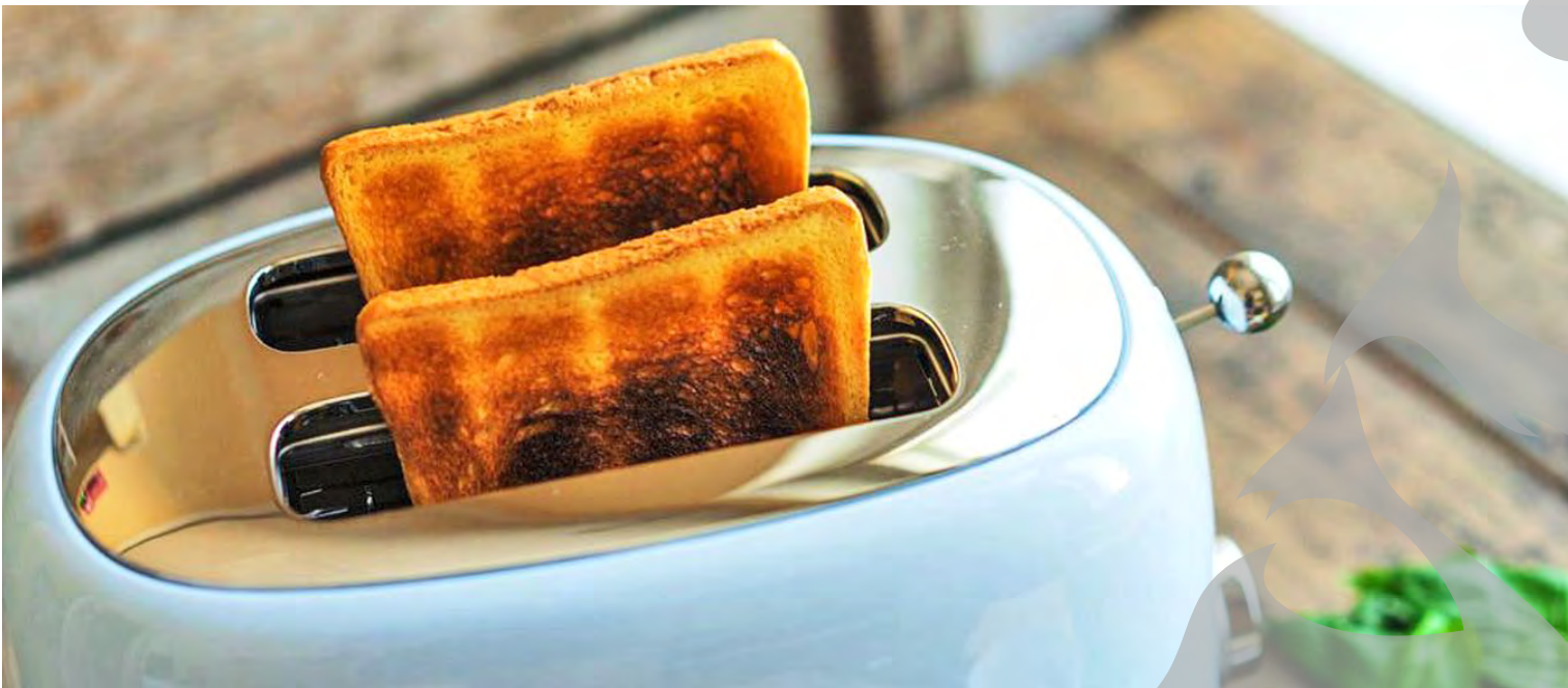
● Pâinea nu trebuie prăjită până devine neagră

ATENȚIONARE A MEDICILOR DIN MAREA BRITANIE ● NUTRIȚIE