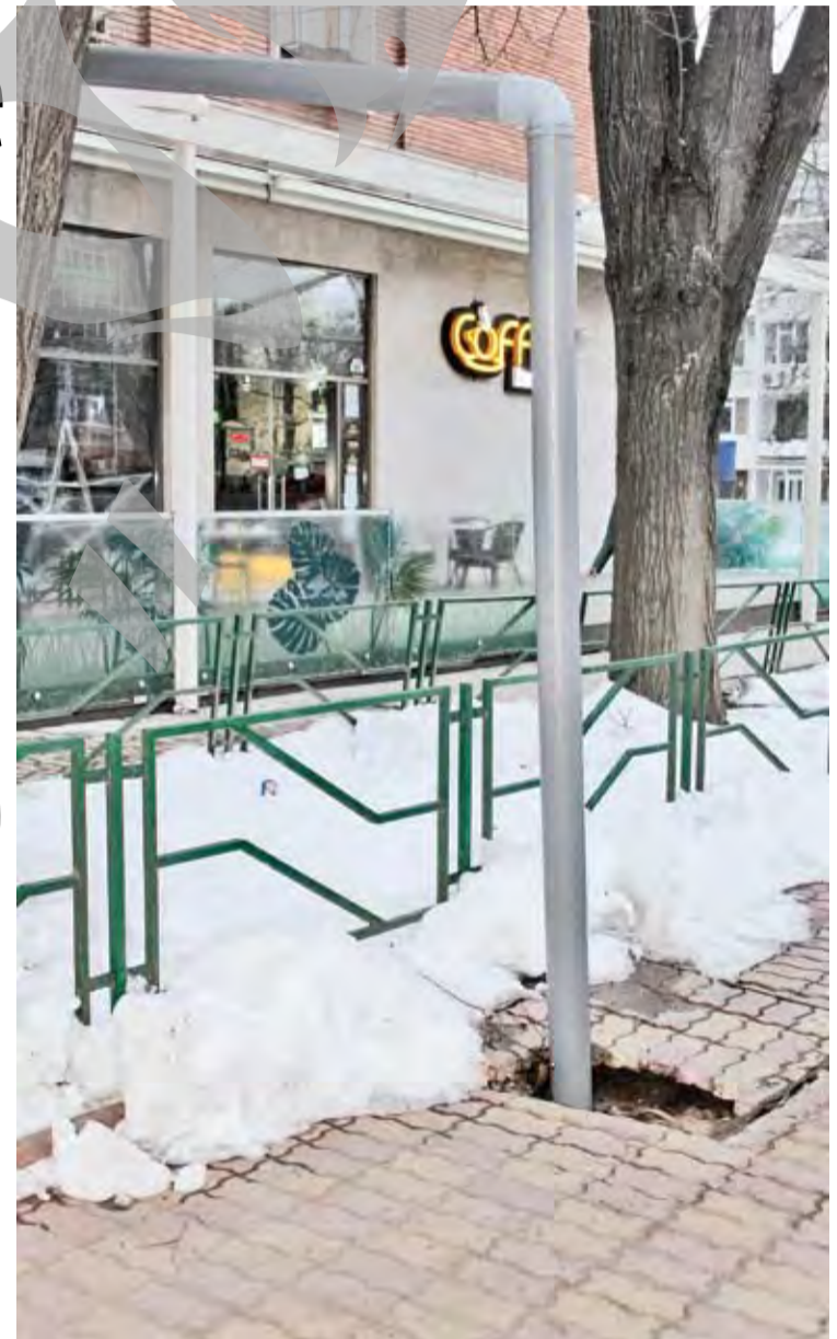
► Teava de canalizare suspendată din centrul orașului