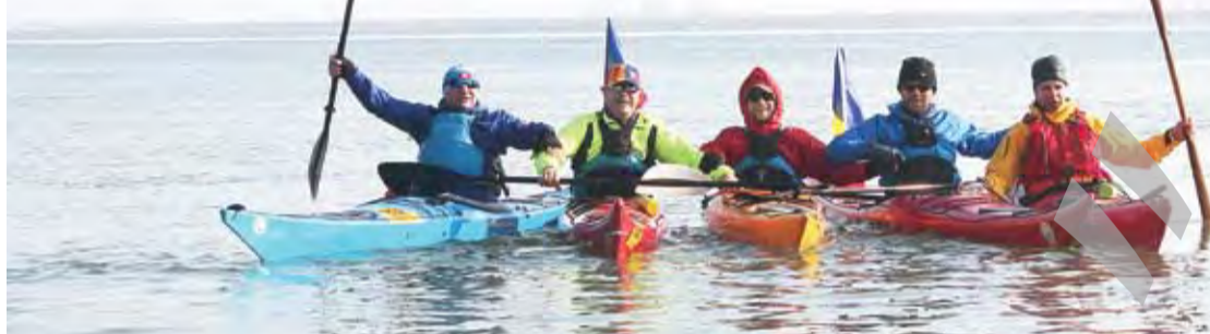
► Hora Unirii este mai palpitantă pe Dunăre