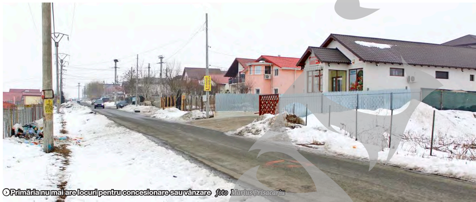
◉ Primăria nu mai are locuri pentru concesionare sau vânzare