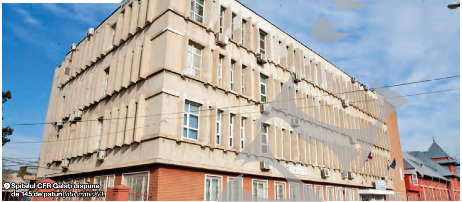
► Spitalul CFR Galați dispune de 145 de paturi foto arhivă VL

INFORMAȚII UTILE PENTRU BOLNAVI ● OPȚIUNI