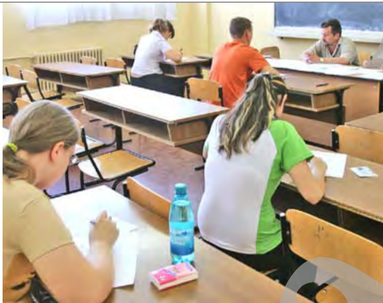
● Proba la română a fost simplificată ca să poată fi promovată de mai mulți elevi

Subiectul I, comun tuturor filierelor, profilurilor și specializărilor, are ca suport un text nonliterar, la prima vedere, și este alcătuit din doi itemi: o întrebare alcătuită din cinci sarcini de lucru a câte patru puncte fiecare, care urmăresc înțelegerea textului, și o cerință de tip eseu, având șase repere. Subiectul II, și el comun pentru toți, are ca suport un text literar la prima vedere, care vizează interpretarea și/sau comentarea unui text integral sau a unui fragment de text. Aici, elevului îi este solicitată prezentarea semnificațiilor unui text, în 50 de cuvinte, evidențiind două trăsături ale unui curent.