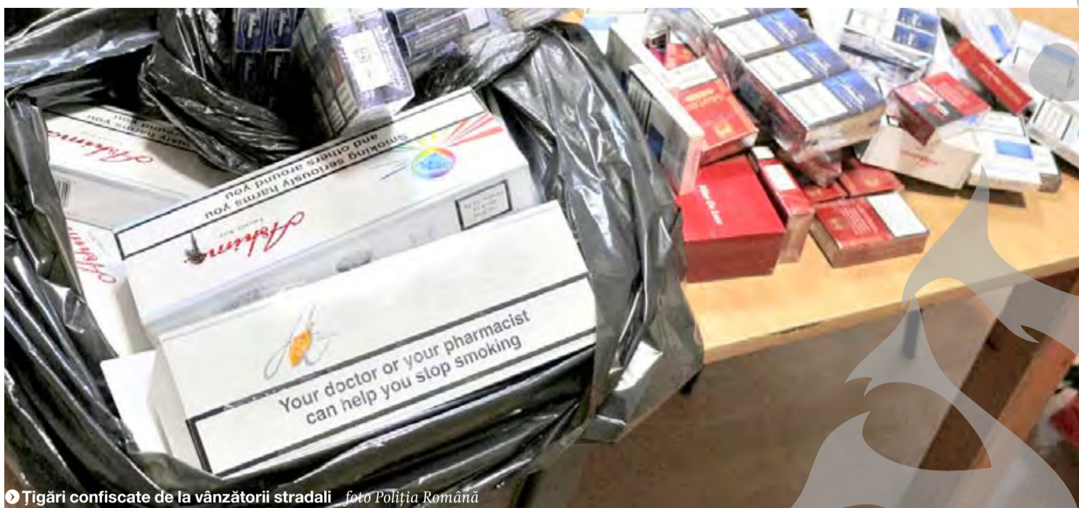
● Țigări confiscate de la vânzătorii stradali

PIC CU PIC SE FACE MULT ÎN CONTRABANDA CU TUTUN ● STATISTICĂ