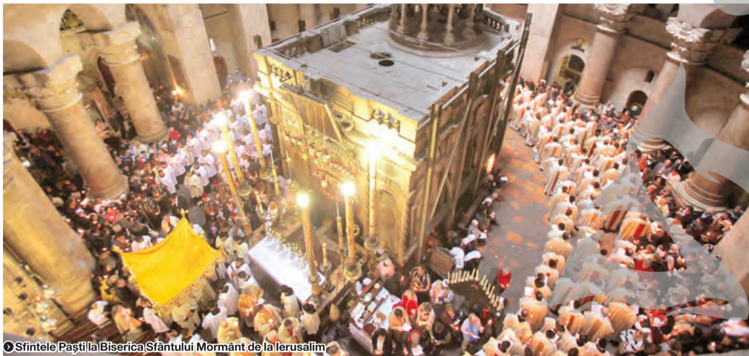
Sfintele Paști la Biserica Sfântului Mormânt de la Ierusalim

ISTORIE ȘI DIFERENȚE ÎNTRE ORTODOCȘI ȘI CATOLICI ● CALENDAR