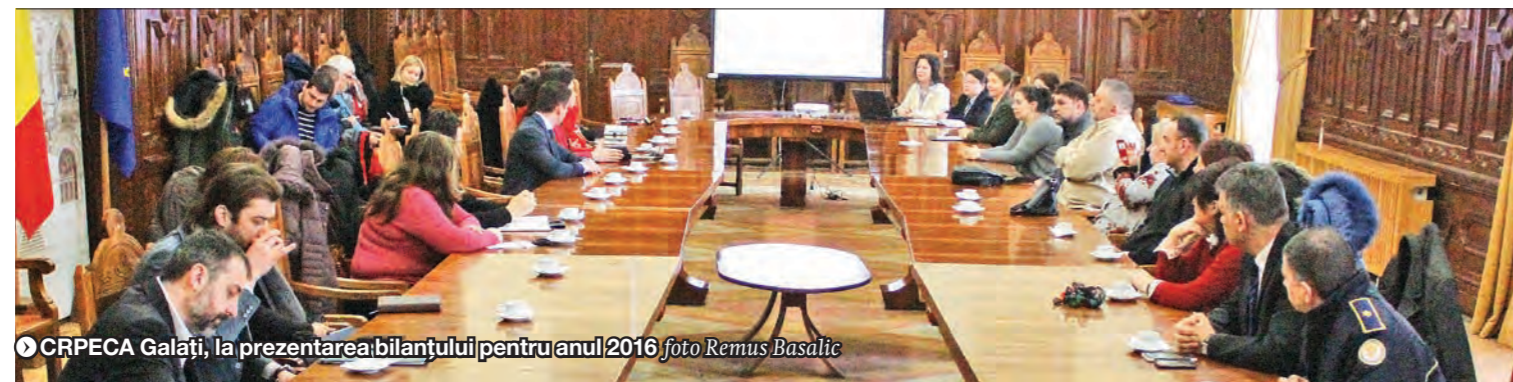
CRPECA Galați, la prezentarea bilanțului pentru anul 2016