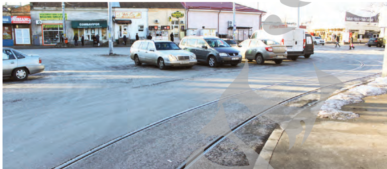
● Piața Centrală arată asemenea unui bazar dintr-un oraș turcesc

MICI ȘI BERE, COVOARE ȘI PERDELE ● BAZAR