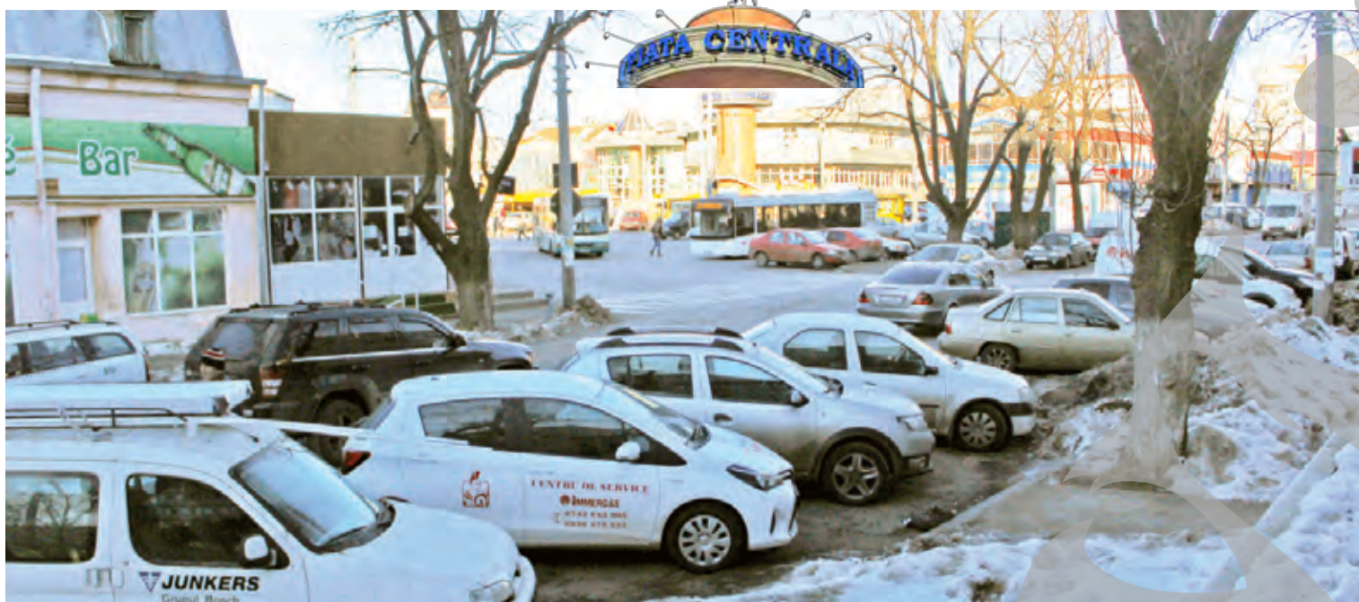
● Găsirea unui loc de parcare se poate dovedi a fi o misiune imposibilă, în Piața Centrală

FĂRĂ HIDRANȚI, FĂRĂ LOCURI DE PARCARE ȘI CU FRICA HOȚILOR ● PROBLEME