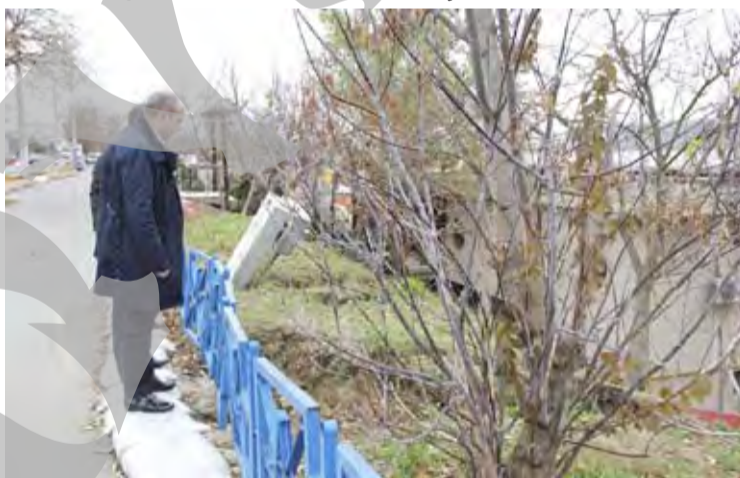
● Primarul Ionuț Pușcaneanu, inspectând situația ravenei de pe Faleză