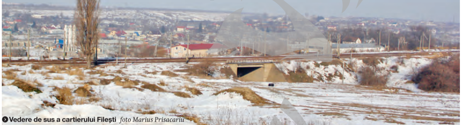
▼ Vedere de sus a cartierului Filești

FLORIN RĂVDAN florin.ravdan@viata-libera.ro