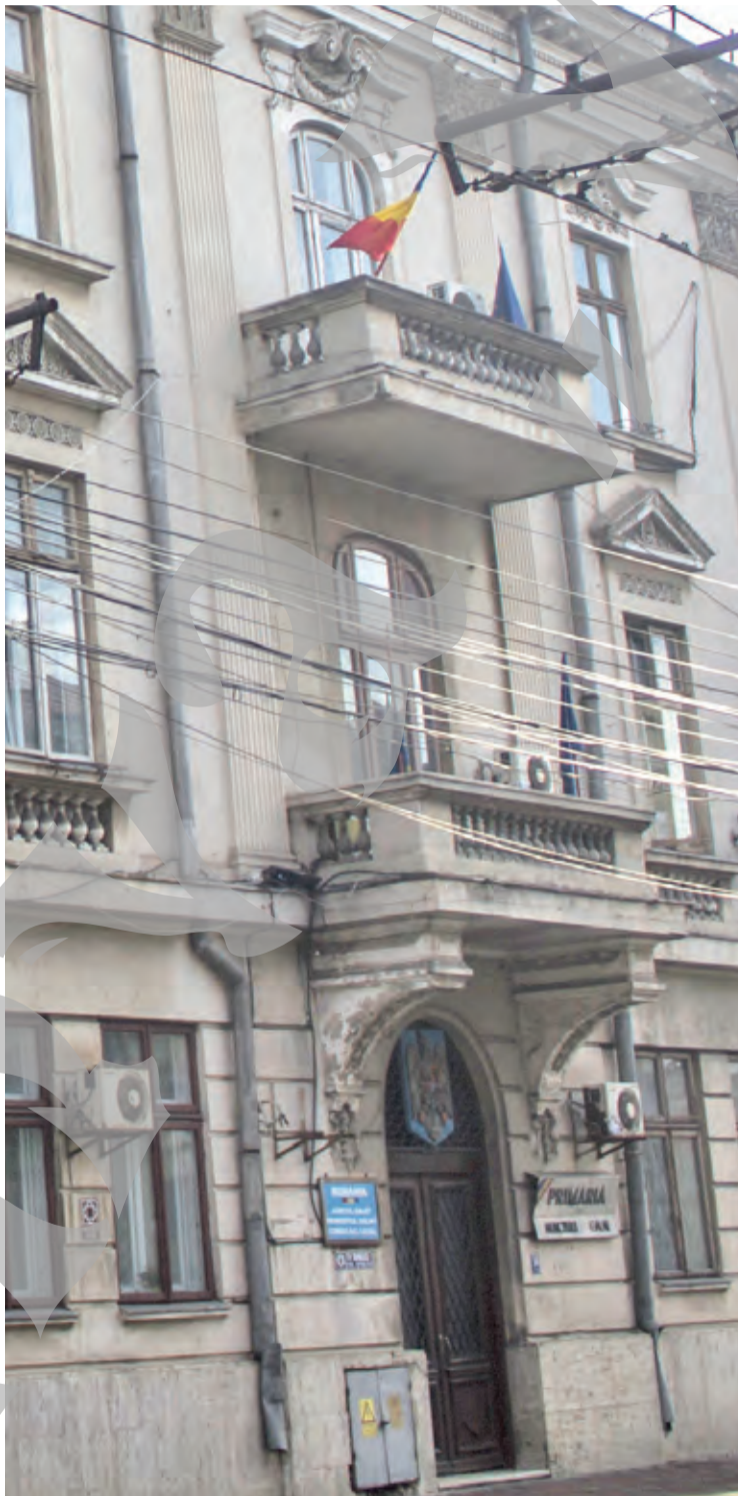
► Primăria municipiului Galați a încheiat 168 de contracte în urma realizării unor achiziții directe

PREȚ. Cele mai valoroase contracte atribuite direct în cele șase luni sunt: 360.000 de lei pentru stabilizarea terenului din zona Tirighina, 330.000 de lei pentru taluzarea Falezei, 337.728 de lei pentru reparații și igienizări la Plaja „Dunărea”. Ur-