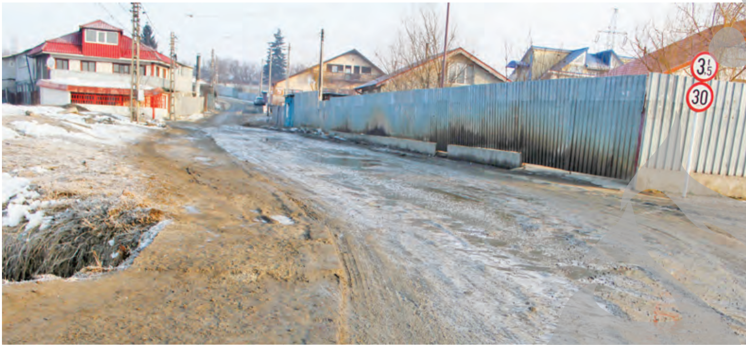
● Drumul de intrare în Filești, plin de noroi