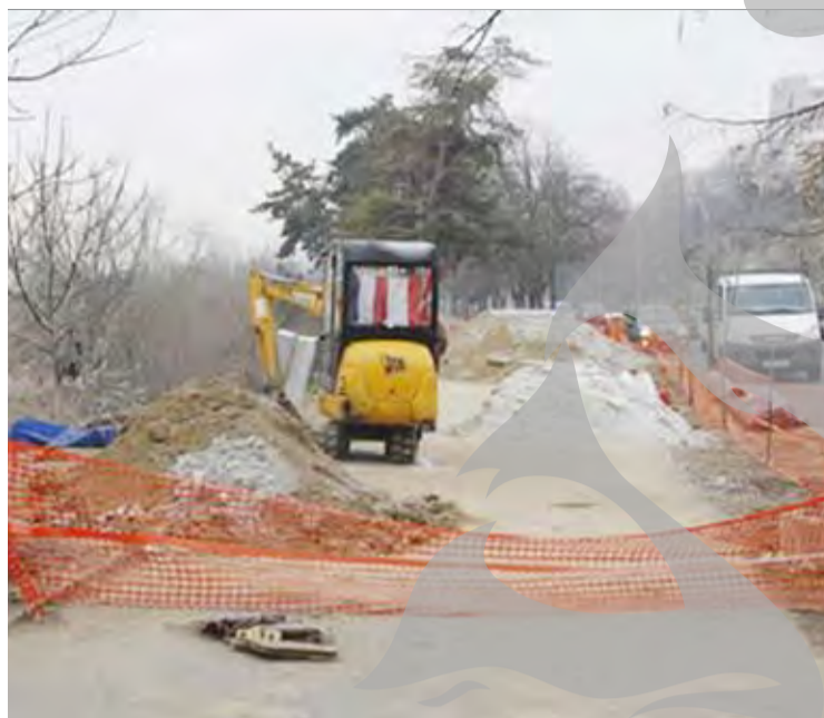
● Desfășurare de forțe pentru lucrările de stabilizare a Falezii

În 2015, conform datelor Primăriei, ATU Consulting a beneficiat de un singur contract, de 93.750 de lei, pentru lucrările de amenajare trotuare și locuri de parcare aferente blocurilor din cartierul Dunărea. ●