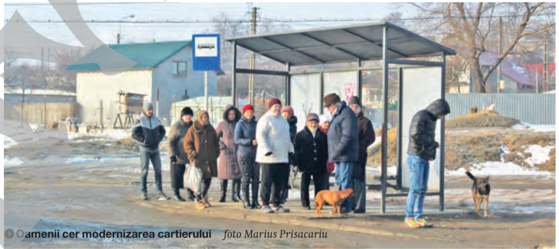
▼ Oamenii cer modernizarea cartierului foto Marius Prisacariu

CONTACT. În cazul în care nu reușiți să ajungeți la întâlnirea săptămânală din cartierele gălățene, pentru a ne spune, față în față, problemele cu care vă confrunțați în zona în care locuiți, „Viața liberă“ vă pune la dispoziție o adresă de e-mail la care puteți face sesizări. Astfel, este suficient să scrieți sesizarea dumneavoastră pe adresa florin.ravdan@viata-libera.ro, de unde va fi preluată spre publicare. Vă mulțumim! ● F.R.