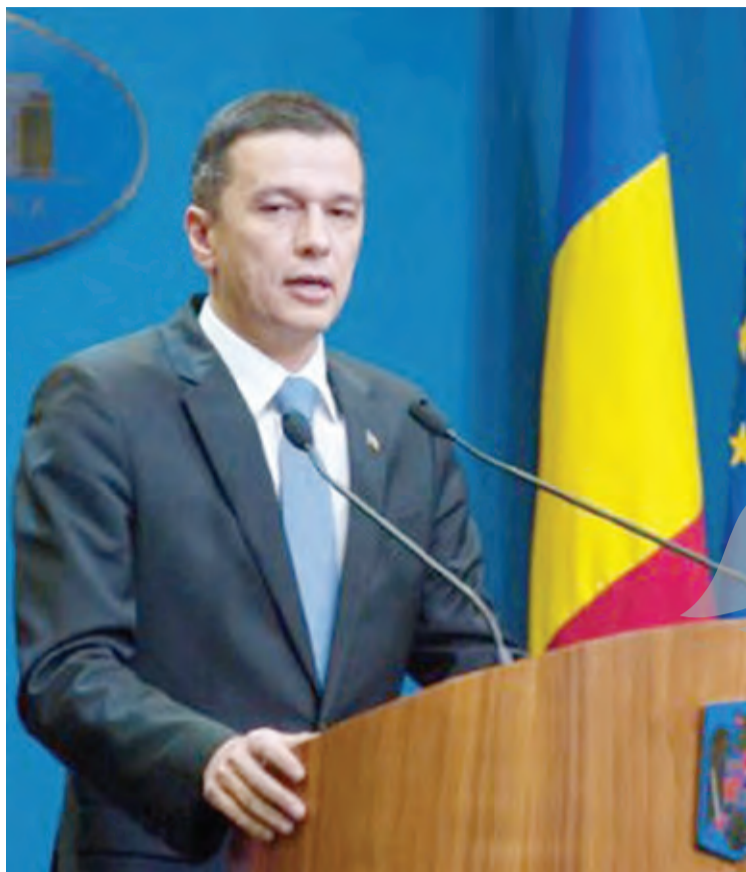
● Premierul Sorin Grindeanu a anunțat abrogarea OUG 13