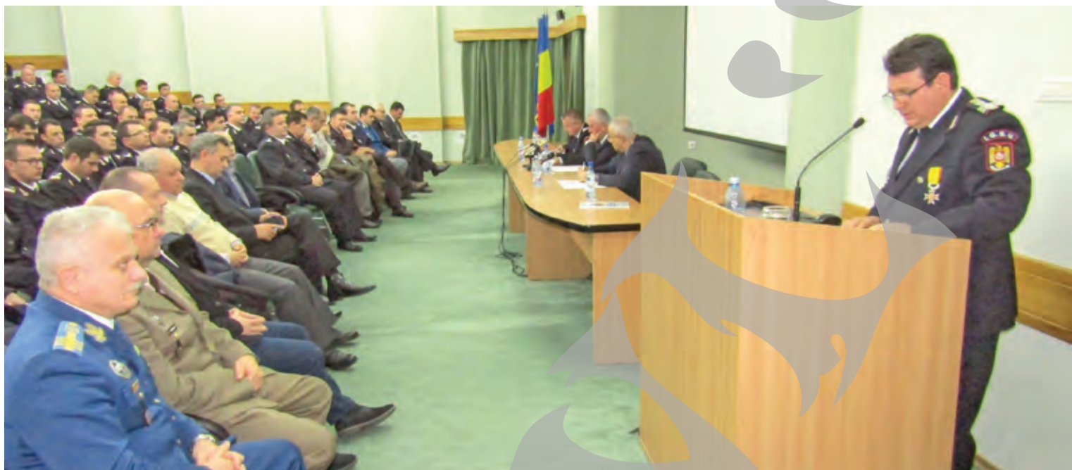
► ISU Galați și-a prezentat bilanțul pentru anul 2016

INSPECTORATUL PENTRU SITUAȚII DE URGENȚĂ, LA RAPORT ● BILANT