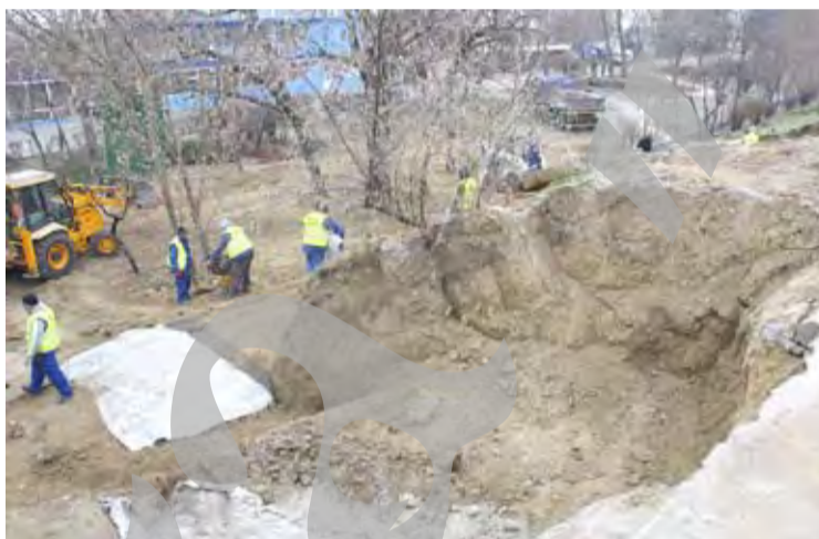
● Piloile au provocat alunecarea de teren