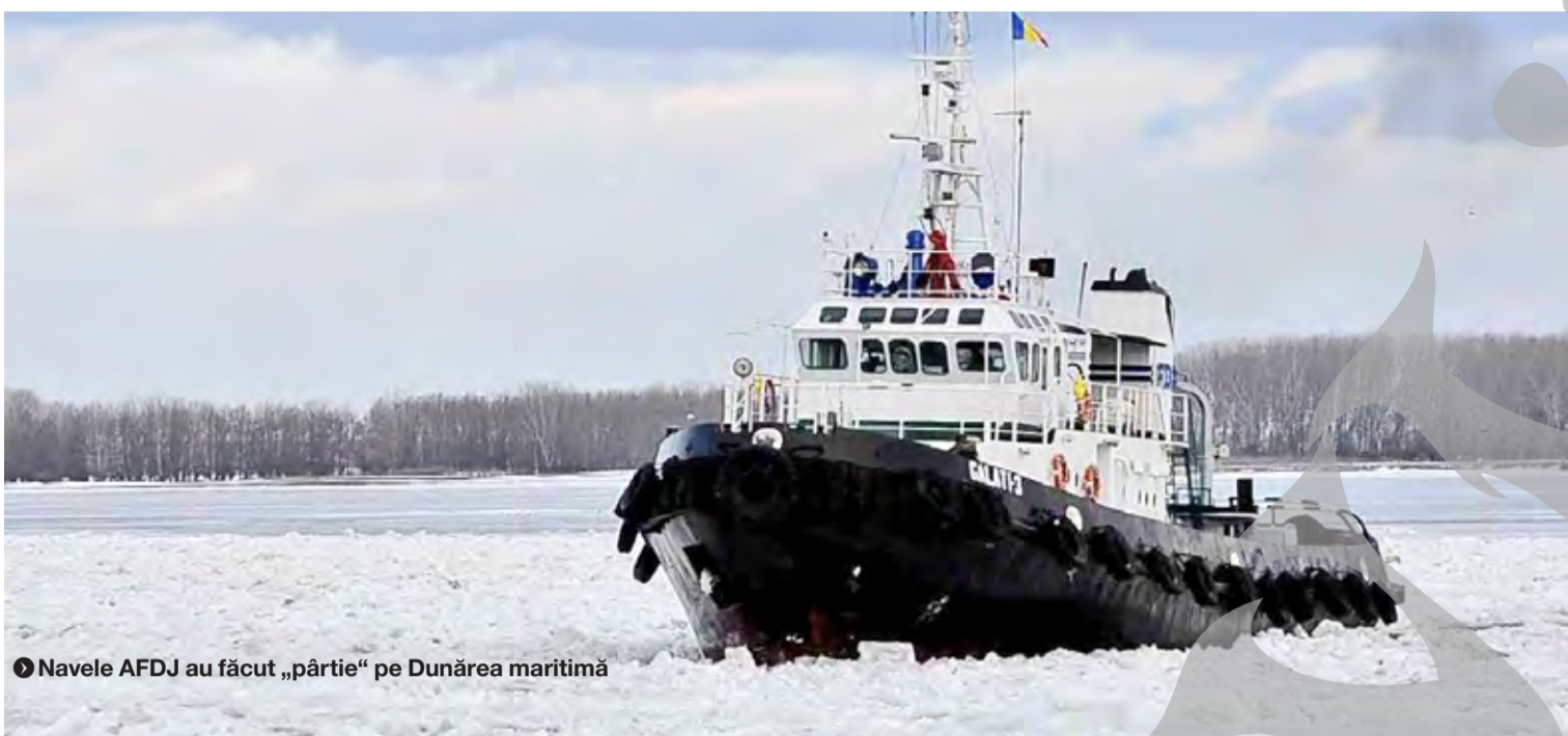
► Navele AFDJ au făcut „pârtie“ pe Dunărea maritimă

NAVIGAȚIA FLUVIALĂ PE DUNĂRE, DEBLOCATĂ ● SLOIURI