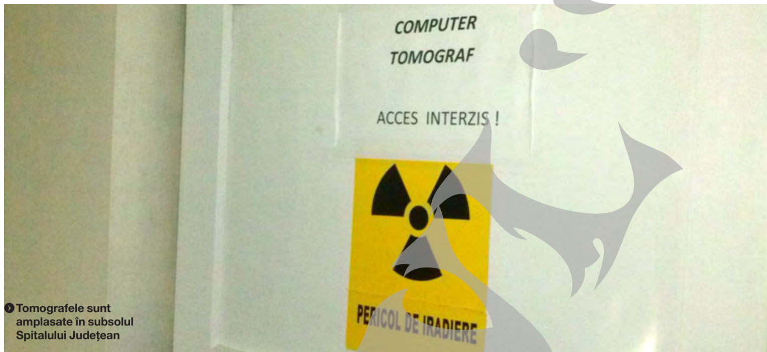
► Tomografele sunt amplasate în subsolul Spitalului Județean

în curtea Bisericii „Sf. Spiridon“, au adresat injurii, expresii jignitoare și amenințări cu acte de violență la adresa cetățenilor veniți la un priveghi. Cei în cauză au primit amenzi în valoare totală de 700 de lei. ● T. M.