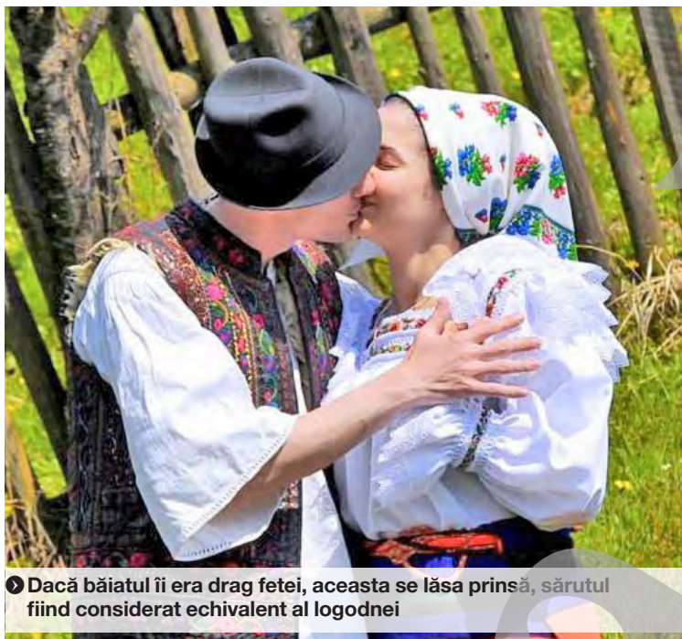
► Dacă băiatul îi era drag fetei, aceasta se lăsa prinsă, sărutul fiind considerat echivalent al logodnei

În vremuri de demult, în această zi de mare sărbătoare, tinerii îmbrăcați în straie frumoase obișnuiau să se strângă în păduri