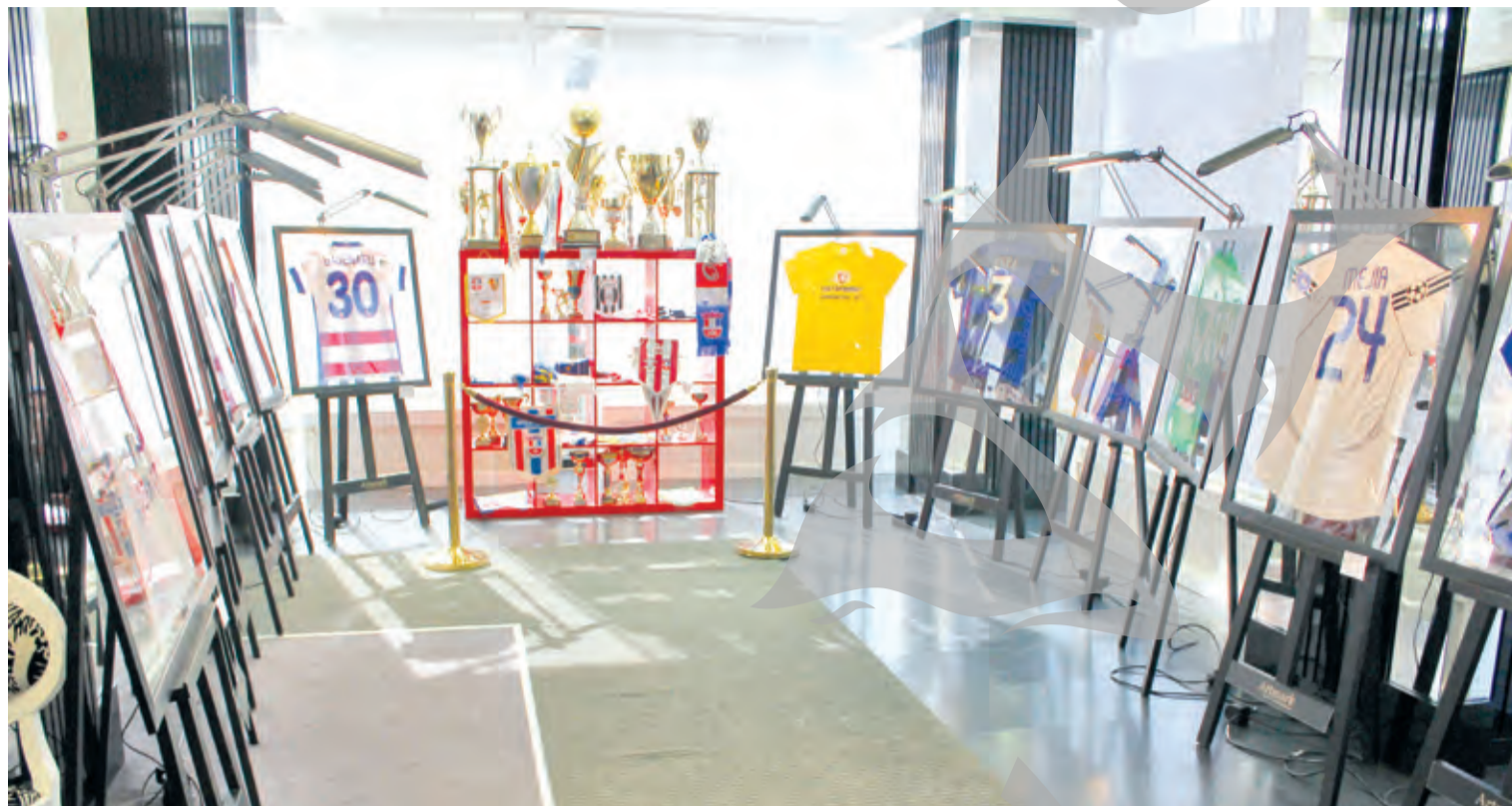
● Expoziția este deschisă la Hotelul „Galați”, până duminică