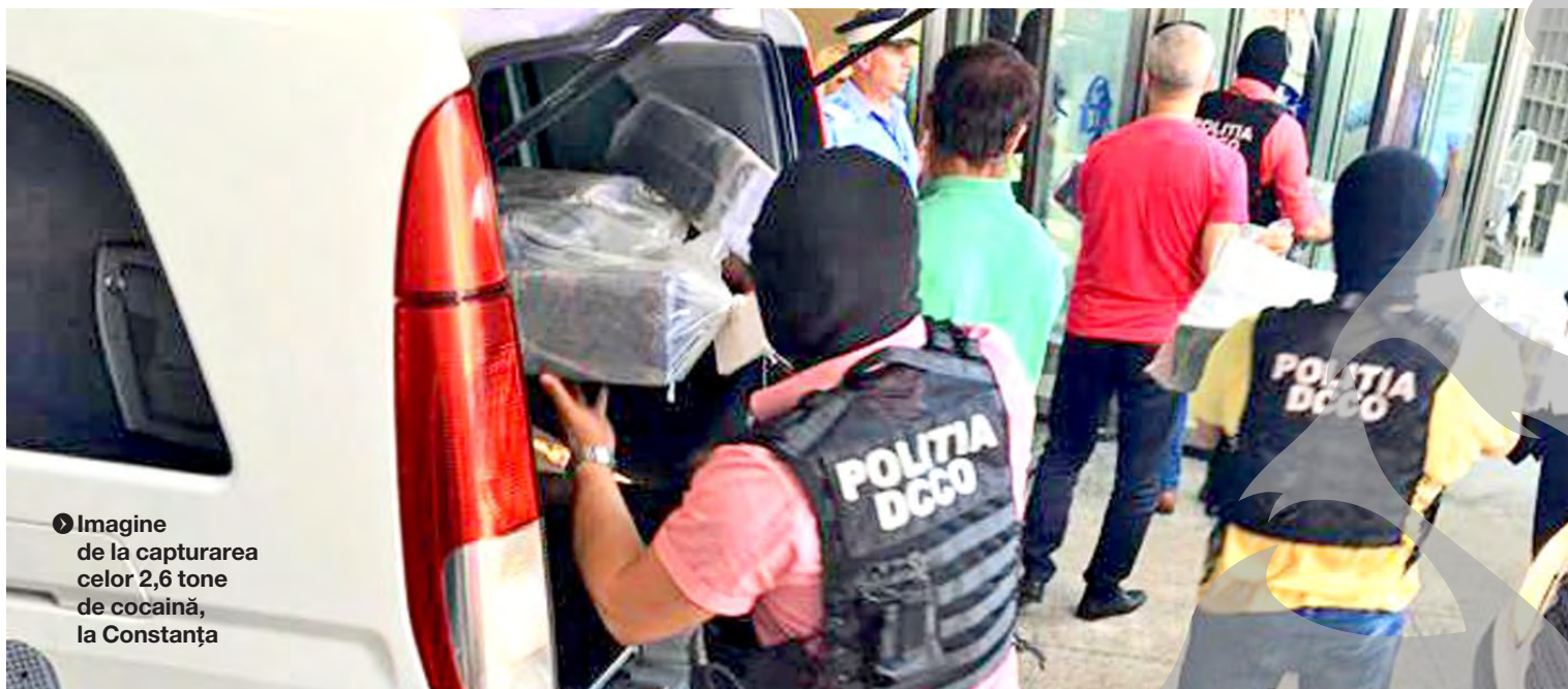
► Imagine de la capturarea celor 2,6 tone de cocaină, la Constanța

DE LA CANABIS, LA PASTILUȚE ȘI COCAINĂ ● STUPEFIANTE