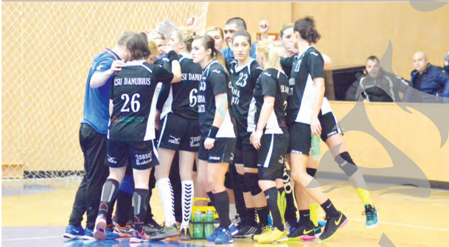
● Echipa CSU Danubius, pregătită pentru derbiul Dunării de Jos.

WEEKEND CU PROGRAM FĂRĂ PRECEDENT ● MECIURI