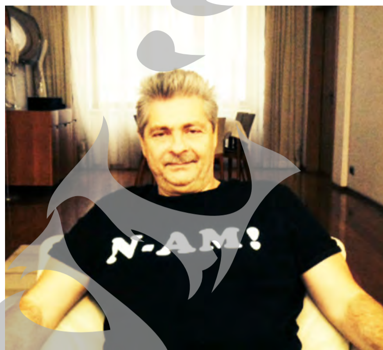
● Sorin Ovidiu Vintu