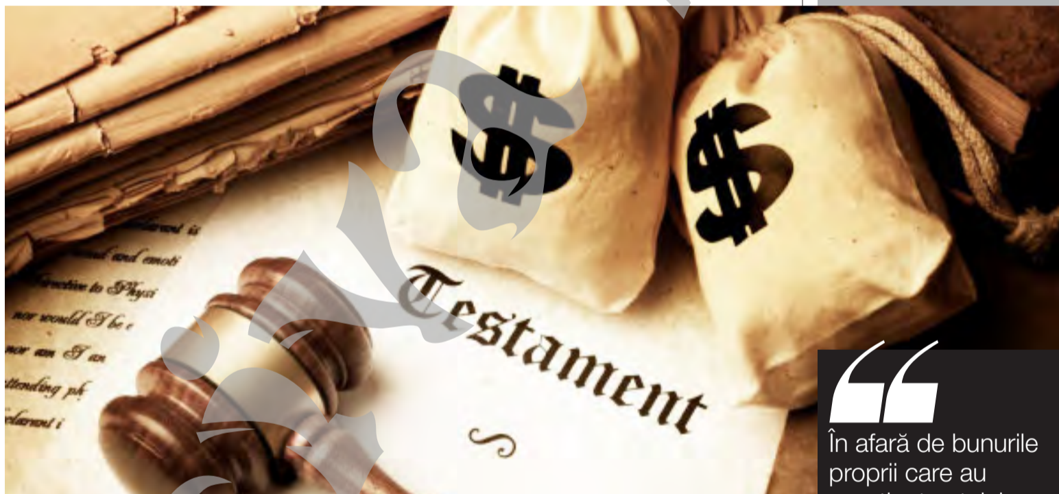
▶ Soțul supraviețuitor nu face parte din nicio clasă de moștenitori legali

Concubinul nu are drepturi succesoriale asupra moștenirii defunctului, indiferent de durata relației pe care a avut-o cu acesta, legiuitorul neacordându-i același statut ca și soțului supraviețuitor. ●