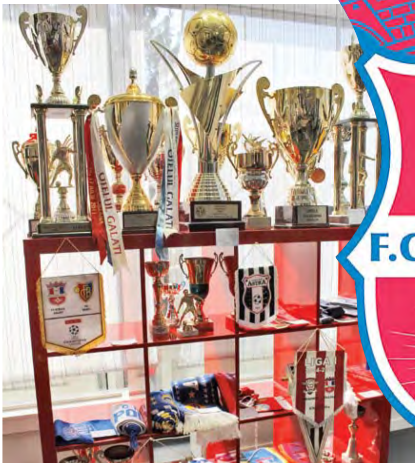
▶ Trofee FC Oțelul scoase la licitație