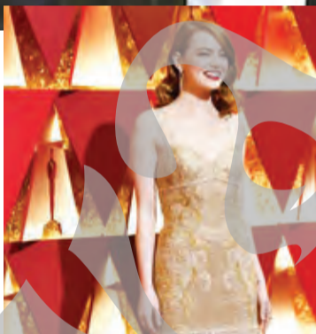
▶ Emma Stone, cea mai bună actriță în rol principal

Începutul ceremoniei de decernare a Premiilor Oscar a stat sub semnul protestelor anti-Trump, îmbrățișate de întreaga suflare cinematografică. De la fundițele roșii și