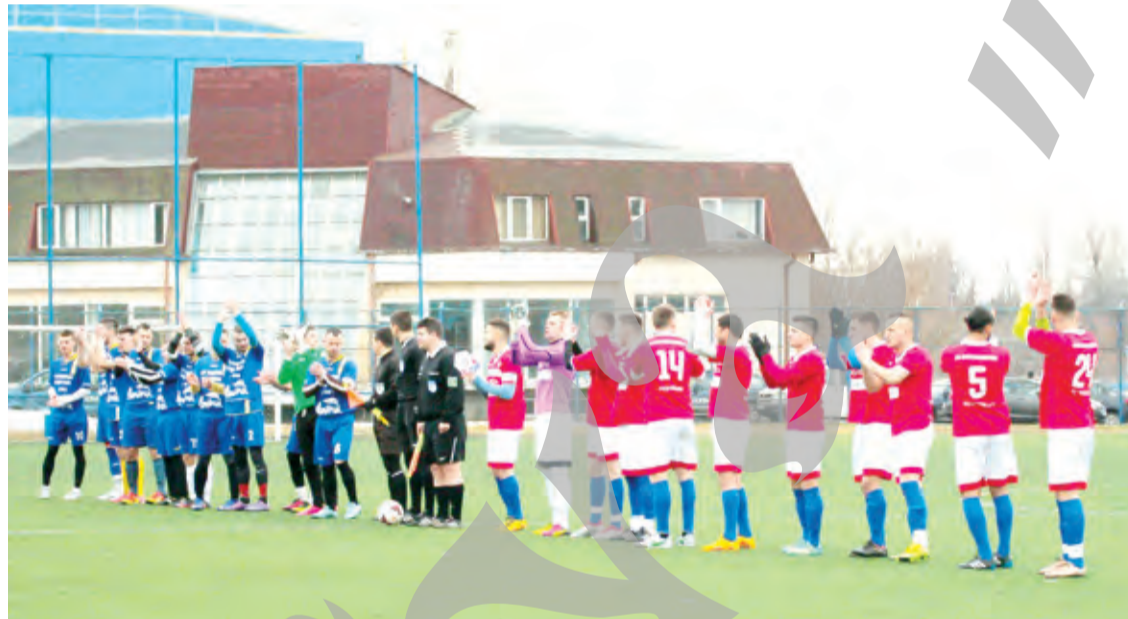
● „Oțelarii” aplaudându-și suporterii