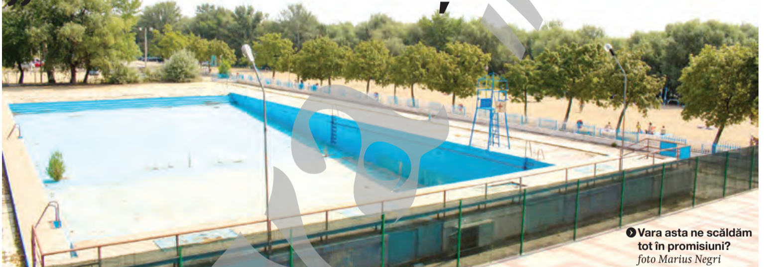
► Vara asta ne scăldăm tot în promisiuni?