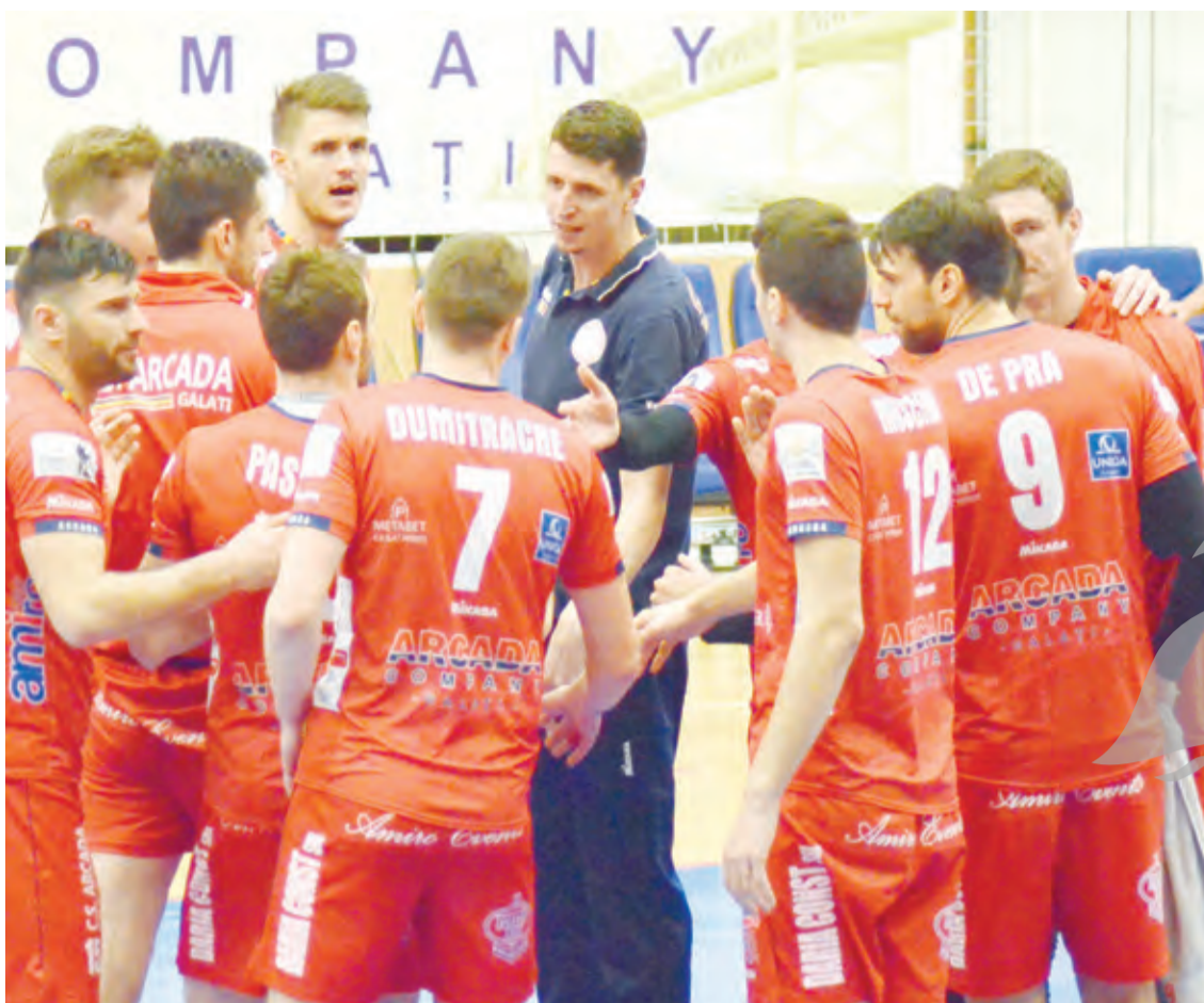
● Voleibaliștii de la Arcada, încrezători în forța de grup foto Sonia Baciu