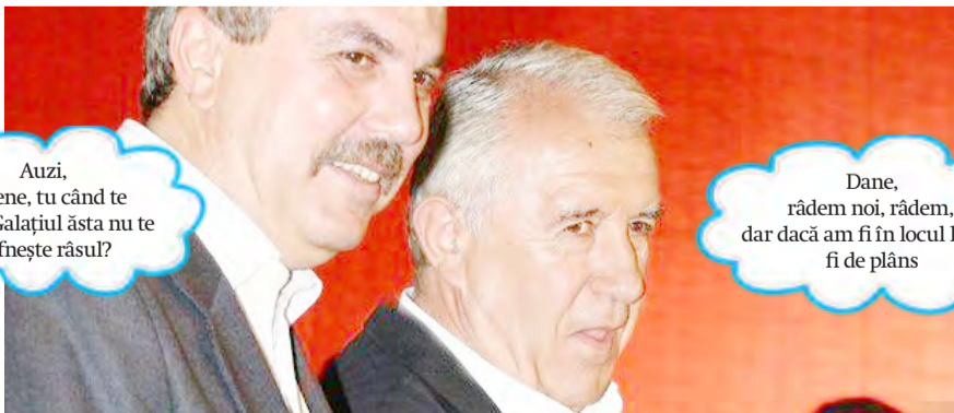
► E chiar atât de greu de ghicit ce ne așteaptă?

Auzi, Eugene, tu când te uiți la Galațiul ăsta nu te bufnește râsul?