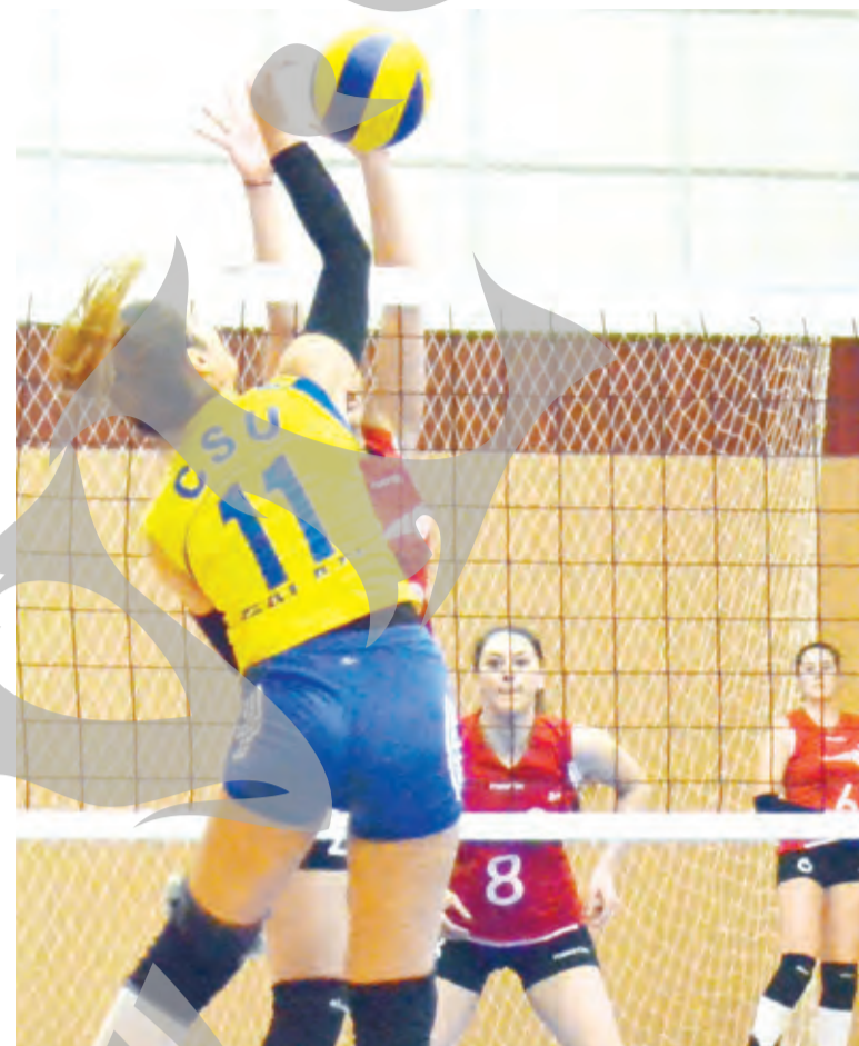
● Acțiune din meciul cu Penicilina, din returul Diviziei A1