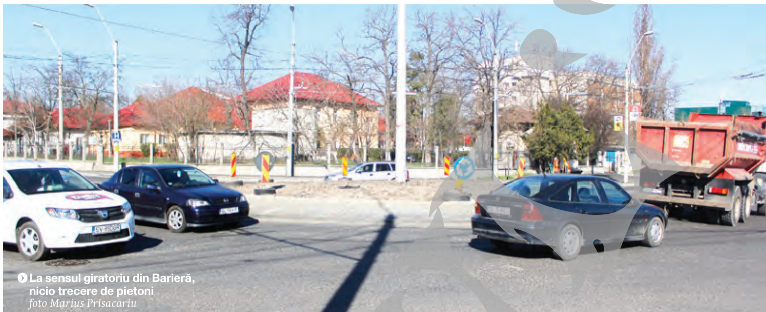
► La sensul giratoriu din Barieră, nicio trecere de pietoni