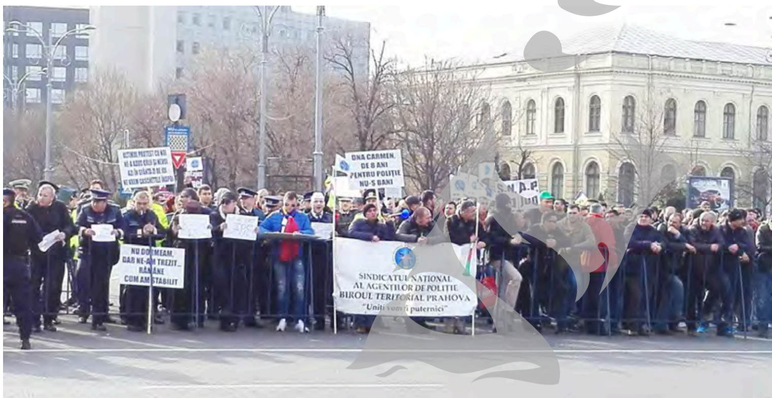
● Zeci de polițiști din toată țara au protestat la București

pe locul al patrulea în top. Publicația franceză, citată de news.ro, susține că aceste personalități și-au demonstrat poziția pro-europeană, iar Kovesi este catalogată drept o eroină a protestelor antiguvernamentale care au avut loc în România. ● T.M.