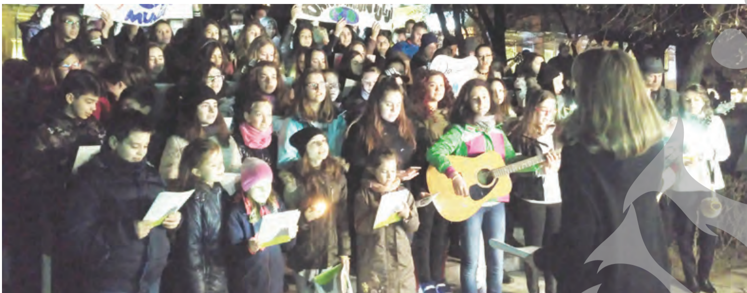
● Copiii Galațiului au făcut spectacol în Parcul Eminescu

N-A FOST MADRIGALUL, CI COPIII GALAȚIULUI ● CONCERT