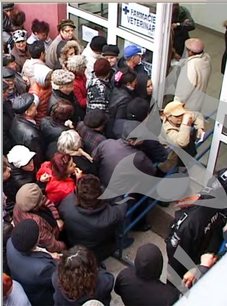
► Mii de gălățeni au beneficiat de alimente de la UE