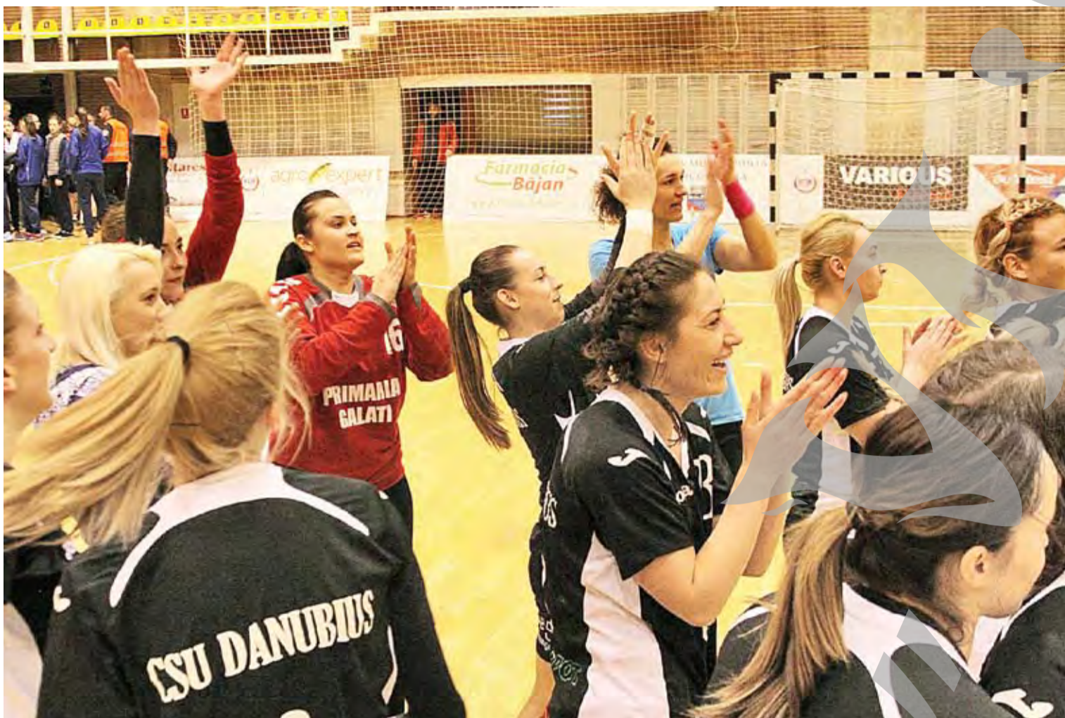
● Echipa gălățeană, răspunzând, la finalul meciului, aplauzelor publicului vâlcean

VICTORIE URIAȘĂ PENTRU IEȘIREA DE PE LOCUL DE BARAJ ● HANDBAL