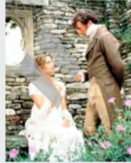
Marea Britanie, Dramă