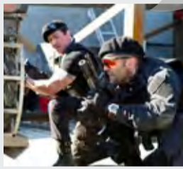
SUA, Acțiune, Aventuri, Thriller

10:30 Vorbește lumea 13:00 Știrile Pro Tv 14:00 Lecții de viață 15:00 La Maruță 17:00 Știrile Pro Tv 18:00 Ce spun românii 19:00 Știrile Pro Tv 20:30 Eroi de sacrificiu 2