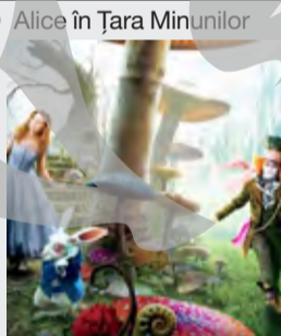
Aventuri, SUA, 2010

06:00 Alice în Țara Minunilor 07:50 Cu cele mai bune intenții 09:35 Kung Fu Panda 3 11:10 Muppet - Colindă de Crăciun 12:35 Departe de lumea dezlănțuită 14:35 Cartea Junglei 16:20 Bernard și Doris 18:00 Mamă, ce zil! 20:00 Umbre - Ep. 2 20:45 Avatar 23:25 Igitimor 01:00 Transporter: Moștenirea 02:35 Detașare 04:30 Atac de Ziua Națională