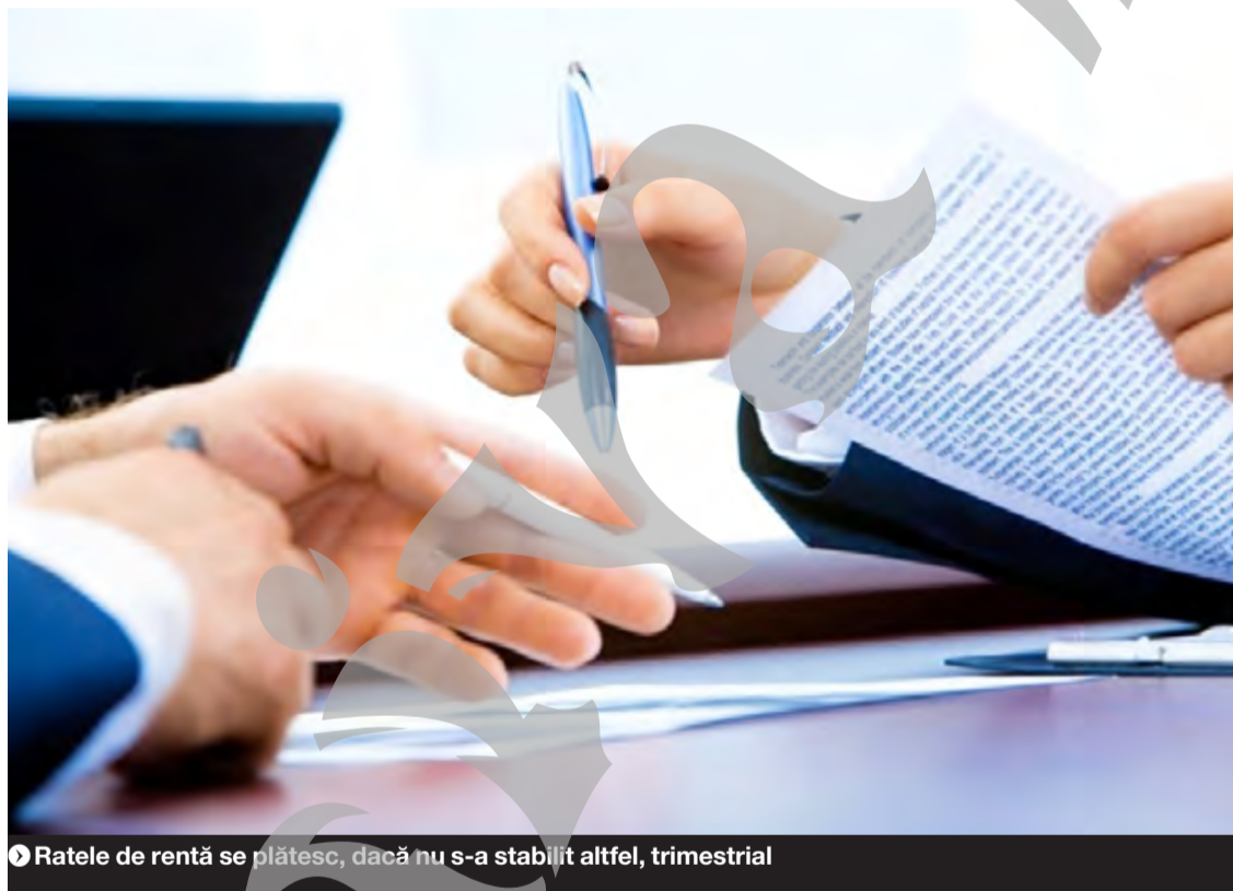
▶ Ratele de rentă se plătesc, dacă nu s-a stabilit altfel, trimestrial

Este lovit de nulitate absolută contractul care stabilește o rentă pe durata vieții unui terț care era decedat la data încheierii contractului. Aceeași sancțiune se aplică contractului care constituie cu titlu oneros o rentă pe durata vieții unei persoane care, la data încheierii contractului, suferea de o boală din cauza căreia a murit în interval de cel mult 30 de zile de la această dată.