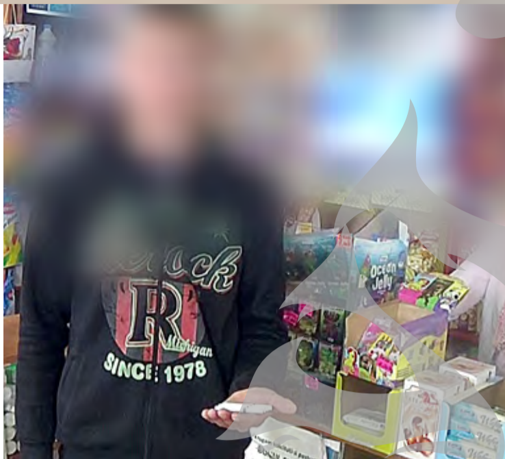
► Vanzarea țigărilor către minori este ilegală

„Trebuie precizat că persoanele juridice care încalcă Legea 349/2002 – actualizată, riscă sancțiuni, după cum urmează: 5.000 de lei la prima abatere, amendă contravențională de 10.000 de lei și cu sancțiunea complementară de suspendare a activității până la remedierea situației care a dus la suspendarea activității la a doua abatere, iar săvârșirea unei noi contravenții se sancționează cu amendă contravențională de 15.000 de lei, plus sancțiunea