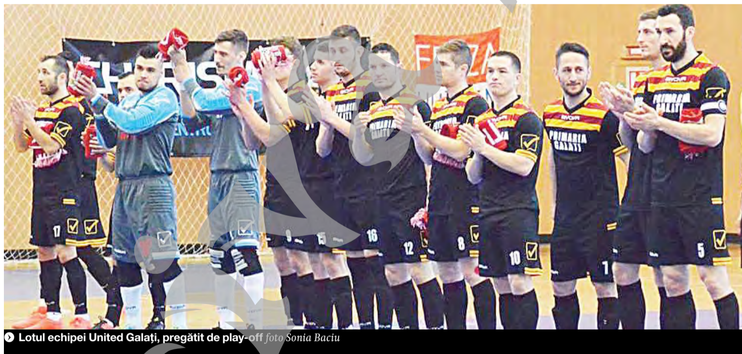
▶ Lotul echipei United Galați, pregătit de play-off