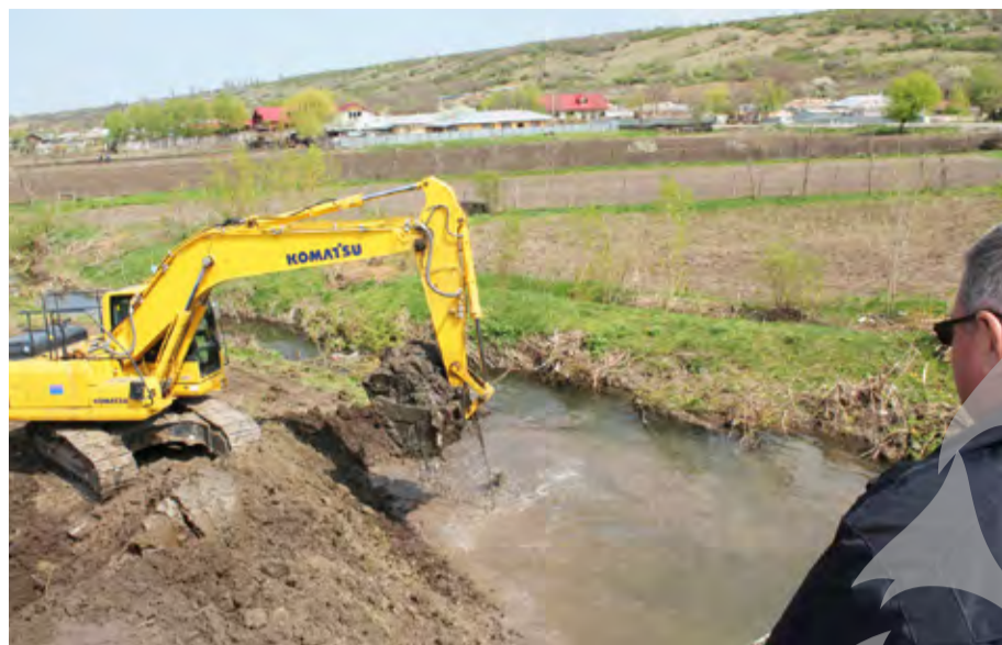
● Primarul Emil Dragomir, supervizând stadiul lucrărilor de decolmatare