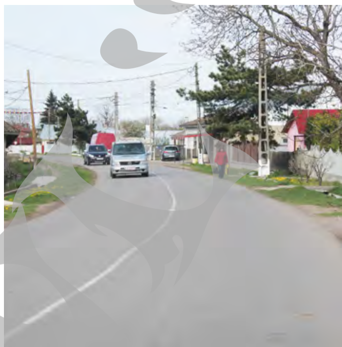
● Rețeaua de drumuri din satul Corod trebuie finalizată

LA MANDAT NOU, PROIECTE NOI ● INVESTIȚII