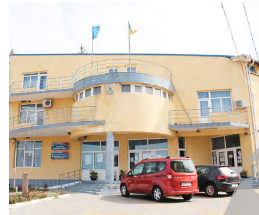
● Primăria din Corod