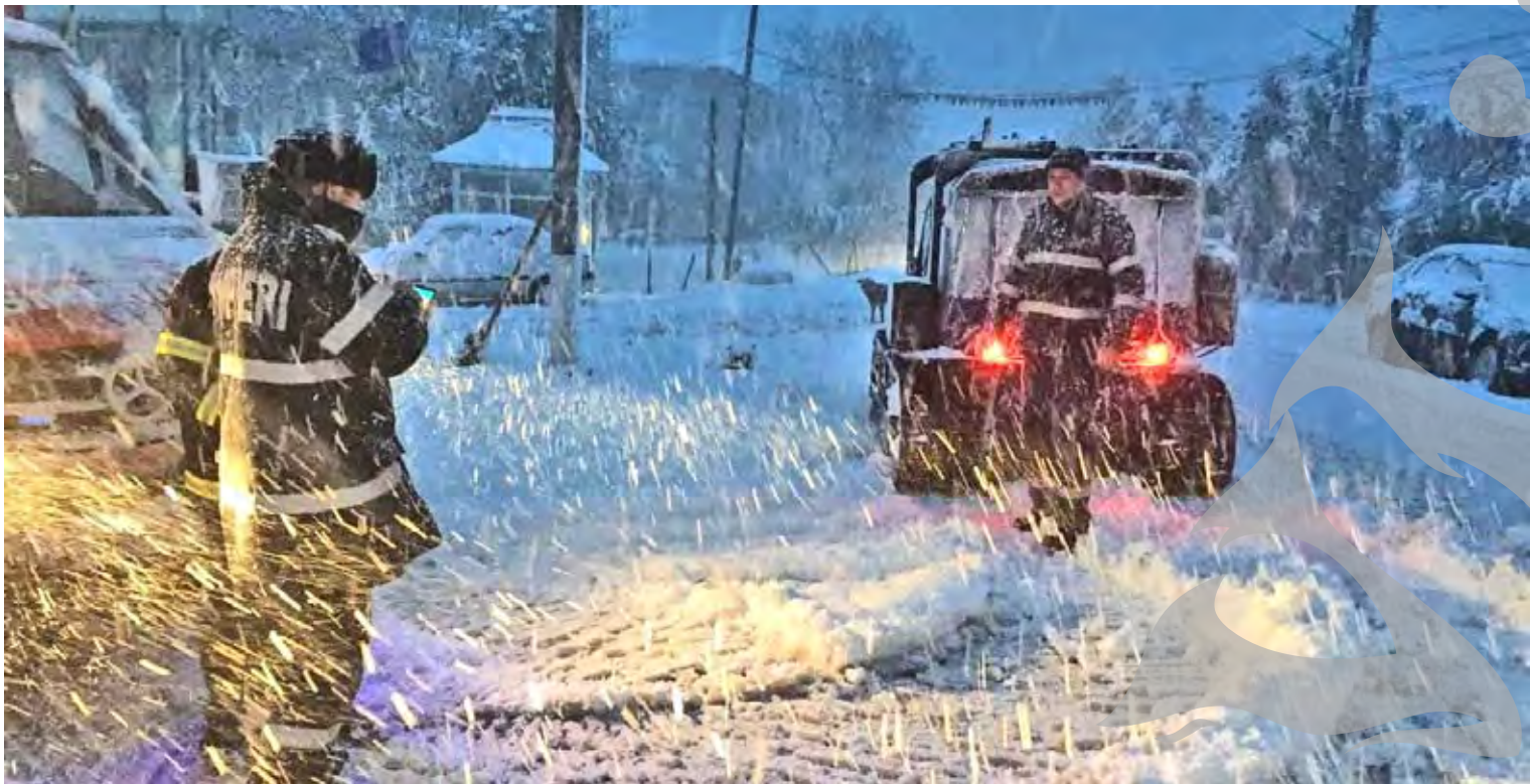
● A fost nevoie de intervenția șenilatei pentru mai multe cazuri medicale din județ