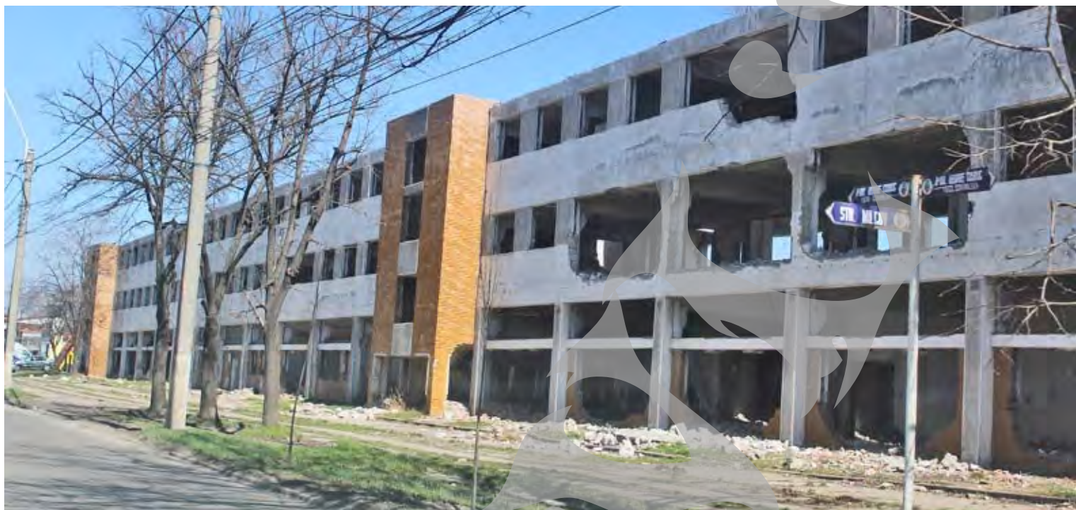
● Patrimoniul Mehid este grevat de sarcini ce depășesc 10 milioane de euro