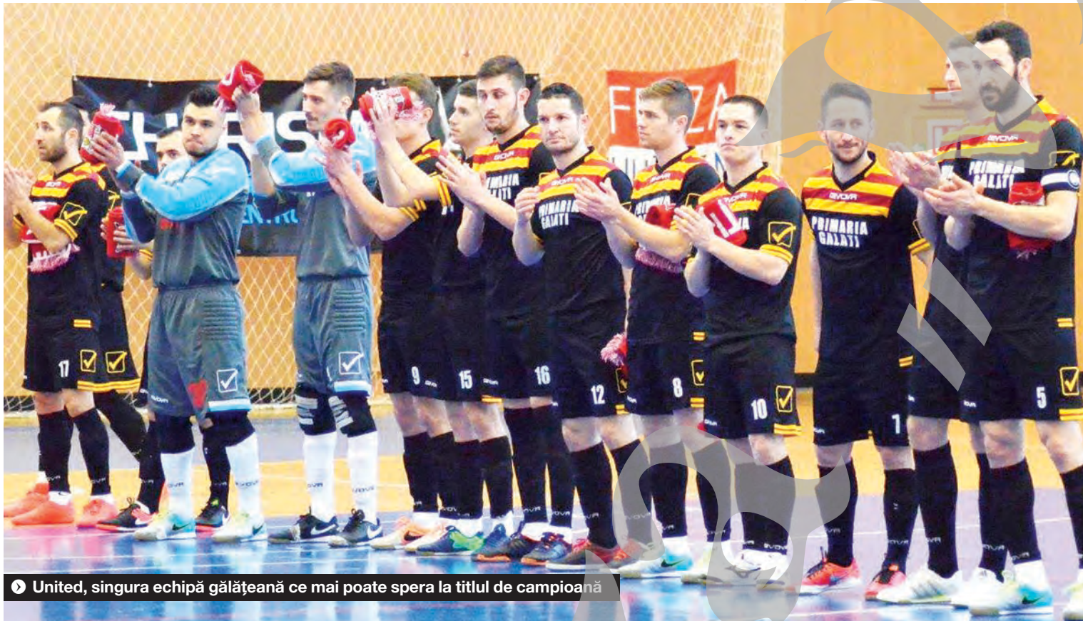
United, singura echipă gălățeană ce mai poate spera la titlul de campioană