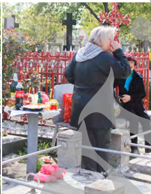
Slujba de pomenire s-a făcut și printre morminte

PRINTRE COZONACI, OUĂ ȘI STICLE DE BĂUTURĂ ● SĂRBĂTOARE