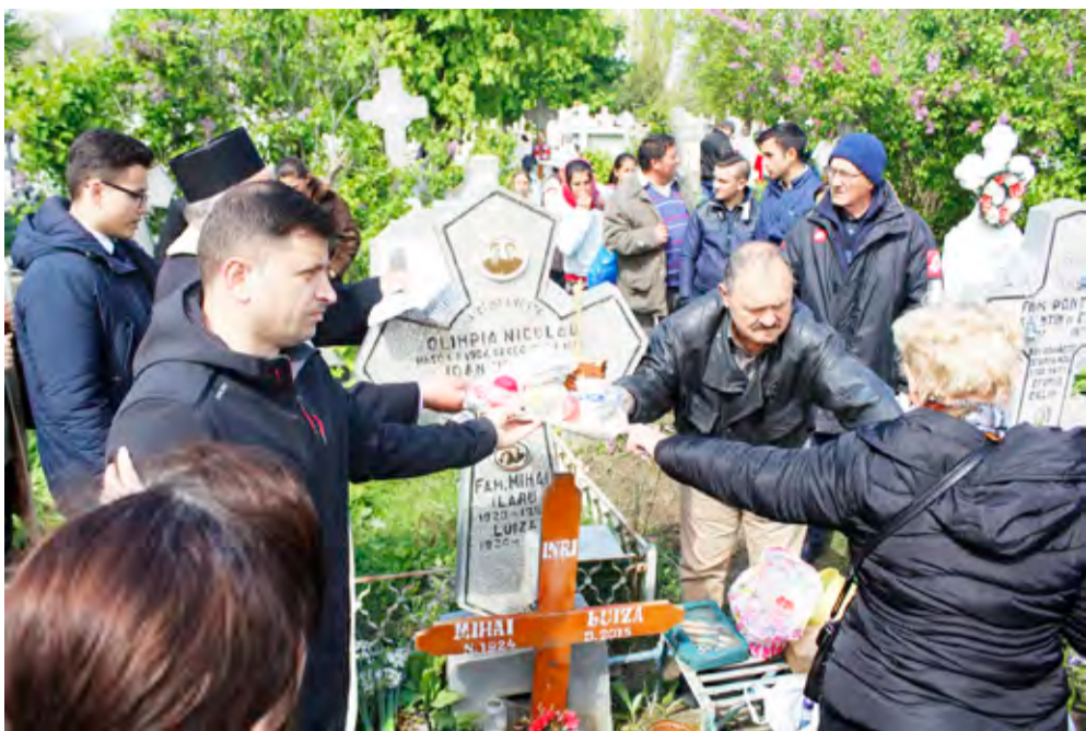
Paștele Blajinilor, o tradiție în Galați