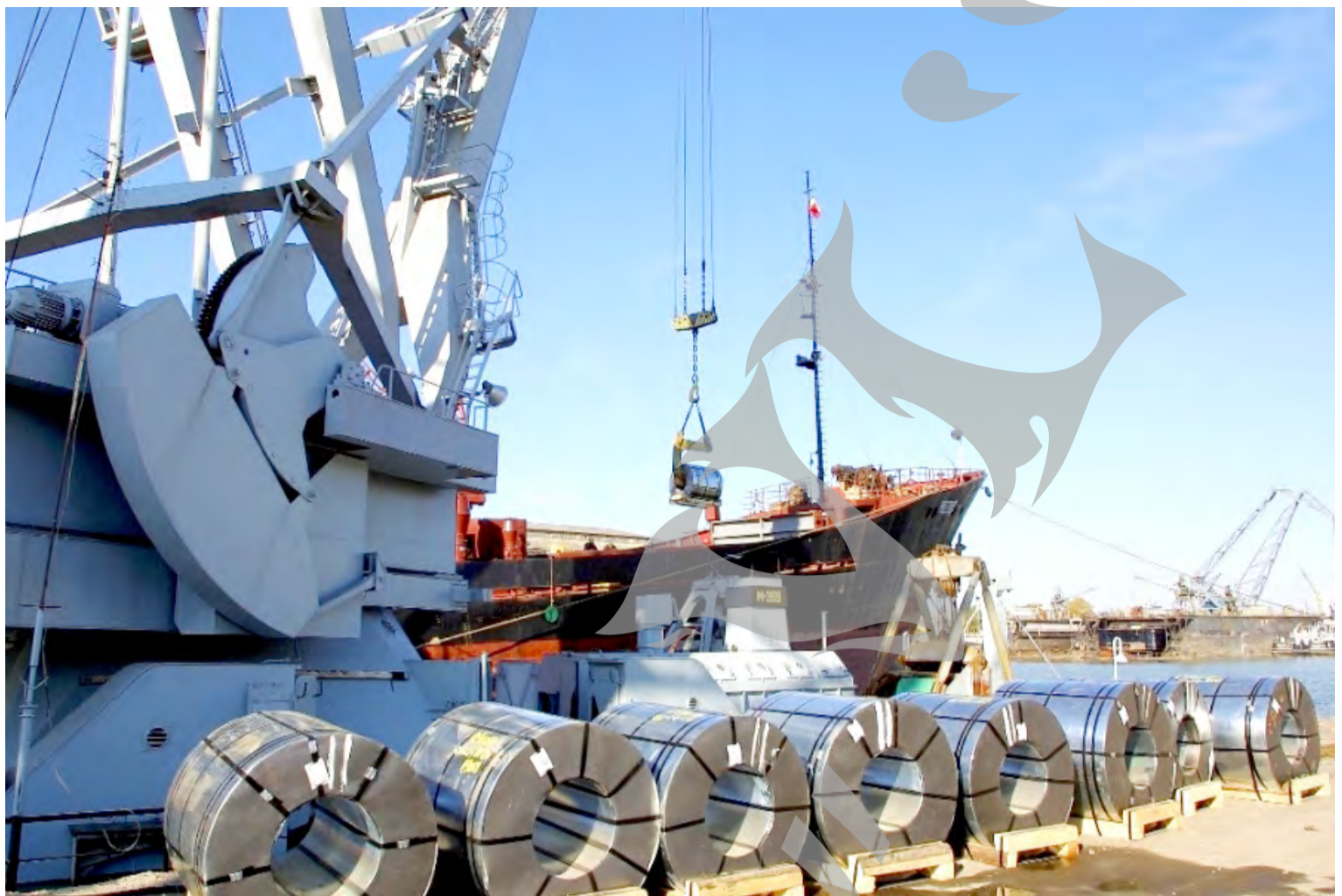
● În 2017, Zona Liberă Galați estimează venituri totale de 3,335 milioane lei

FORMULAR. Formularul 120 („Decont privind accizele“) pentru anul 2016 trebuie completat și depus până la data 2 mai 2017, informează Direcția Generală Regională a Finanțelor Publice Galați. Decontul privind accizele se completează cu ajutorul programului de asistență care poate fi descărcat de pe site-ul ANAF, www.anaf.ro , la secțiunea Servicii online → Declarații electronice → Descărcare declarații. Formularul se depune la organul fiscal competent, în format PDF, cu fișier XML atașat, pe suport CD, însoțit de formatul hârtie, semnat conform legii, sau se transmite prin mijloace electronice de transmitere la distanță, în conformitate cu prevederile legale în vigoare, accesând adresa de internet www.e-guvernare.ro - Depunere declarații. Informații privind depunerea on-line a declarațiilor fiscale de către persoanele juridice se găsesc pe site-ul www.anaf.ro , la secțiunea Servicii online → Declarații electronice → Informații depunere declarații persoane juridice. Informații detaliate se pot obține de la structurile pentru asistența contribuabililor din cadrul organelor fiscale; telefonic, la Centrul de asistență a contribuabililor, la numărul 031.403.91.60; accesând site-ul ANAF. ● C.L.