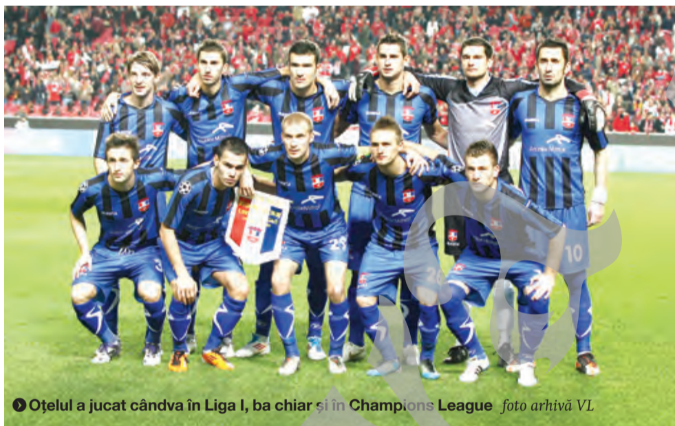
● Oțelul a jucat cândva în Liga I, ba chiar și în Champions League