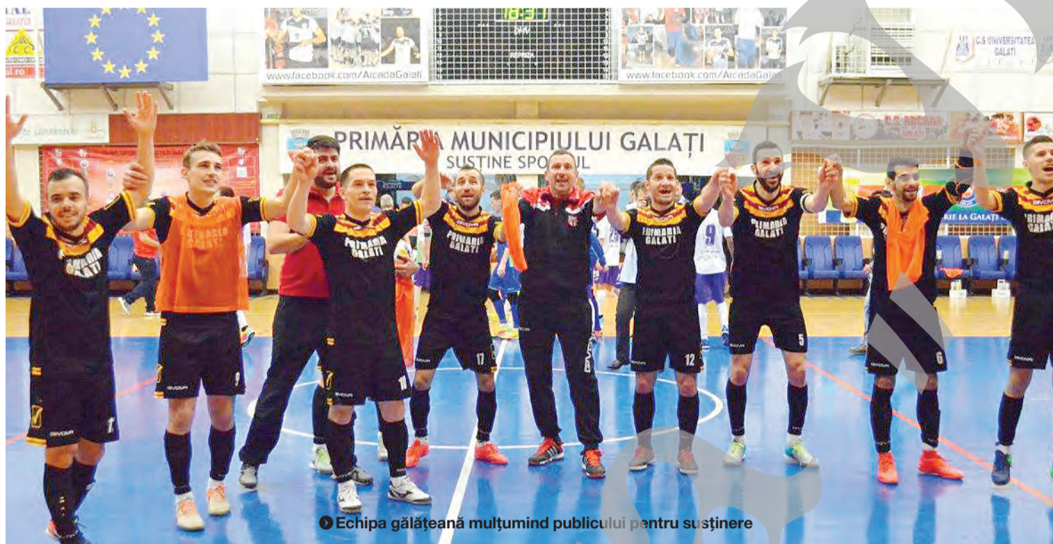
● Echipa gălățeană mulțumind publicului pentru susținere

GHEORGHE ARSENIE gheorghe@viata-libera.ro