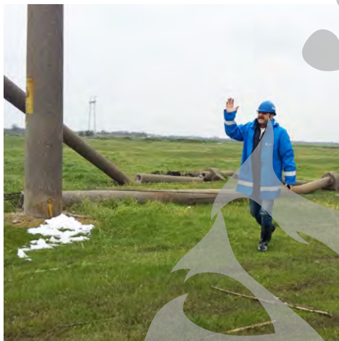
● Conducerea Electrica speră ca până mâine să rezolve toate problemele

ZECI DE MII DE OAMENI, FĂRĂ ENERGIE ELECTRICĂ DE PATRU ZILE ● INTERVENȚII