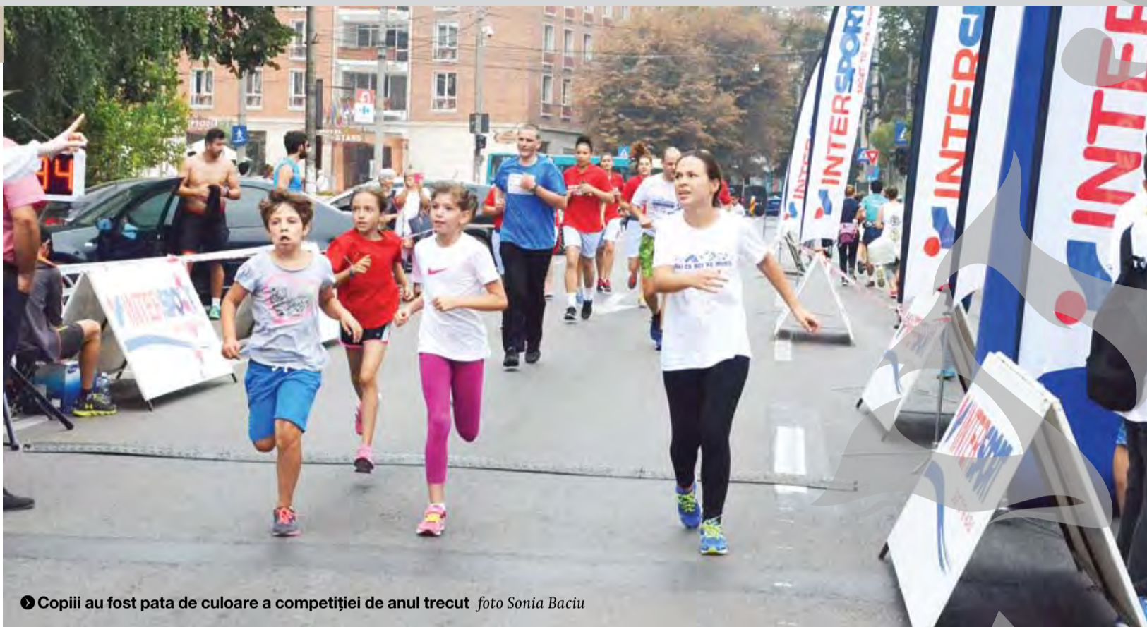
● Copiii au fost pata de culoare a competiției de anul trecut