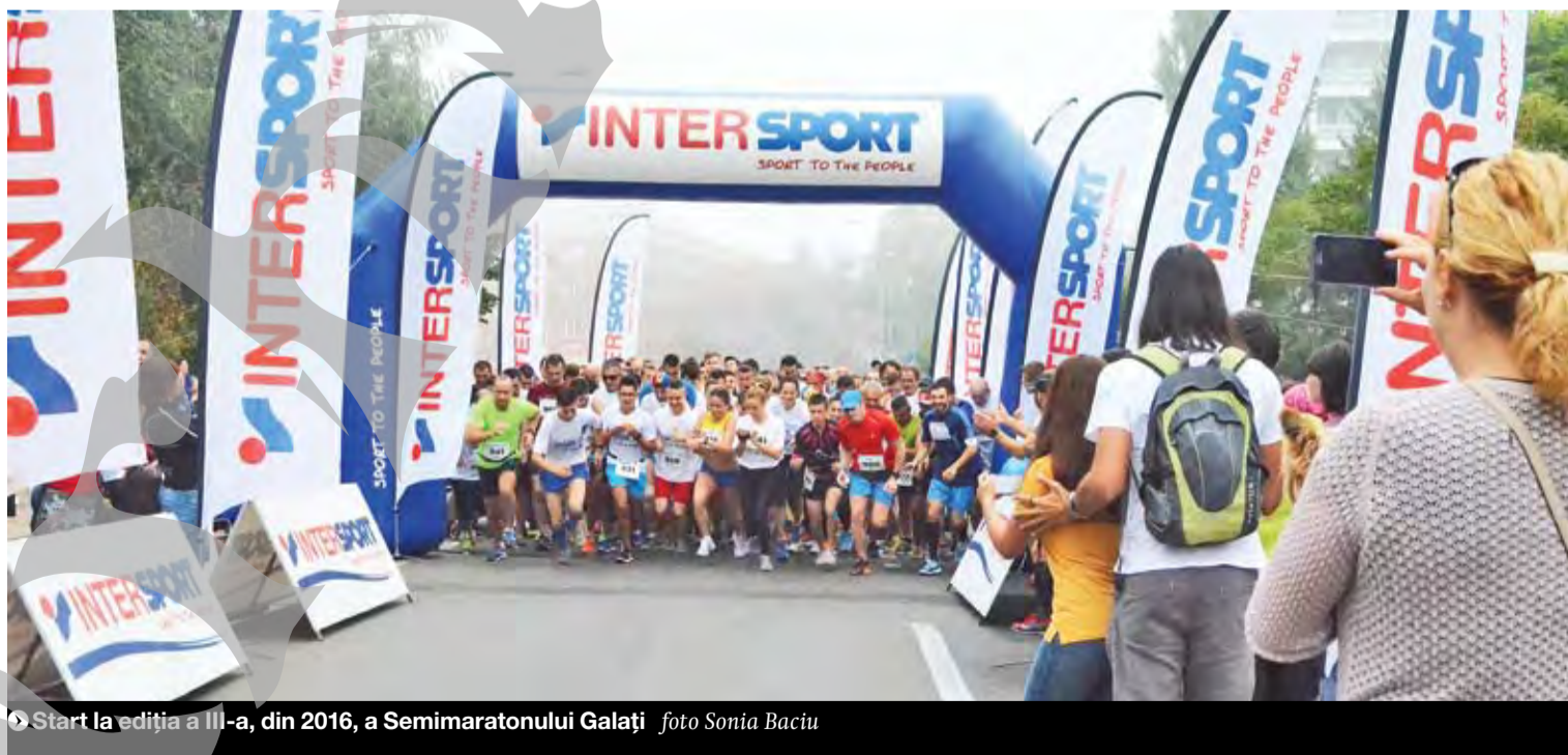
▶ Start la ediția a III-a, din 2016, a Semimaratonului Galați foto Sonia Baciu

RECUPERARE. Echipa „Motivation” își propune ca prin participarea la Semimaratonul Galați 2017 să strângă o parte din fondurile necesare participării a trei persoane cu leziuni medulare la o sesiune de recuperare activă la Centrul de instruire Motivation de la Buda, județul Ilfov. Programul de recuperare constă în instruire pentru viața independentă, kinetoterapie și consiliere. Acest modul se adresează persoanelor care au rămas recent imobilizate și nu au avut ocazia să afle cum pot trăi independent după accidentele pe care le-au avut. Diferența dintre suma strânsă din donații și costul activității este acoperită de Fundația „Motivation”, din surse proprii. Centrul de recuperare al Fundației „Inimă de Copil” oferă, pentru copiii cu întâzieri în dezvoltare sau dizabilități, evaluări realizate de echipa pluridisciplinară de specialiști și ulterior ședințe de recuperare conform unor programe individualizate de intervenție. Atingerea sumei propuse pentru acest an pentru semimaraton va permite fundației să susțină 100 de ore de servicii gratuite pentru copii cu dizabilități. ● I.S.