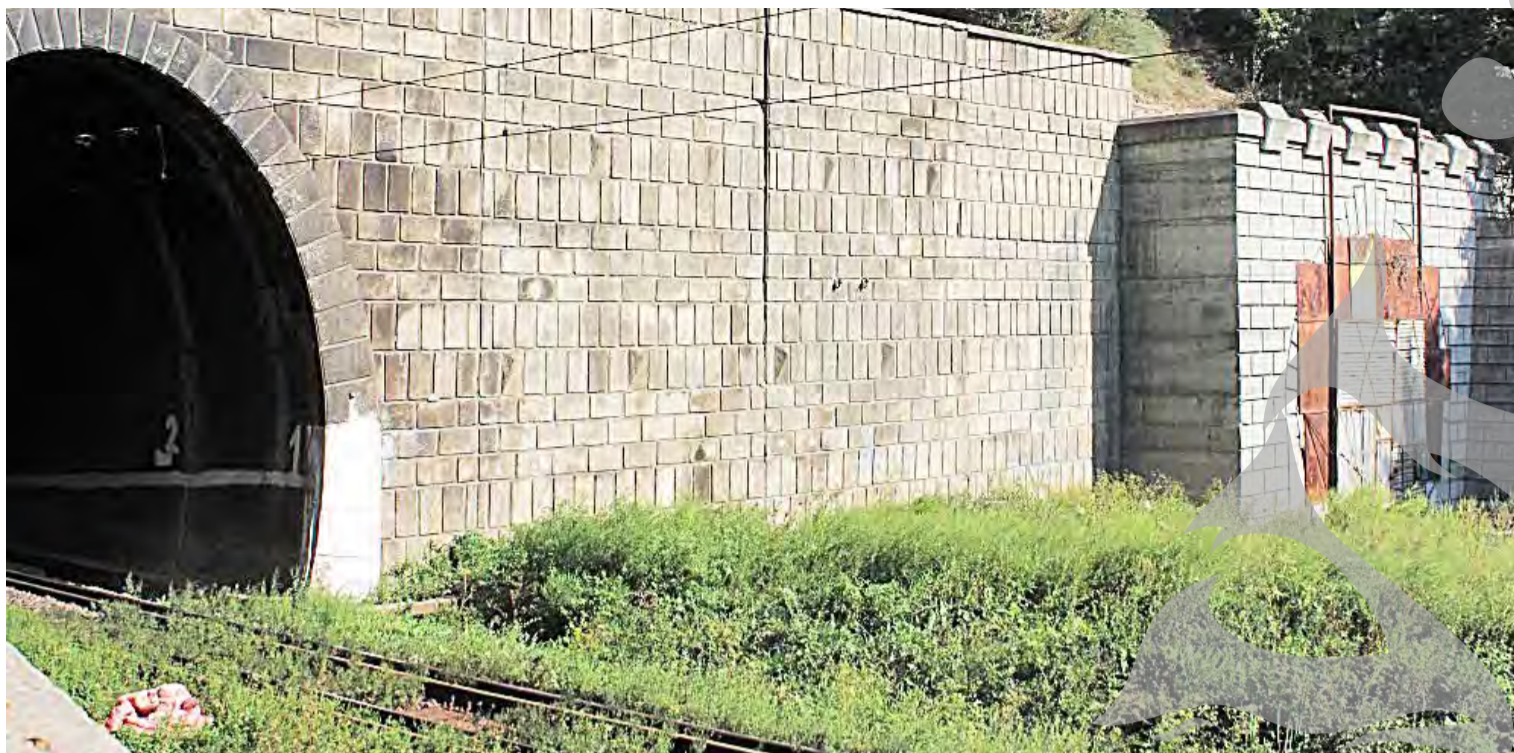
● Așa arăta tunelul de la Filești acum doi ani

LUCRĂRI CARE DUREAZĂ DE 21 DE ANI ● TERMEN