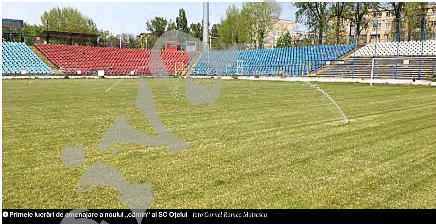
● Primele lucrări de amenajare a noului „cămin” al SC Oțelul