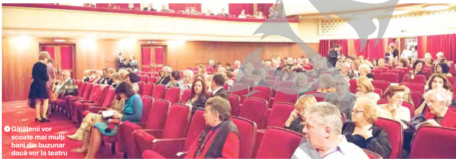
➤ Gălățenii vor scoate mai mulți bani din buzunar dacă vor la teatru

www.viata-libera.ro Viata pe scurt 24 ORE SERVAT