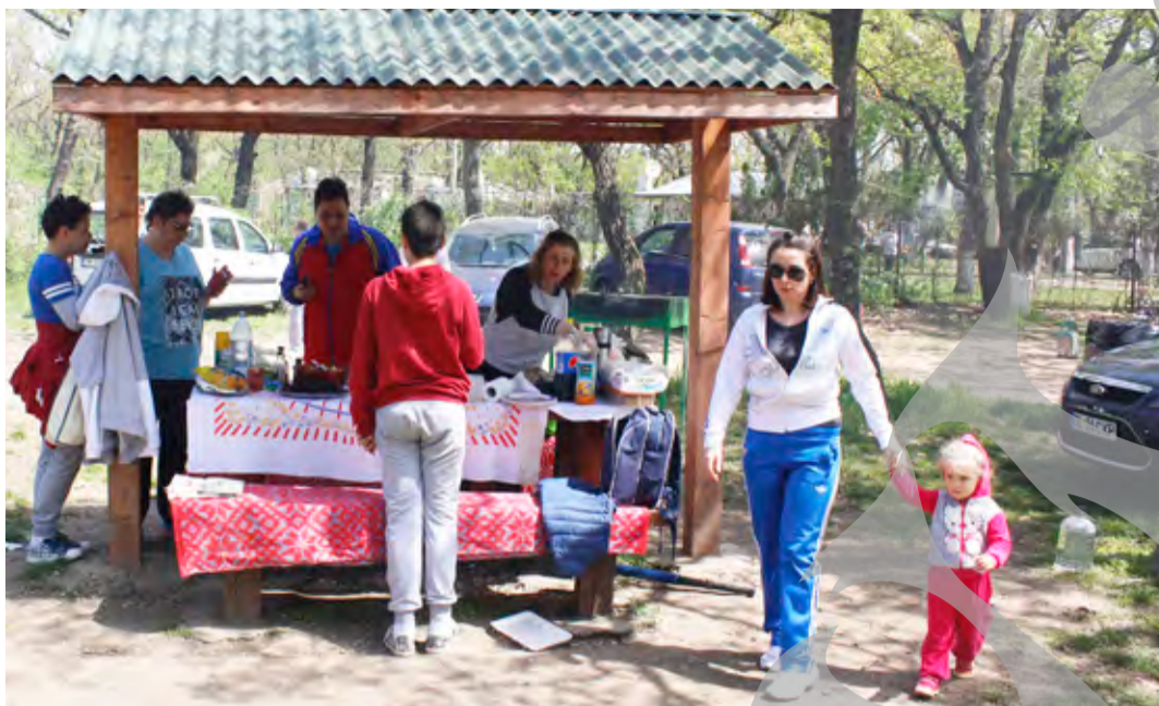
● Bucate alese și-au găsit loc pe grătarele încinse

1 MAI, ÎN PĂDUREA GÂRBOAVELE ● DISTRAȚIE