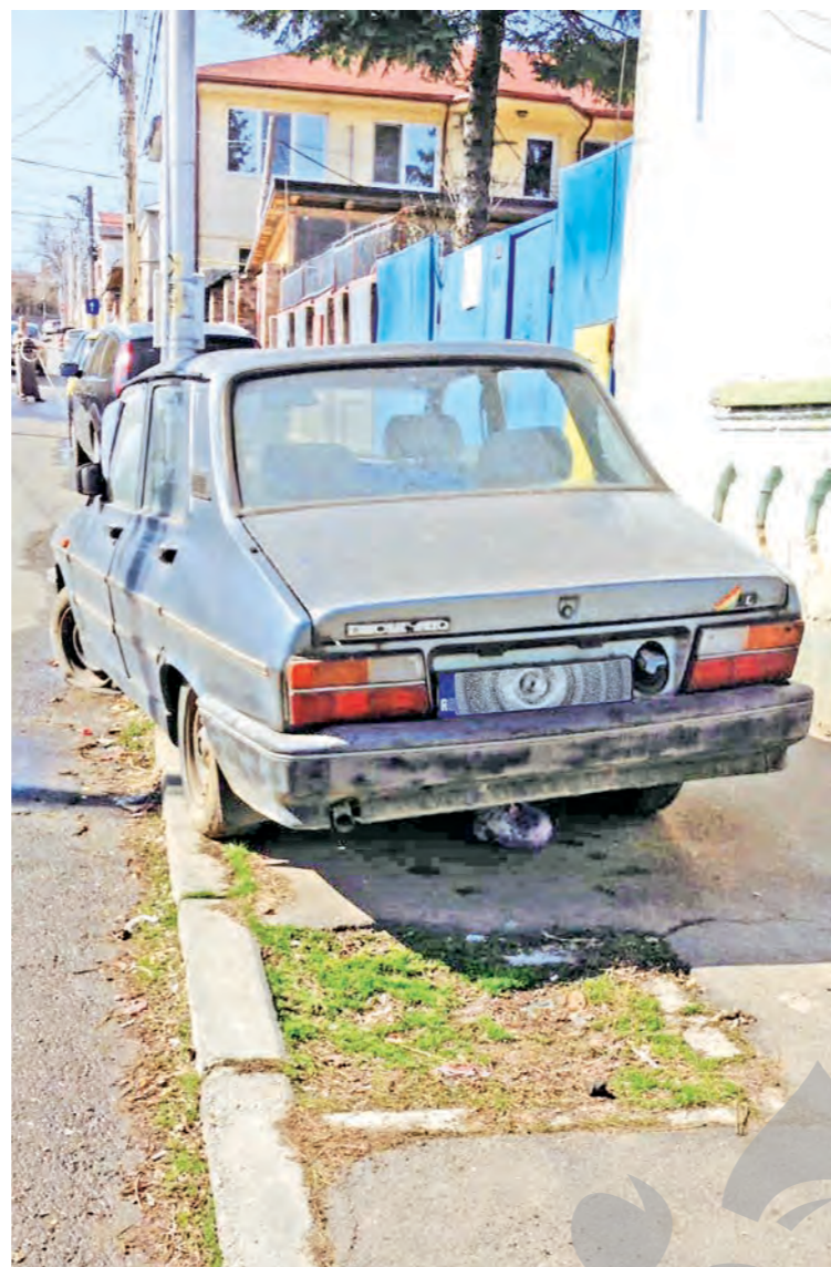
CT 87 ASM sau automobilul Tico cu numărul AG 83ASD. Campania noastră continuă și așteptăm mesajeledumneavoastră, însoțite de fotografii, pe adresa redactie@viata-libera.ro

Discutăm despre mașini abandonate de ani de zile, cum ar fi autoturismul Dacia cu numărul