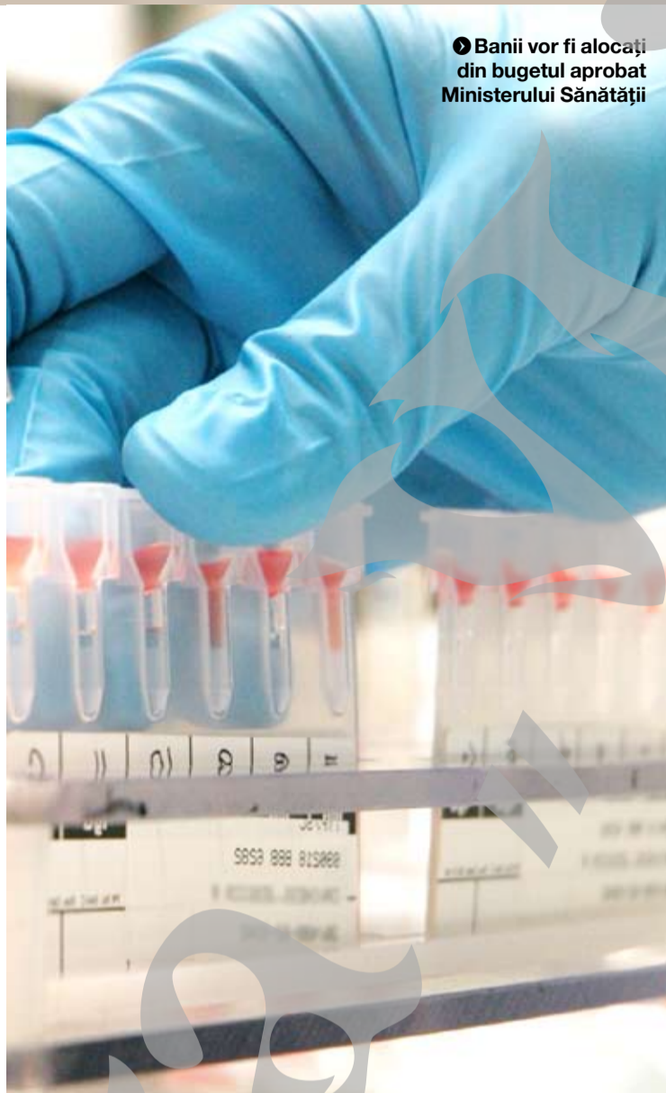
● Bani vor fi alocați din bugetul aprobat Ministerului Sănătății

"Proiectul va asigura o creștere a calității asistenței medicale de specialitate, prin soluții terapeutice moderne, pentru îmbunătățirea stării de sănătate a populației,