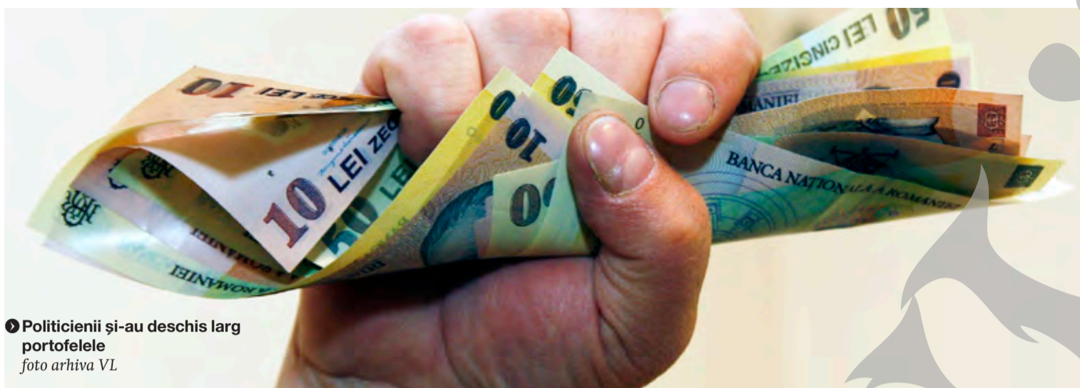
● Politicienii și-au deschis larg portofelele