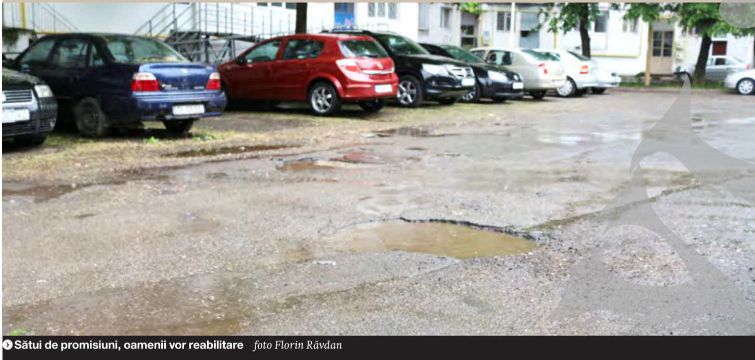
Sătui de promisiuni, oamenii vor reabilitare

REABILITĂRI DOAR DE "OCHII SOACREI"? ● SESIZĂRI