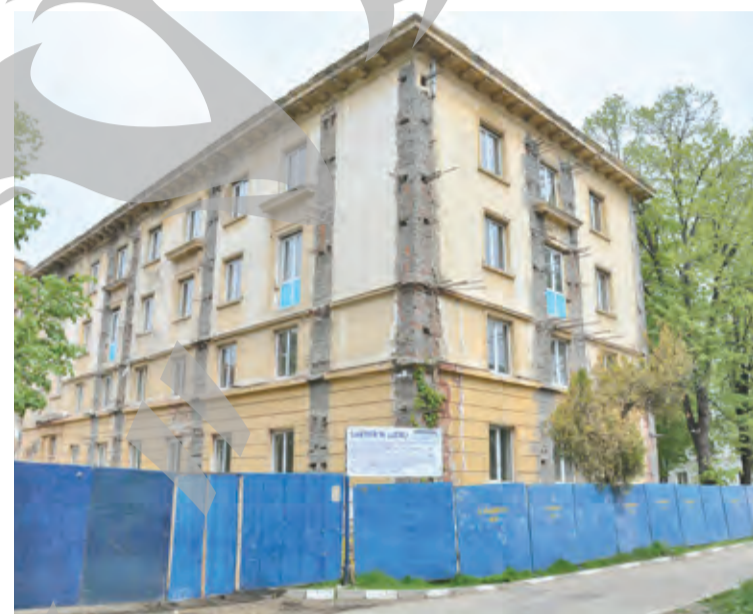
► Căminul A va fi ultramodern, cu 203 locuri de cazare în apartamente de o cameră sau două