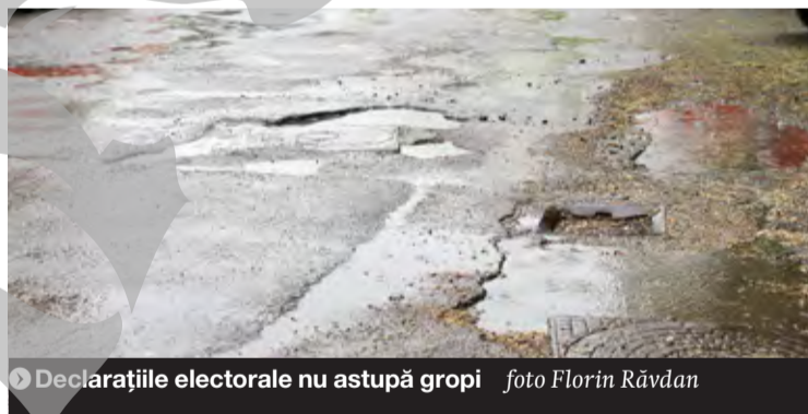
Declarațiile electorale nu astupă gropi