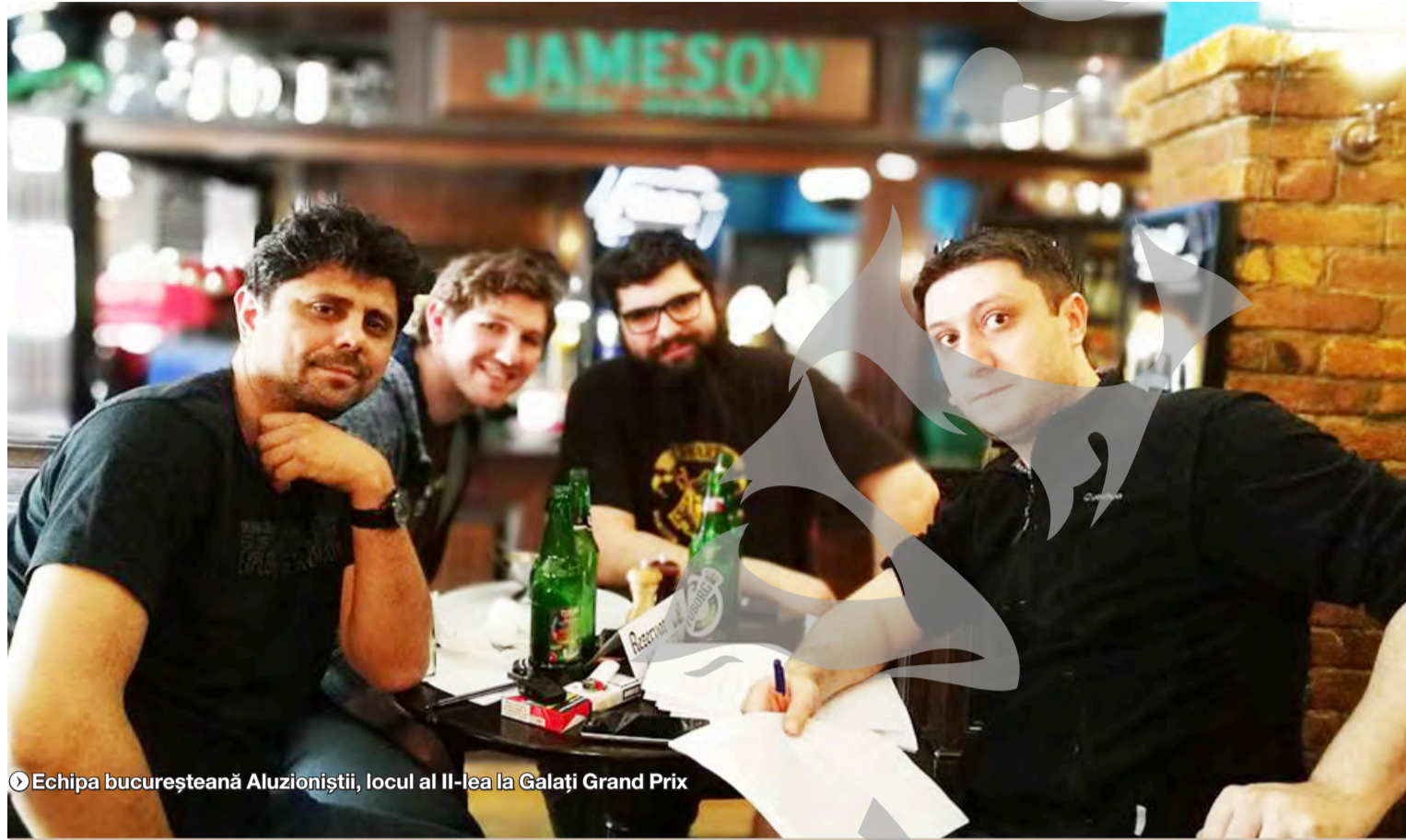
► Echipa bucureșteană Aluzioniștii, locul al II-lea la Galați Grand Prix

CONCURS DE CULTURĂ GENERALĂ ● COMPETIȚIE