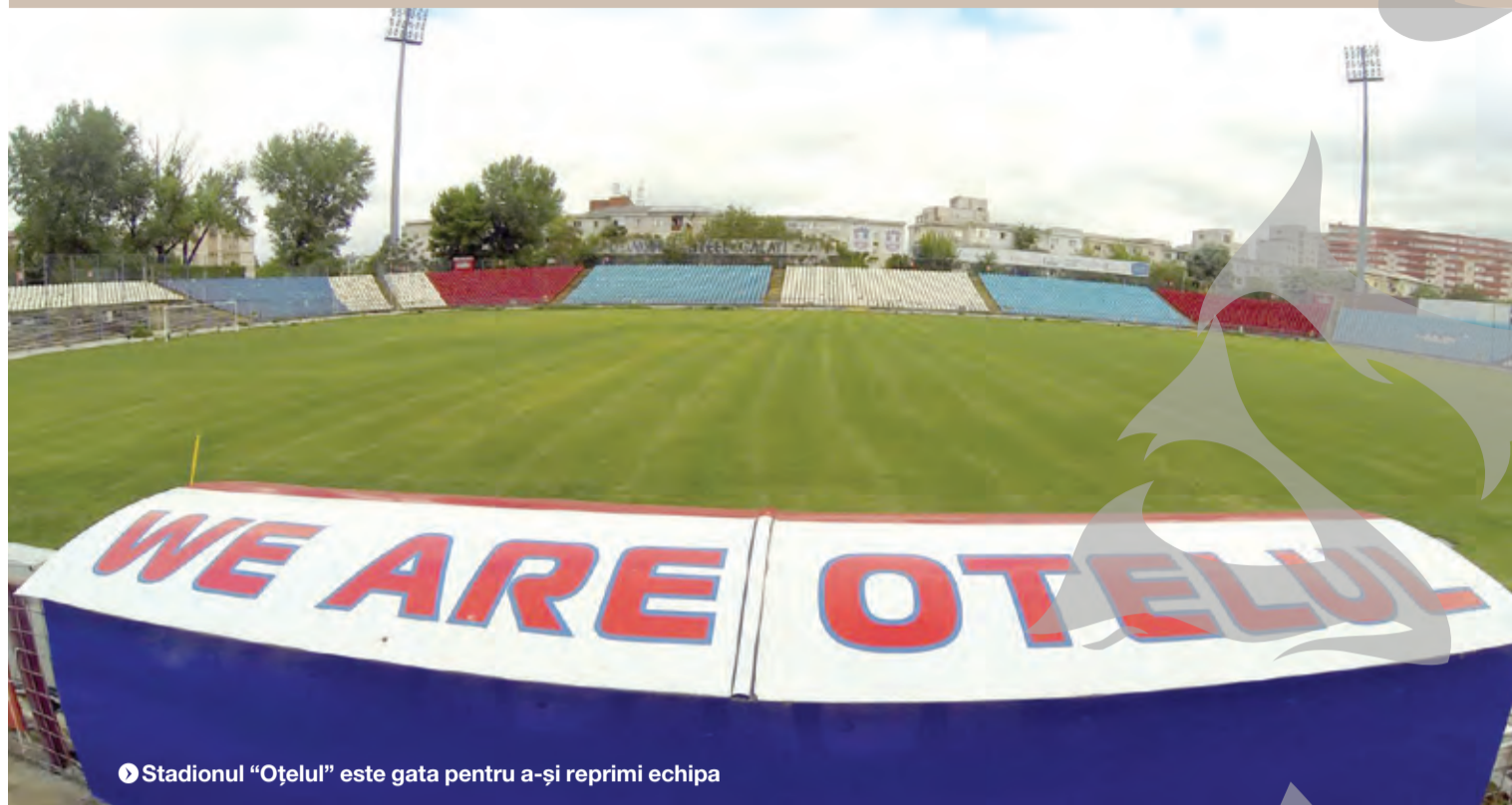
● Stadionul "Oțelul" este gata pentru a-și reprimi echipa