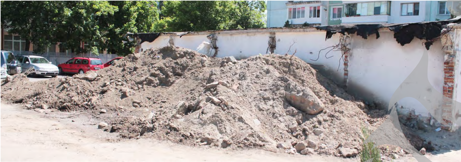
Supraviețuitoare al bateriei de garaje, coșmelia care a adăpostit punctul termic trebuie demolată

ȘANTIERELE ÎNTÂRZIATE ALE GALAȚIULUI ● REALITATE