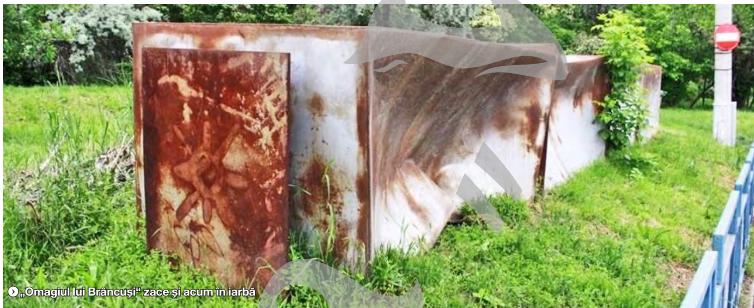
► „Omagiul lui Brâncuși” zace și acum în iarbă