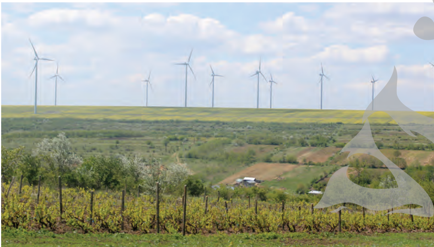
36 de turbine eoliene funcționează pe teritoriul comunei Corni

INFRASTRUCTURĂ DEFICITARĂ, INVESTIȚII RATATE ● ECONOMIE