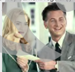
cu Sean Penn, Jude Law, Anthony Hopkins, Kate Winslet