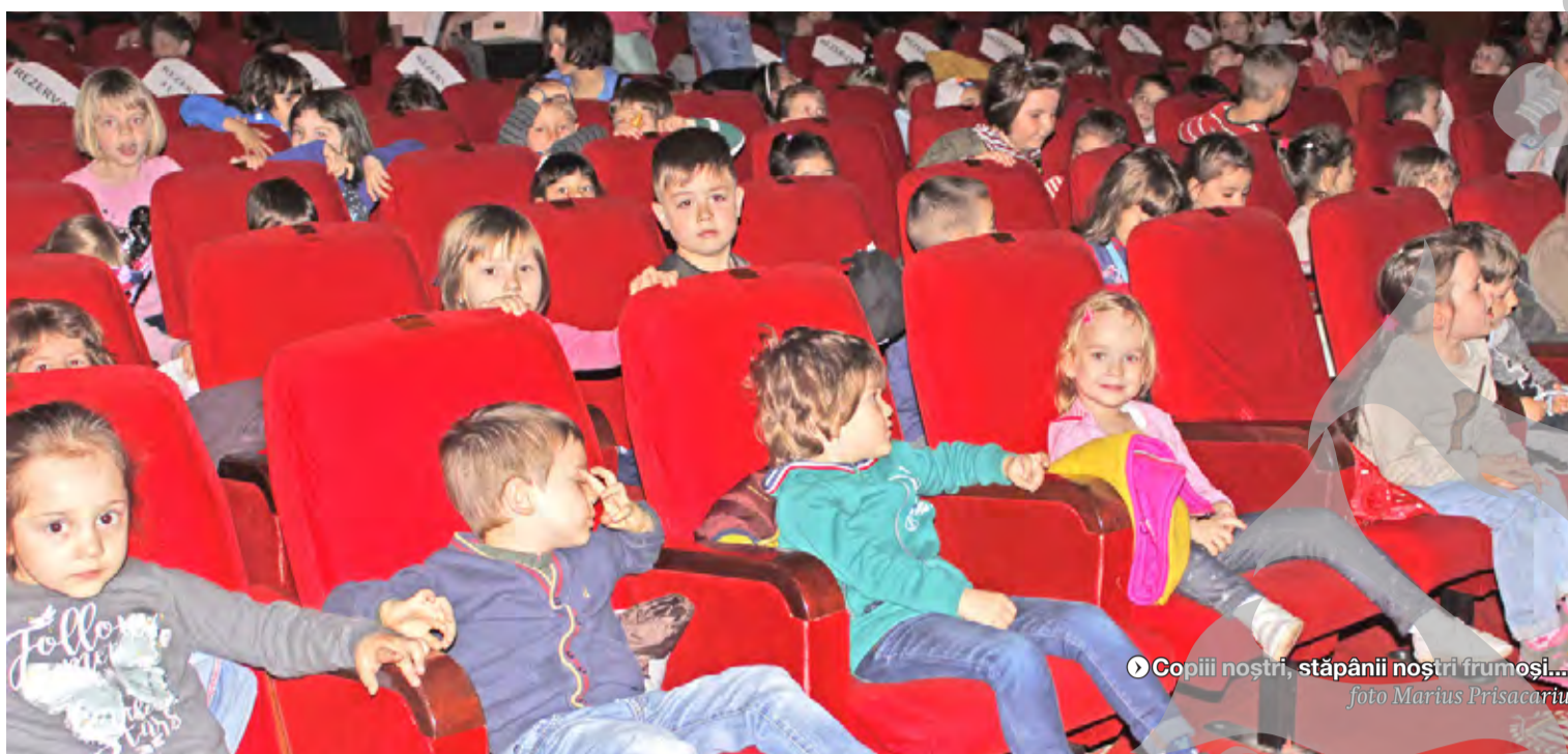
● Copiii noștri, stăpânii noștri frumoși...

PROGRAMUL FESTIVALULUI GULLIVER ● OFERTĂ