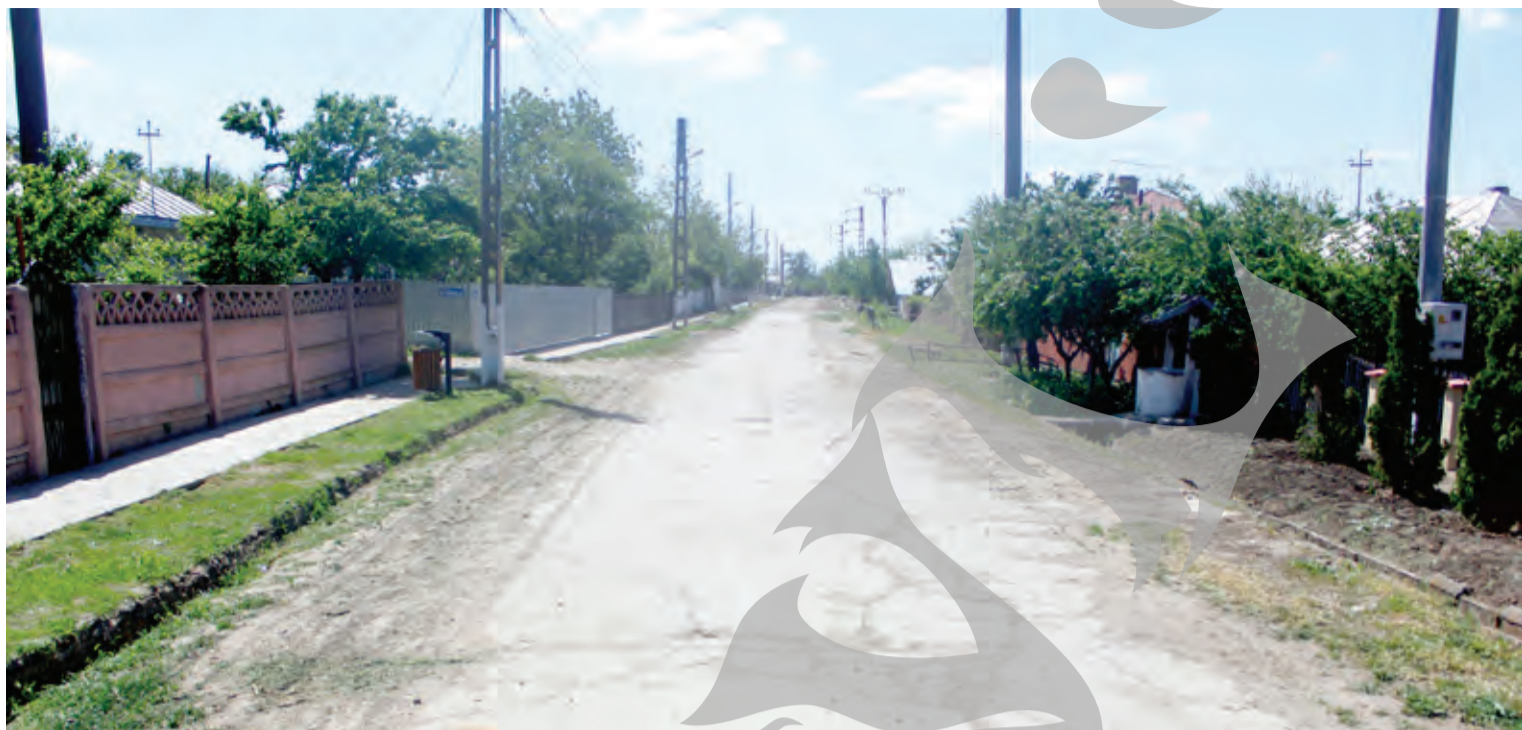
● Comuna Corni suferă de aceeași „boală” care afectează și restul comunităților rurale din Galați

TOT MAI PUȚINI OAMENI, DE LA AN LA AN ● SOCIAL