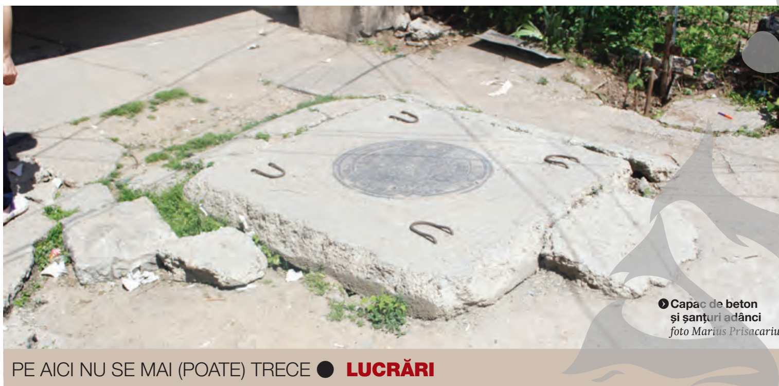
● Capac de beton și șanțuri adânci

PE AICI NU SE MAI (POATE) TRECE ● LUCRĂRI