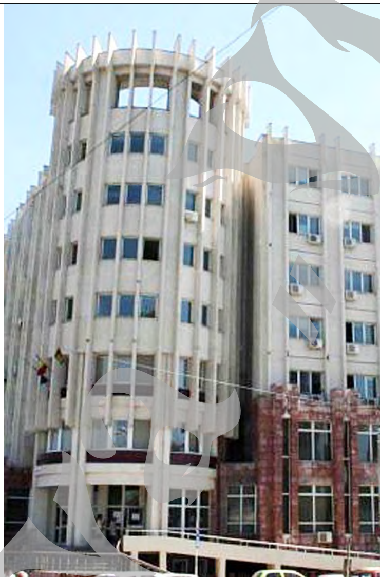
● Sediul AJFP Galați

Nu în ultimul rând, diminuarea încasărilor bugetare s-a datorat și unor noi prevederi legislative. Printre acestea se regăsesc eliminarea a 102 taxe, stabilirea sumei de 450.000 lei ca fiind neimpozabilă în cazul tranzacțiilor imobiliare, scutirea de impozit pe salariu a sezonierilor și eliminarea cotei de 2 la sută la impozitul pe venitul microîntreprinderilor, scutiri de la plata contribuției de asigurări de sănătate pentru anumite categorii, precum și dublarea sumei neimpozabile lunare pentru deducerea