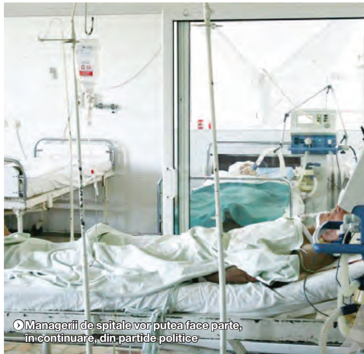
Managerii de spitale vor putea face parte, în continuare, din partide politice

Programul centrelor de permanență din județ