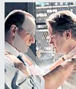
SUA, Crimă, Dramă