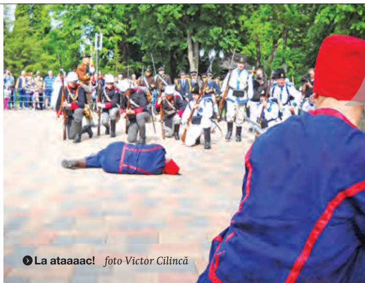
● La ataaaac!

Organizat de Direcția de Cultură a județului, deci de cinci oameni mari și lați, spectacolul de mai multe ore, cu de toate – și Istorie, inclusiv reconstituire is-