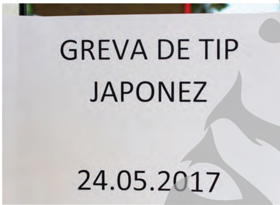
● Grevă japoneză nu a afectat programul de lucru cu publicul

ÎMPOTRIVA LEGII SALARIZĂRII PERSONALULUI PLĂTIT DIN FONDURI PUBLICE ● PROTEST