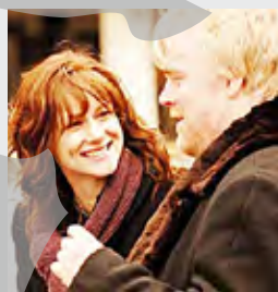
comedie, dramă, 2007

06:00 Ajunul Crăciunului 07:30 Cursa 09:45 Cu cele mai bune intenții 11:30 Vrajitorul minciunilor 13:45 Izvorul tinereții 15:00 Afacerea Est 16:25 Familia Savage