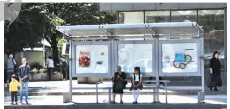
► Stație Potcoava de Aur