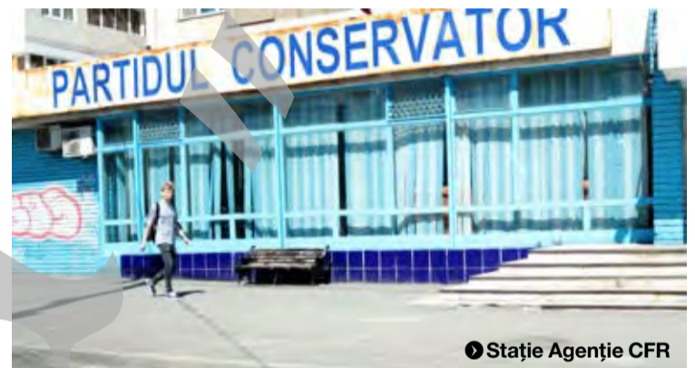
► Stație Agenție CFR