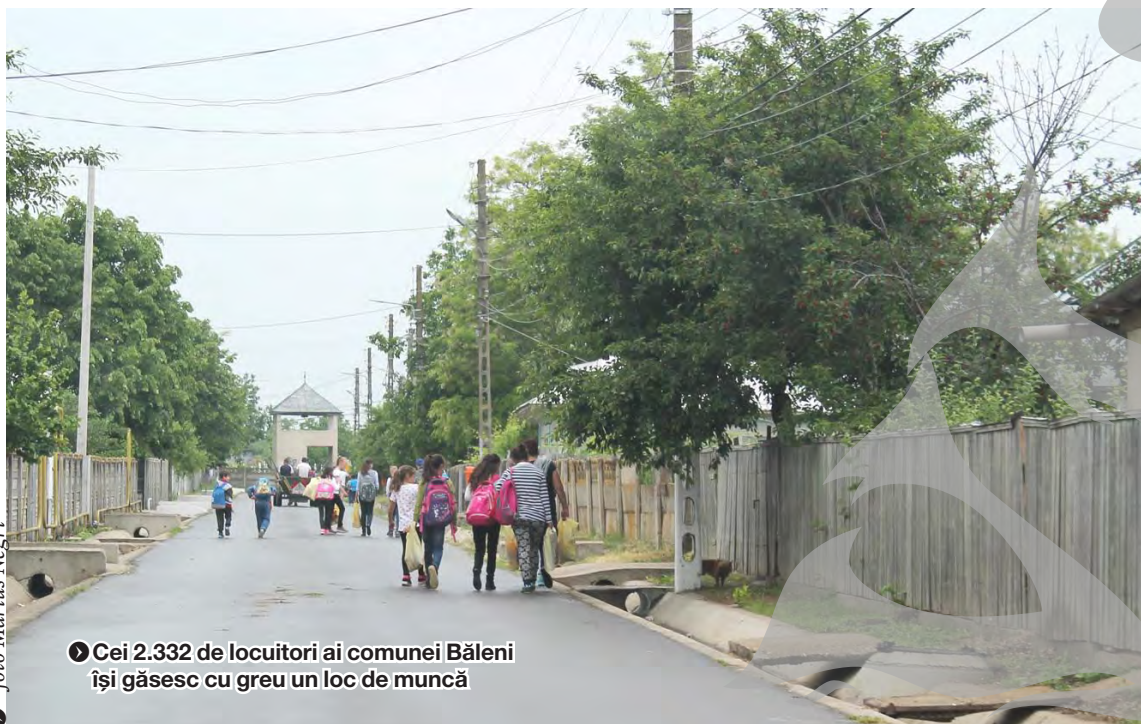
● Cei 2.332 de locuitori ai comunei Băleni își găsesc cu greu un loc de muncă

DACĂ NU EȘTI HARNIC, NU TRĂIEȘTI ● REALITATE