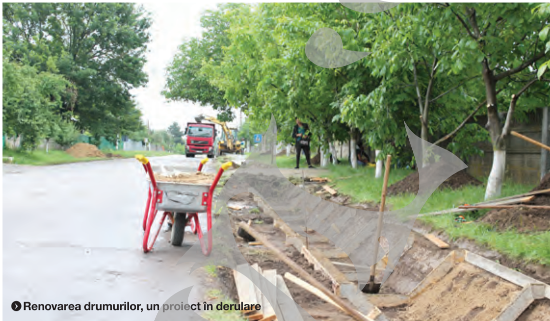
● Renovarea drumurilor, un proiect în derulare

COMUNĂ GĂLĂȚEANĂ MICĂ, VISURI MARI ● INVESTIȚII