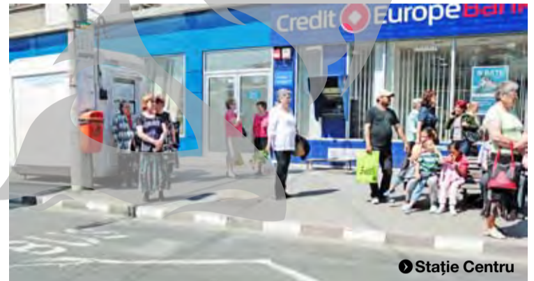
► Stație Centru