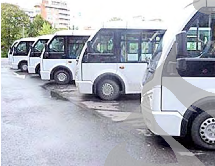
● În loc de autobuze SH am putea circula cu mijloace de transport noi

PLANURI PENTRU TRANSPORTUL LOCAL ● DECIZII