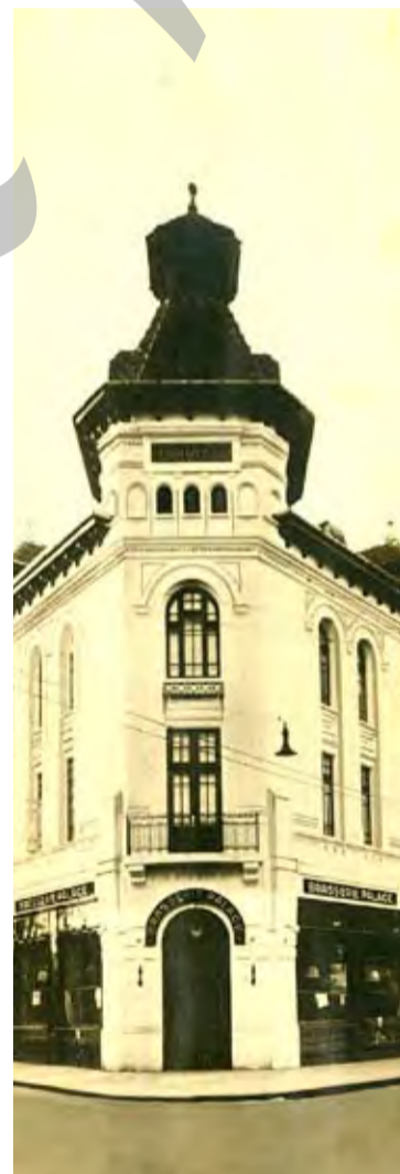
● Fotografie din Colecția Costel Gheorghiu, furnizată de Direcția Județeană pentru Cultură Galați

„Mă bucur că, într-un târziu, acest proces s-a terminat cu sorți de izbândă pentru Primăria municipiului Galați. Din acest moment nu vom mai avea nicio scuză pentru situația în care se află clădirea, dar asta nu înseamnă că de mâine clădirea va arăta așa cum era înainte. Trebuie să parcurgem pașii legali necesari, care implică o durată mai mică sau mai mare de timp, dar va fi unul dintre obiectivele mele până la sfârșitul mandatului. E posibil – nu am certitudinea – să transferăm clădirea către Consiliul Județean care, în acest moment,