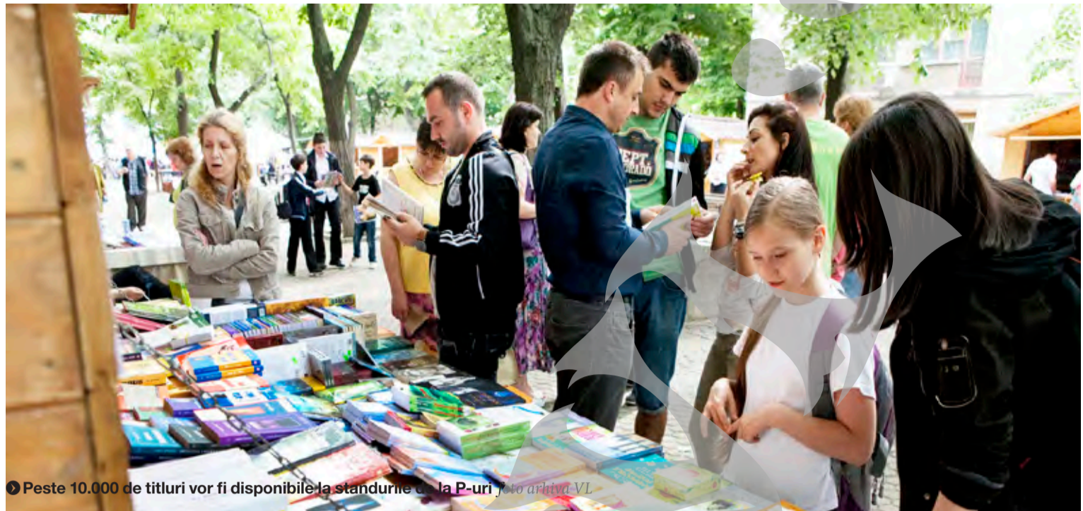
► Peste 10.000 de titluri vor fi disponibile la standurile de la P-uri.

site-ul Apă Canal. Între orele 8,30 și 11,00, apa potabilă va fi sistată pentru blocurile I6A, I6B, I6C, I5A, I5B, I5C și I5D din Micro 17, iar în intervalul 9,00 – 11,30 – pentru blocurile C1, C2, C3, C4, B2, B6, R1, R2, R3 și R4 din Mazepa I. ● C.D.