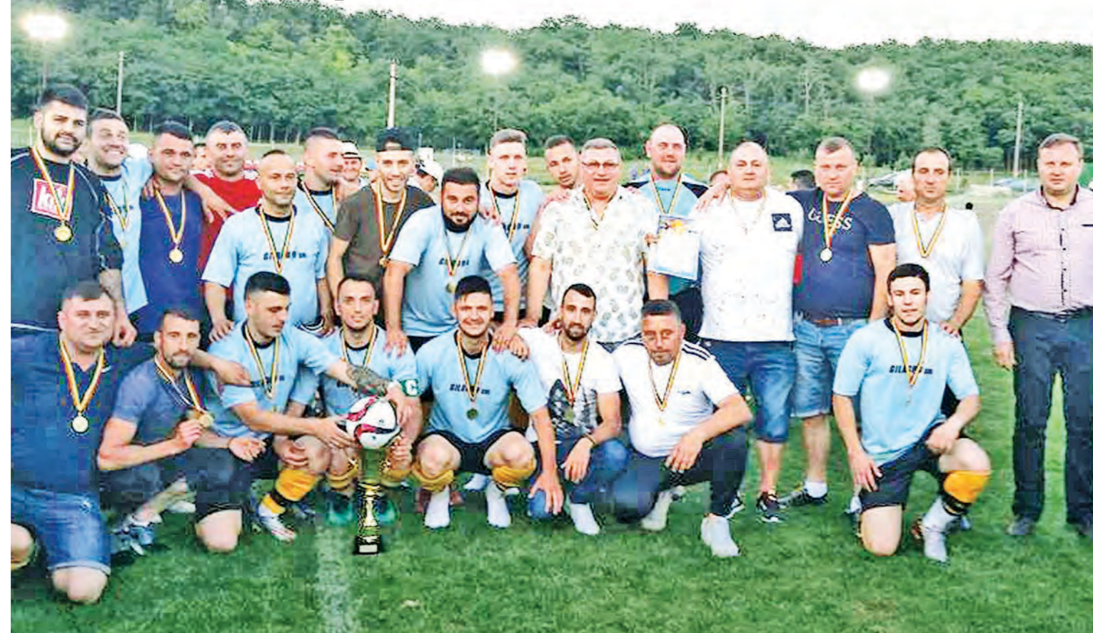
● Cei de la Zimbrul Slobozia Conachi, câștigători ai finalei județene