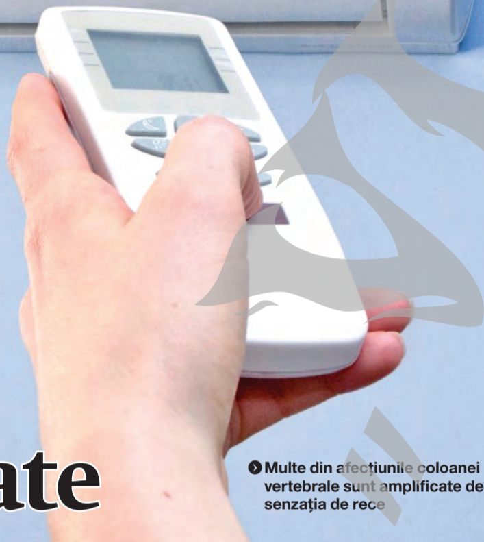
● Multe din afecțiunile coloanei vertebrale sunt amplificate de senzația de rece