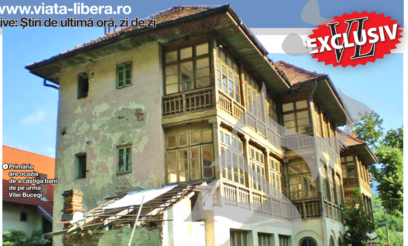
► Primăria are ocazia de a câștiga bani de pe urma Vilei Bucegi

ÎN LOC SĂ FIE CASATĂ, VA FI VÂNDUTĂ ● LICITAȚIE