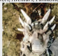
SUA, Aventuri, Fantastic