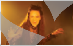
SUA, Romania, Horror