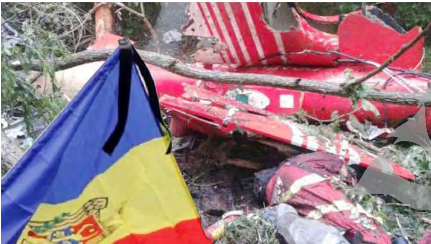
● Patru oameni și-au pierdut viața, încercând să salveze alte vieți