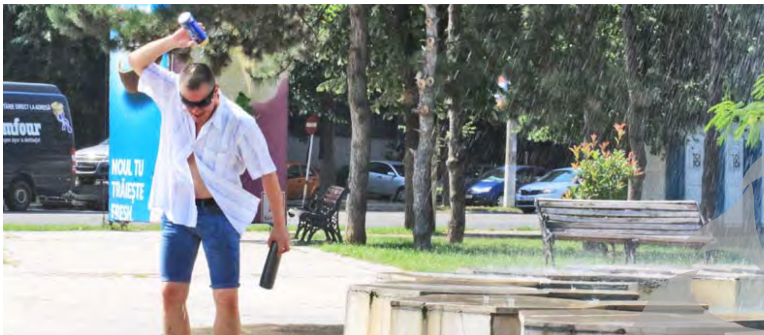
● Avertizarea Cod roșu este valabilă de la ora 10,00 și până la ora 21,00

S-AU ÎNMULȚIT APELURILE LA AMBULANȚĂ ● AVERTIZARE