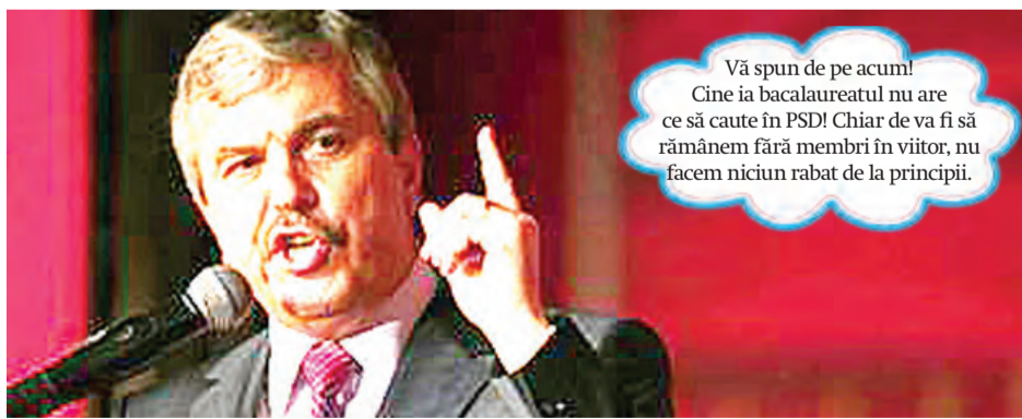
► Elevii știu că tot răul e spre bine

Vă spun de pe acum! Cine ia bacalaureatul nu are ce să caute în PSD! Chiar de va fi să rămânem fără membri în viitor, nu facem niciun rabat de la principii.