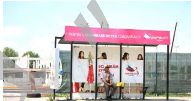
● Stația Carrefour, Bd. George Coșbuc