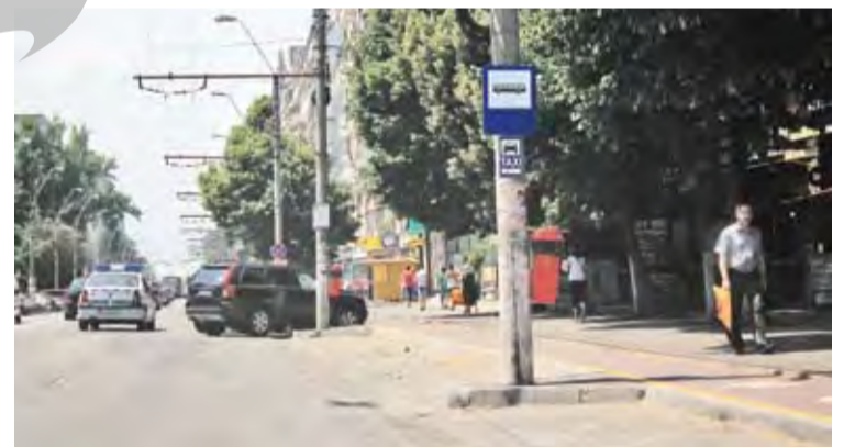
● Stația Service Vechi