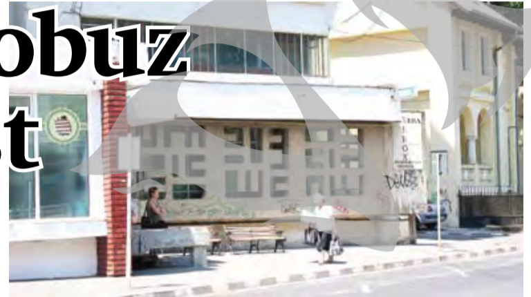
● Stația Albatros