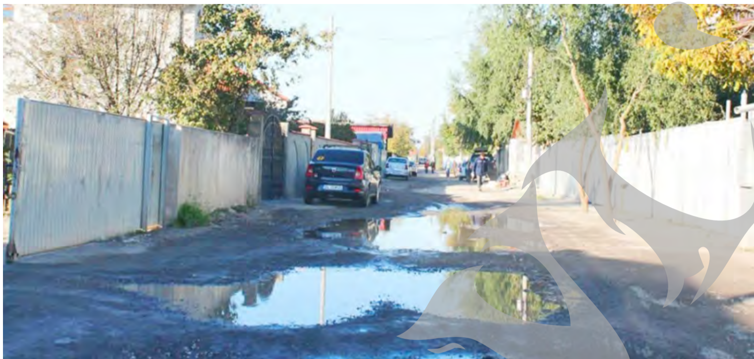
● Așa arată strada Leonida Zamfirescu după o ploaie

de șofer. Un al doilea, de 31 de ani, depistat la Poiana, în timp ce conducea o autoutilitară, avusese permis, dar acesta îi fusese suspendat din cauza unei alte abateri. Ambii riscă pedeapsa cu închisoarea. ● M. Constandache