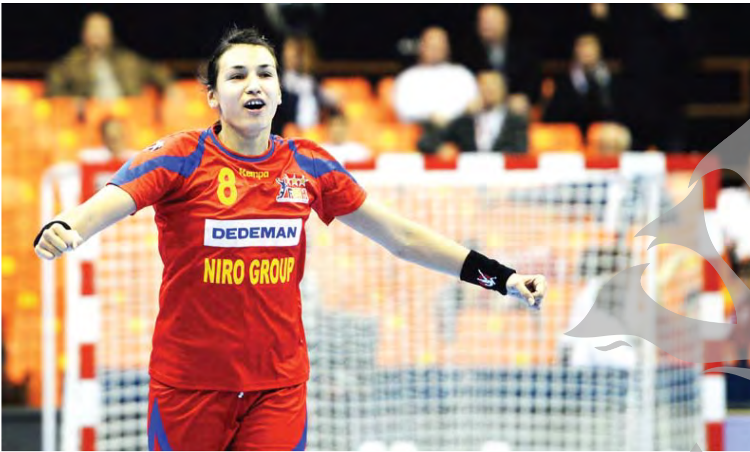
● Cristina Neagu, cel mai răsunător transfer pentru sezonul următor al Ligii Naționale