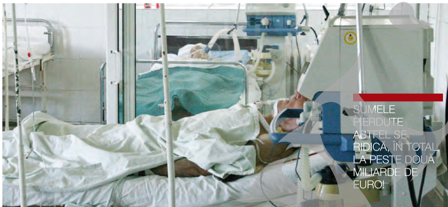
● În timp ce banii erau ținuți în conturi, pacienții au stat internați în condiții mizere

ATENȚIONARE. Pe lângă faptul că au ținut în conturi sute de milioane de lei, sume care ar fi reprezentat o gură de oxigen pentru un sistem de sănătate muribund, miniștrii sănătății din perioada 2011-2015 sunt campioni și la investiții total inutile. Astfel, aceștia au plătit 44,62 milioane de lei pentru un proiect de informatizare care nu s-a finalizat, nu s-a implementat și nu a fost pus în funcțiune. De asemenea, au plătit 114,8 milioane lei pe studii de fezabilitate, studii de fezabilitate, ghiduri arhitecturale, proiecte tehnice și servicii de expertiză pentru lucrări care nu s-au mai efectuat, inclusiv la 15 spitale județene de urgență. Obiectivele de investiții inițiate în coordonarea MS au avut ca durată de realizare o perioadă mare de timp - respectiv, între 15 și 19 ani, ceea ce a avut consecințe asupra creșterii valorii obiectivelor și implicit asupra majorării resurselor alocate pentru finalizarea acestora. Nu în ultimul rând, aparatură medicală în valoare estimată de 98,5 milioane lei a fost pusă în funcțiune/exploatată uneori cu întârzieri de peste 300 zile. În alte cazuri, nu a mai fost dată deloc în exploatare. ● R.B.