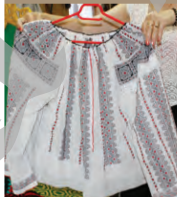
● Le veche de 150 de ani

a reușit să adune o zestre considerabilă, un război de țesut, un pat, o ie veche de 150 de ani și multe altele.