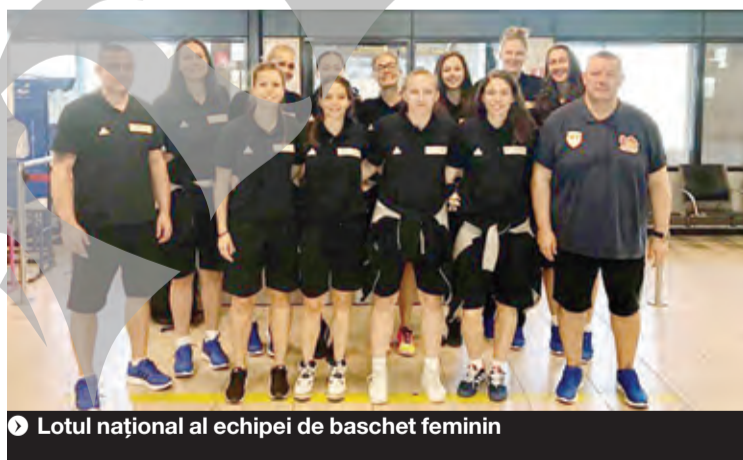
▶ Lotul național al echipei de baschet feminin

Conform programului organizatorilor, astăzi se vor disputa primele meciuri din cadrul turneului de baschet feminin, unde sunt prezente 16 echipe, împărțite în patru grupe. Reprezentativa României (antrenori Dragan Petricevic și Miljan Medved) va juca în