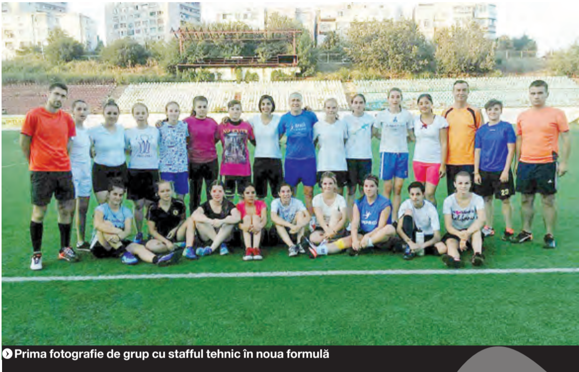
▶ Prima fotografie de grup cu stafful tehnic în noua formulă

MARIAN CĂPĂȚÎNĂ marian.capatina@viata-libera.ro