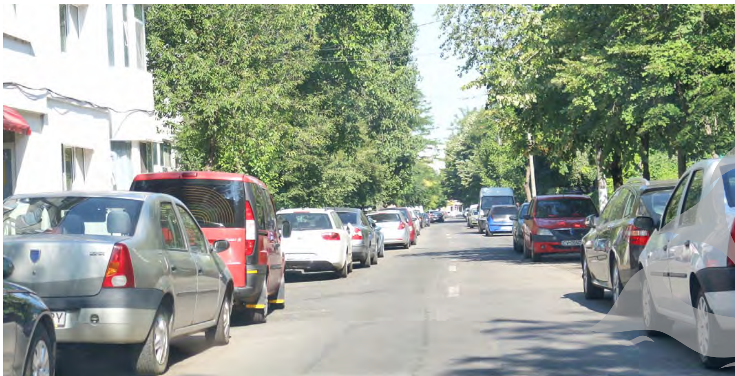
Pe unele străzi, abia încap o mașină în trafic