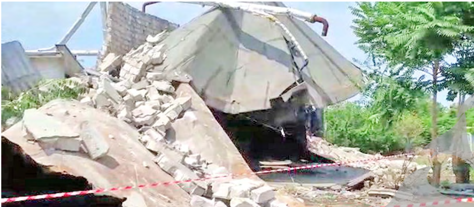
18 autoturisme au fost luate de apă și avariate

DEZASTRU LA O FABRICĂ DIN TECUCI ● ACCIDENT