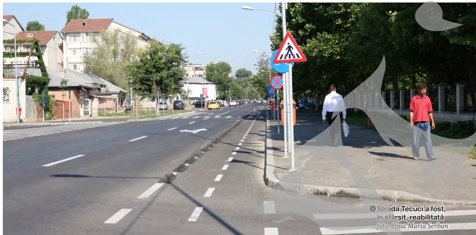
► Strada Tecuci a fost, în sfârșit, reabilitată

Beneficiile pistei de biciclete de pe Tecuci