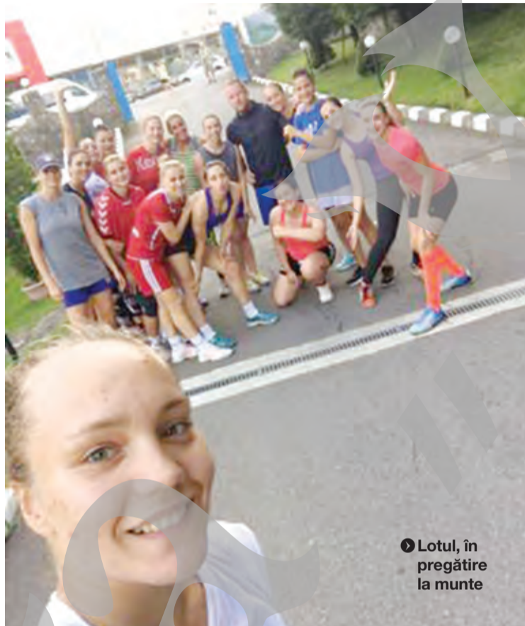
◆ Lotul, în pregătire la munte

- Ne dorim ca startul în noul sezon să ne găsească bine puși la punct cu pregătirile, iar o dată intrați în joc să demonstrăm că am învățat multe din campionatul trecut. Vrem o clasare cât mai onorabilă, de pildă, una între primele opt echipe. În viitorul sezon se vor confrunta 14 echipe, în Liga Națională, ultimele două vor retrograda, iar alte două vor participa la baraj. Avem potențial, am câpătat și experiență, pentru a fi scutiți de emoții la finele campionatului. ●