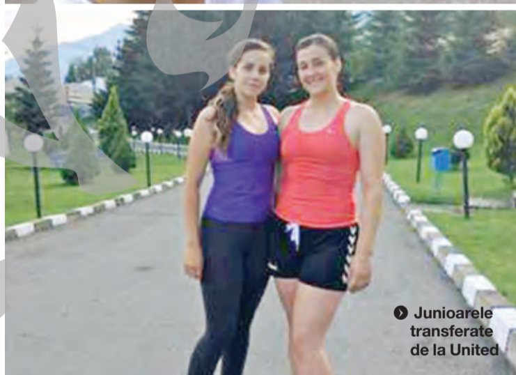
◆ Junioarele transferate de la United