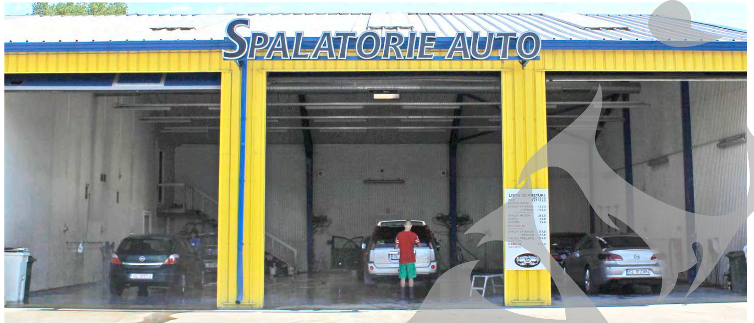
40 de spălătorii auto au fost verificate de polițiștii locali