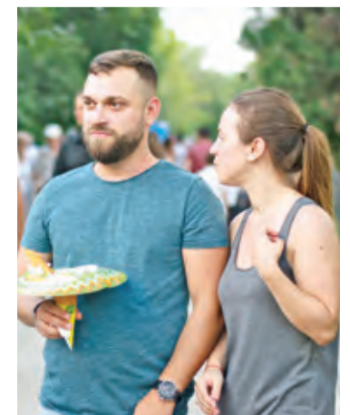
» "Ar fi mai bine dacă s-ar mai tunde iarba"