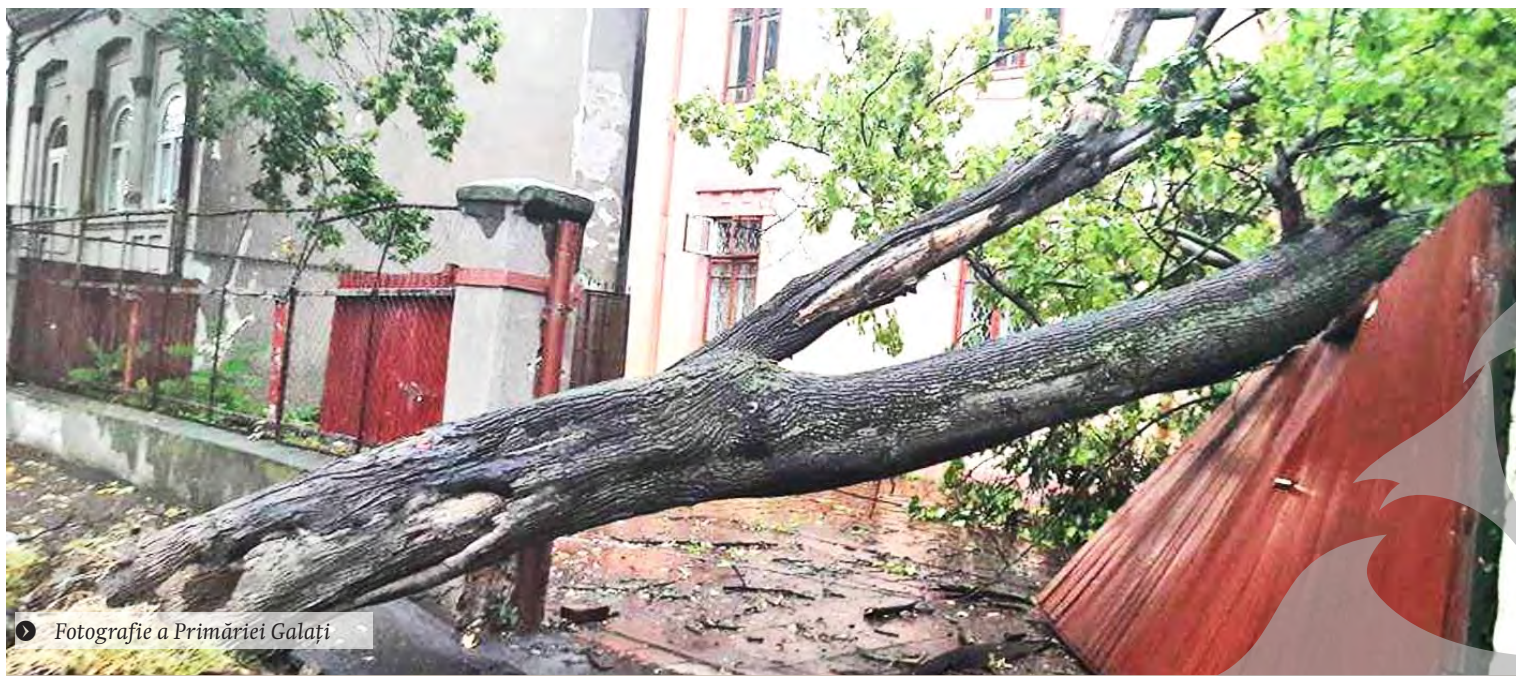
Fotografie a Primăriei Galați

OAMENI RĂNIȚI, COPACI RUPTI, STĂLPI CĂZUȚI ● DEZASTRU