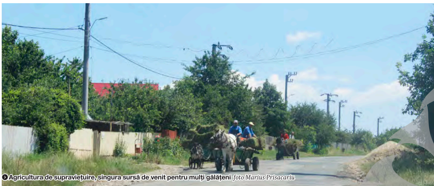
● Agricultura de supraviețuire, singura sursă de venit pentru mulți gălățeni

PREA MULȚI ASISTAȚI, PREA PUȚINE POSIBILITĂȚI ● ÎNGRIJORĂTOR