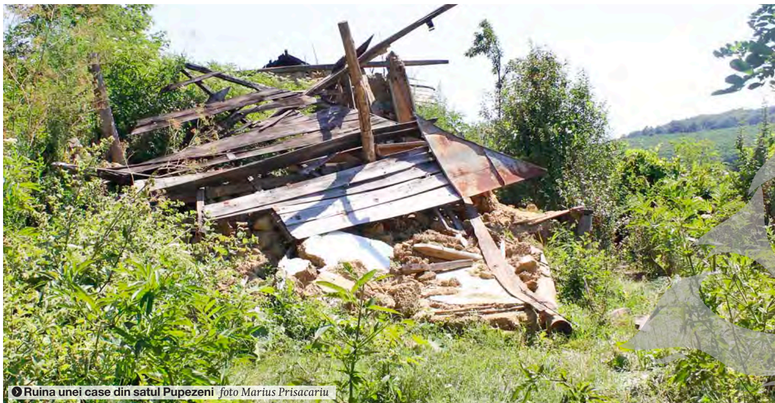
➤ Ruina unei case din satul Pupezeni

LOCALITĂȚILE TĂCUTE DIN NORDUL JUDEȚULUI GALAȚI ● DEPOPULARE