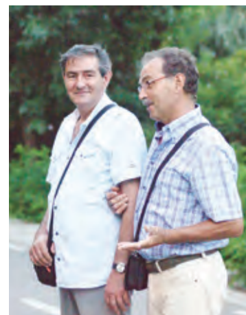
» "Vin cu plăcere, dar ar mai merge îmbunătățită"