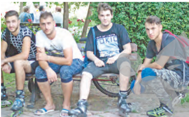
● "Pista pentru bicicliști e surpată pe alocuri. Nici pentru rolleri nu e bine!"