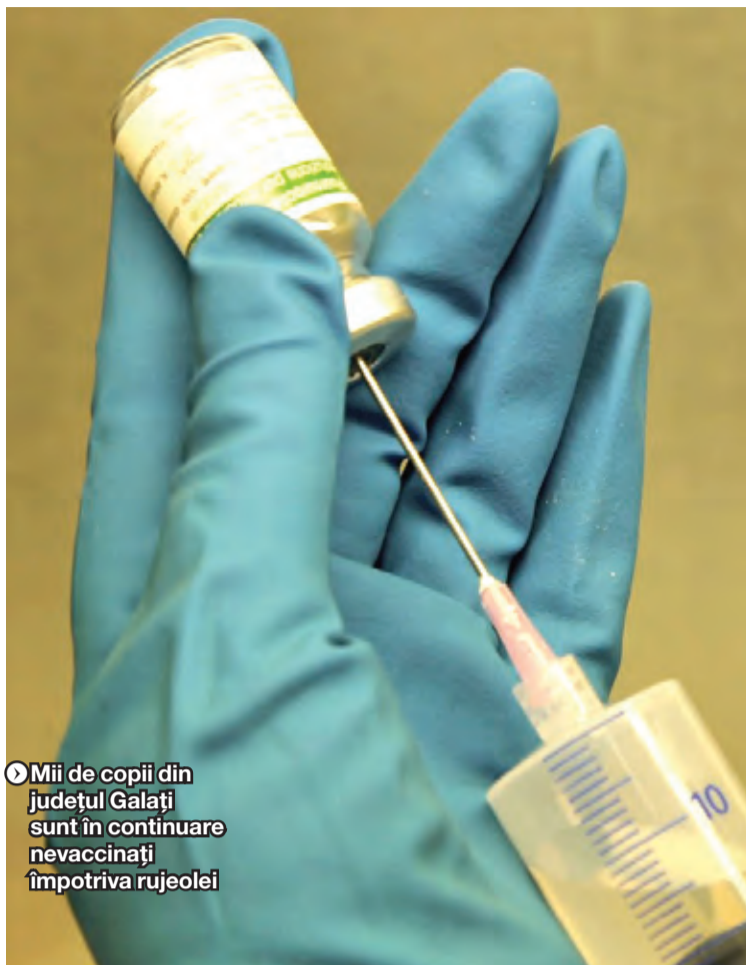
► Mii de copii din județul Galați sunt în continuare nevaccinați împotriva rujeolei