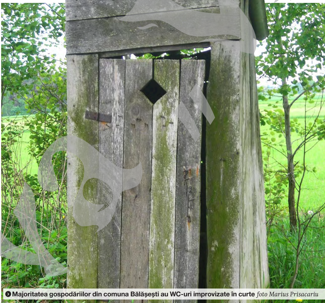
Majoritatea gospodăriilor din comuna Bălăești au WC-uri improvizate în curte

„Este un fapt cu care nu ne mândrim. Deși la Bălăești și Ciureștii Noi avem apă potabilă, sistemul de canalizare nu există încă. Avem un proiect depus în această privință, însă eu mă tem să mă bat în continuare pentru el, deoarece comuna este foarte săracă și nu știu câți dintre locuitori ar putea și ar vrea să se branșeze. Din