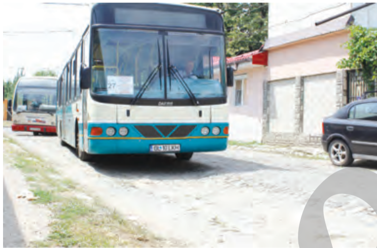
● O stradă numai bună să-ți rupi roțile. Sau gâtul