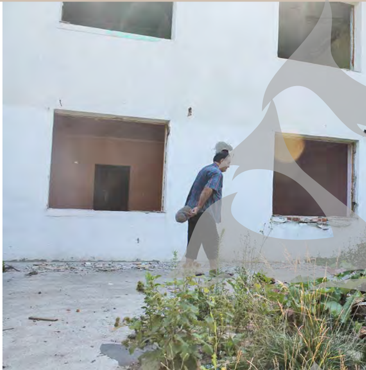
● Multe dintre apartamentele din cartier au fost evacuate

FLORIN RĂVDAN florin.ravdan@viata-libera.ro