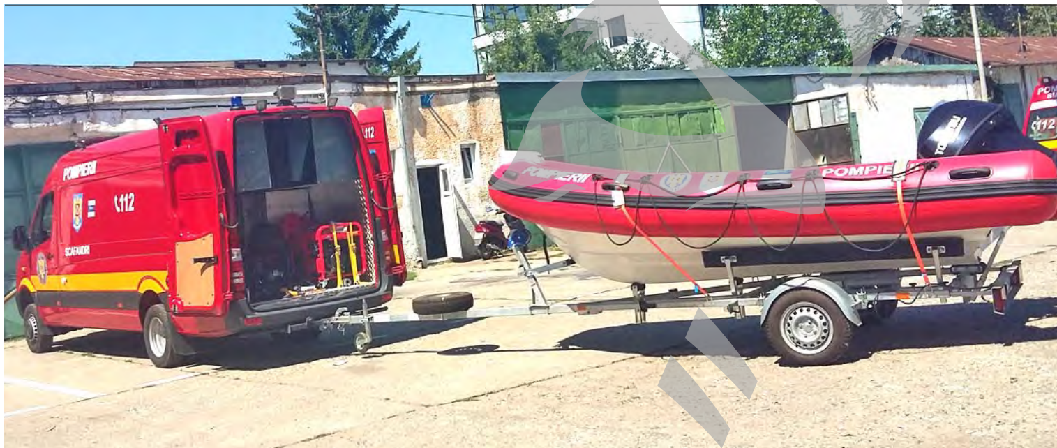
● Autospeciala este dotată și cu barcă pneumatică