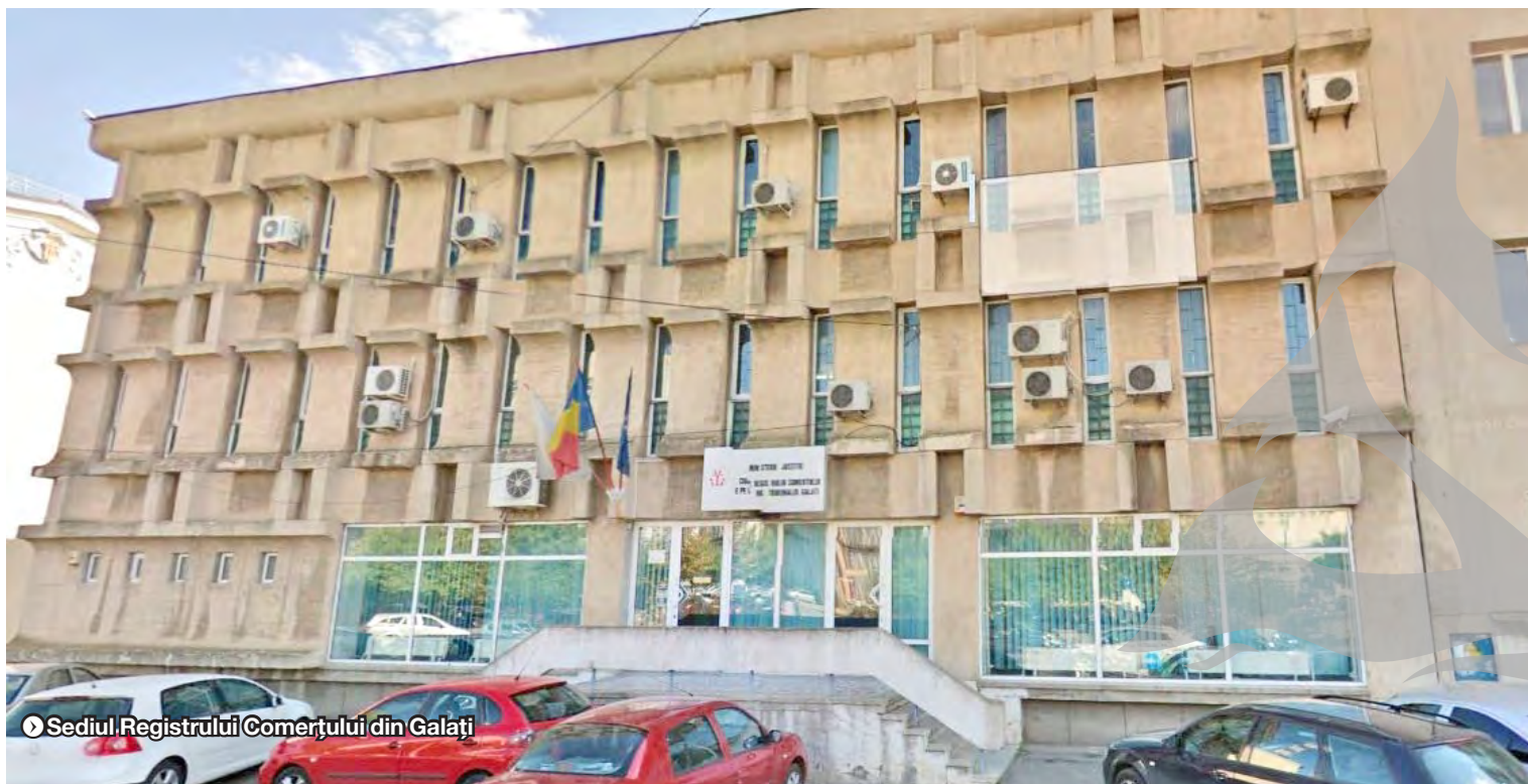
Sediul Registrului Comerțului din Galați

NUMĂRUL FIRMELOR ÎNMATRICULATE DE LA ÎNCEPUTUL ANULUI ● STATISTICI