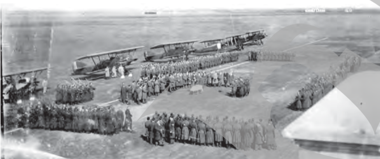
► Imagini din Colectia Dan Antoniu, București, publicate în volumul „Galați, o poveste cu aviatori”, de Dan Antoniu și Violeta Ionescu