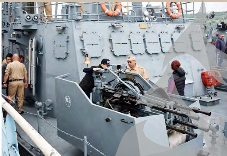
● Sursa foto: Facebook Flotila Fluvială "Mihail Kogălniceanu"

reprezentanții Primăriei au transmis totodată și programul ceremonialului organizat, pe 15 august, în garnizoana Galați, pe Faleza Inferioară, la "Elice". Manifestările vor debuta, la ora 16,30, cu muzică de promenadă, după care, la ora 16,45, este programată alinierea Gărzii de Onoare. La ora 16,50, va avea loc întâmpinarea comandantului Flotei, iar la 16,55, prezentarea raportului Gărzii de Onoare către amiralul Flotei. La ora 16,57, va fi intonat Imnul de Stat al României și ridicarea Drapelului. De la ora 17,00, sunt programate citirea mesajului comun și o serie de alocuțiuni ale oficialităților, iar de la 17,45, încep acțiunile care îi atrag cel mai mult pe gălățeni: defilarea Gărzii de Onoare, lansarea la apă a "Ancorei de flori", urmate de parada navelor militare și civile, cu exerciții din amonte în aval. ●