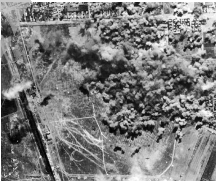
► Bombardarea aeroportului Galați

Ultimele urme ale aeroportului au fost puse la pământ în anul 2013, când a fost demolată Fabrica de Sărmă, Cuie și Lanțuri, pentru a se construi un mall. ●