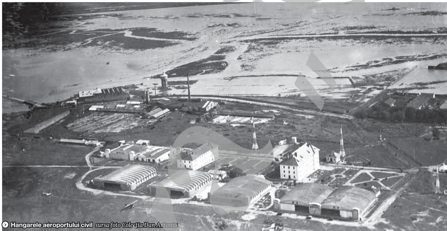
▶ Hangarele aeroportului civil

www.viata-libera.ro Viața așa cum e TVAIOERS SPECIAL