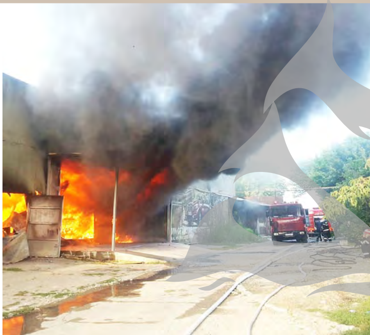
● Flăcările au pornit dintr-o hală în care erau materiale plastice și cartoane

Munca pompierilor s-a dovedit foarte dificilă, atât din cauza vântului, care și-a schimbat direcția de mai multe ori, dar și din cauză că în zonă au fost probleme cu alimentarea cu apă. „Am avut probleme cu alimentarea cu apă. În sprijinul nostru au venit și cisterne cu apă de la Apă-Canal, pentru a asigura alimentarea autospecialelor“, a adăugat lt. col. Eugen Chiriță.