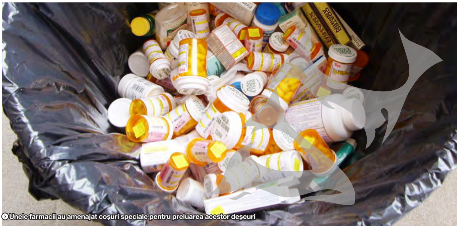
Unele farmacii au amenajat coșuri speciale pentru preluarea acestor deșeuri

copiilor. Donația a fost făcută de Clubul Rotary București (organizație neguvernamentală), care a anunțat că va continua, și în acest an, proiectul de echipare a secției ORL din cadrul spitalului amintit, venind în sprijinul comunității prin dotarea cu echipamente de diagnosticare în valoare de 22.000 de lei. ● R.B.