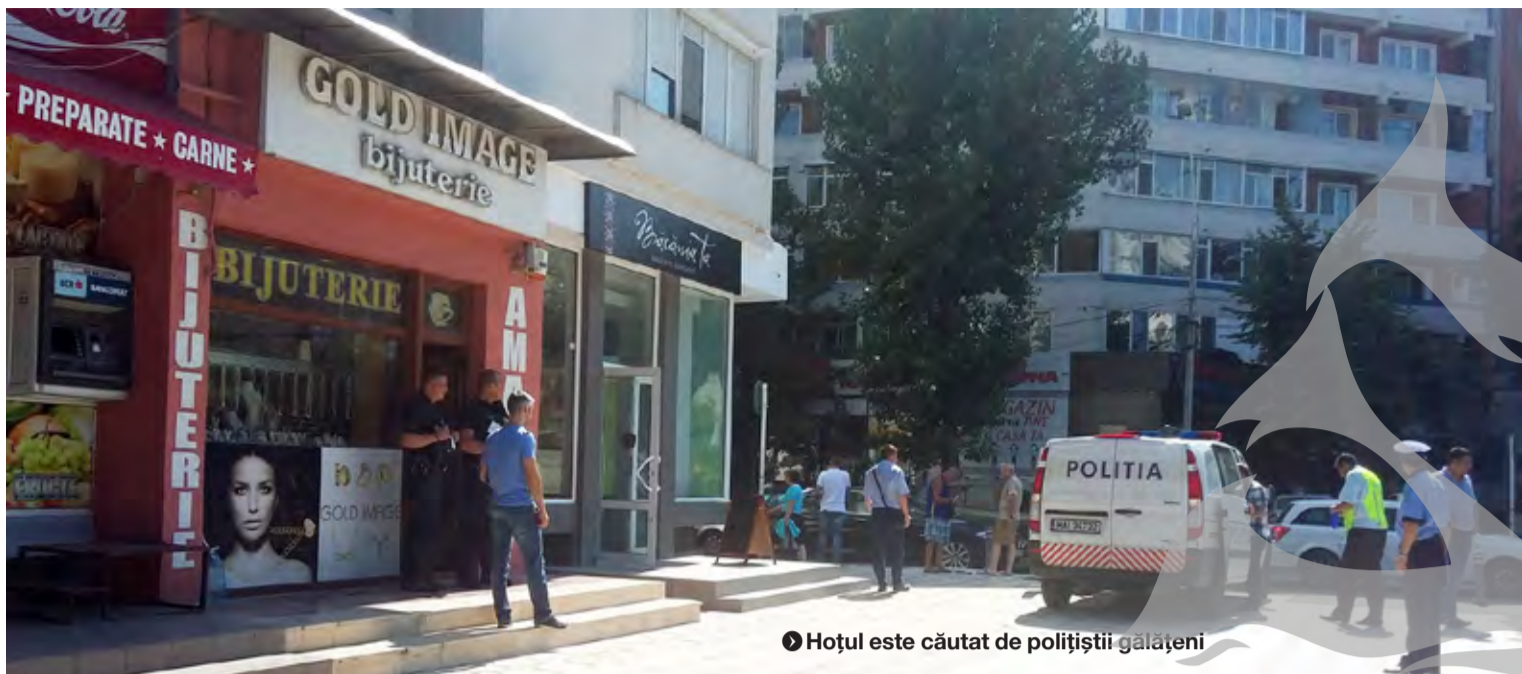
● Hoțul este căutat de polițiștii gălațeni