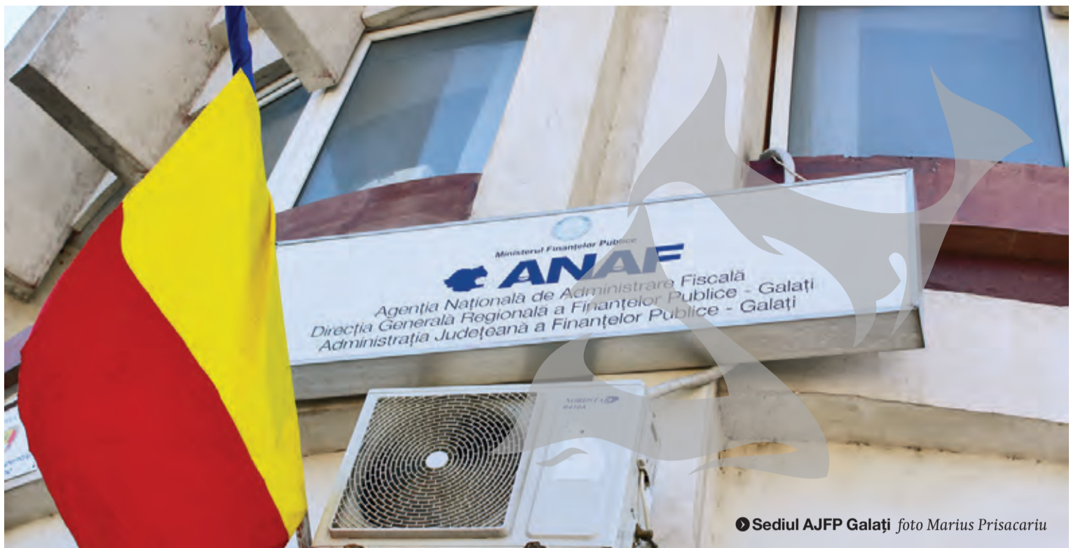
► Sediul AJFP Galați

Valoarea totală a acestor tranzacții s-a ridicat la circa 140 milioane de euro, cu 60 la sută mai mare decât în primul semestru din 2016. Aproximativ 2,6 milioane au fost tranzacții online cu cardul, media unei plăți fiind de circa 50 de euro. ● C.L.