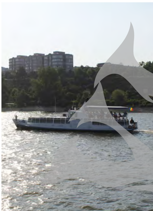
De Ziua Dunării, gălățenii au avut parte de plimbări cu vapoarele